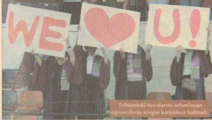
Tribündeki hocalarını selamlayan öğrencilerin sevgisi karşılıksız kalmadı.