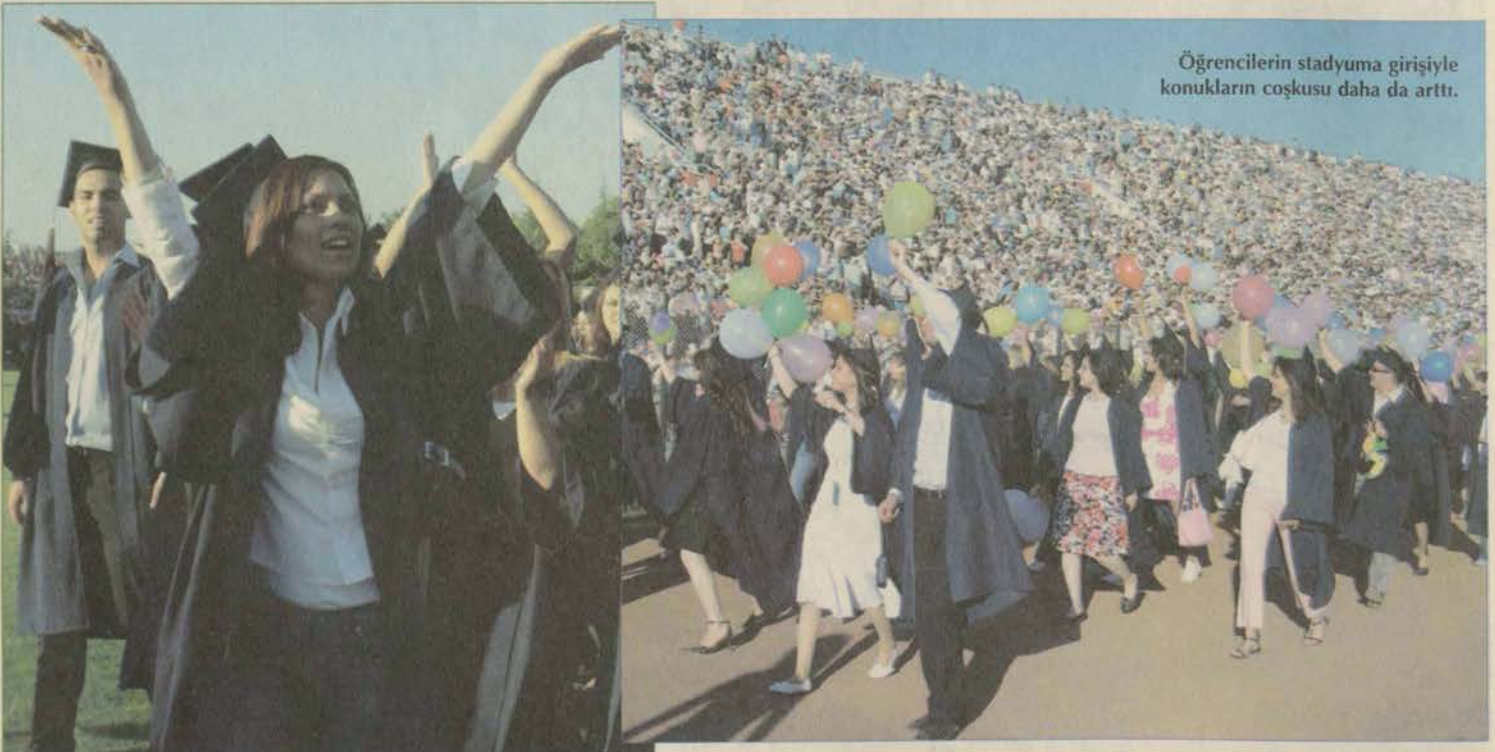
Öğrencilerin stadyuma girişiyle konukların coşkusu daha da arttı.