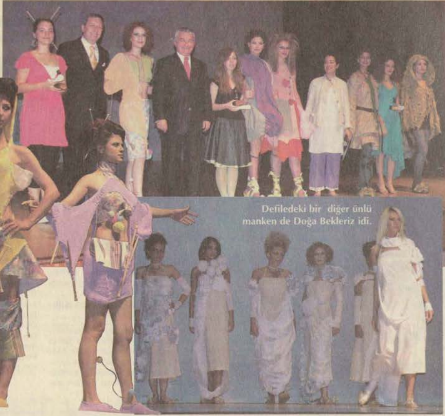
Defiledeki bir diğer ünlü manken de Doğa Bekleriz idi.