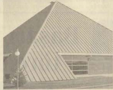
seramik ve kompozit malzemeler ile ilgili araştırma ve geliştirme çalışmalarından oluşuyor.

Teknopark bünyesinde araştırma merkezleri, laboratuvarlar ve sosyal tesisler yer alacak. İhracat şansı yüksek, uluslararası pazarda rekabet edebilir malların üretilmesini hedefleyen Eskişehir Teknopark'ındaki ana etkinlik alanları, bilgisayar ve bilişim teknolojileri, yazılım ve donanım, iletişim elektrik ve elektronik sanayi, plastik endüstrisi,