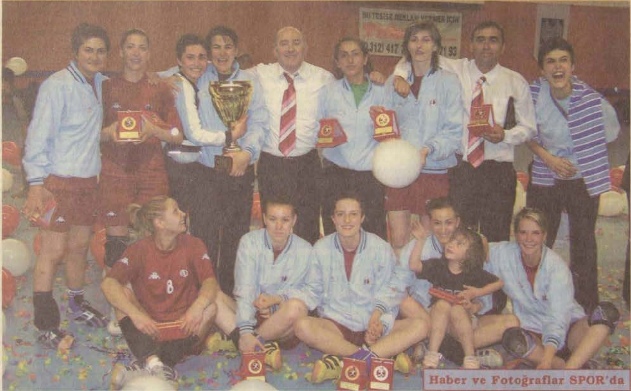
Haber ve Fotoğraflar SPOR'da