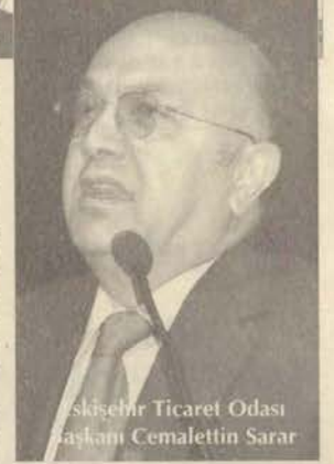
İstanbul Ticaret Odası Başkanı Cemalettin Sarar

Türkiye'deki 40 üniversite temsilcisinin katıldığı zirvede, üniversitemiz İşletme ve Ekonomi Kulübü, Ulusal İşletme ve Ekonomi Kulüpleri Zirvesi 1'nci dönem sözcülüğüne seçildi. Bu zirveyle birlikte Ulusal İşletme ve Ekonomi Kulüpleri