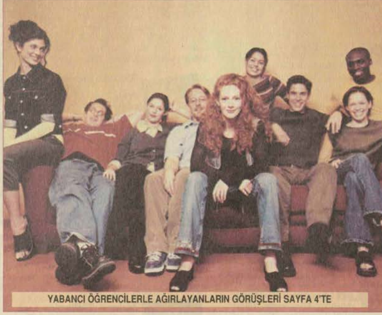
YABANCI ÖĞRENCİLERLE AĞIRLAYANLARIN GÖRÜŞLERİ SAYFA 4'TE