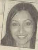
Okt. Gaye Bayrı

Yabancı Diller Yüksekokulu Anadolu Üniversitesi'nin yeni gelen öğretim elemanlarına yönelik uyguladığı oryantasyon programını çok beğendim. Üniversitemin sosyal yaşamını, faaliyetlerini ve imkanlarını daha yakından tanıma fırsatı elde etmiş oldum. Türkiye'de öğrencilerine ve öğretim elemanlarına bu kadar olanağı bir arada sunan ender üniversitelerden olan üniversitemizin bu yanlarını görebilmem gerçekleşen oryantasyon programı sayesinde olmuştur. Bu programın organizasyonunda emeği geçen herkese teşekkür ederim.