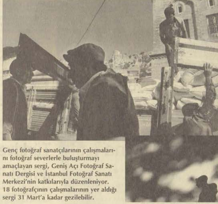
Genç fotoğraf sanatçıların çalışmalarını fotoğraf severlerle buluşturmayı amaçlayan sergi, Geniş Açık Fotoğraf Sanatı Dergisi ve İstanbul Fotoğraf Sanatı Merkezi'nin katkılarıyla düzenleniyor. 18 fotoğrafçının çalışmalarının yer aldığı sergi 31 Mart'a kadar gezilebilir.