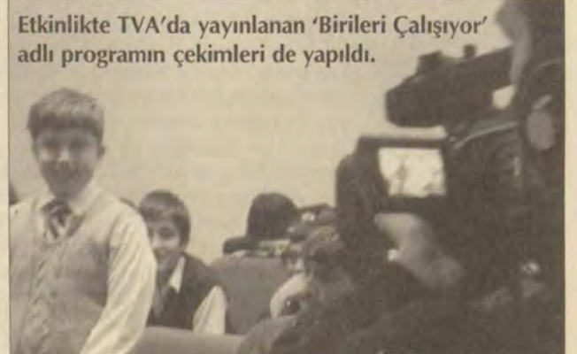
Etkinlikte TVA'da yayınlanan 'Birileri Çalışıyor' adlı programın çekimleri de yapıldı.