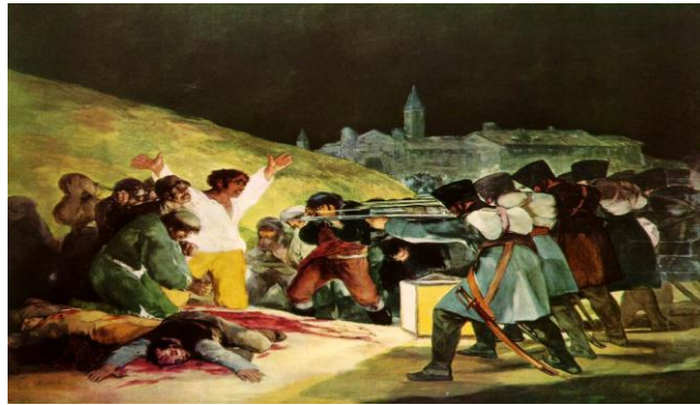
Görsel 1. Francisco Goya, 3 Mayıs 1808, 266 x 345cm, TÜYB, 1814.

Öncesinde tanımları yapılan biçim ve içerik kavramlarının tanımlanmasına yönelik tartışmalar günümüzde de devam etmektedir. Ancak öncelik biçime de ait olsa içeriğe de ait olsa, sanatçının içinde bulunduğu toplumsal koşullar eserin biçim veya içeriğine bir şekilde etki etmektedir. Sanatçıların duygu, düşünce ve tutumlarıyla ilgili ilişkili olan bu etkiler; kimi eserde biçimsel özellikler olarak, kimi eserde ise içerik, tema veya konu bağlamında gerçekleşmektedir. Sanatçıların ortaya koyduğu tutum, onların yaşam dünyasını oluşturan sosyal ve kültürel bağlamlarda yaşadığı mevcut koşullardan kaynaklanan niyeti tarafından yönlendirilir (Boughton, 2015, s.12). Sanatçının eserinde ortaya çıkan bu etkileşim; sanat literatüründe yer alan eserlerde gözlenebilmektedir. Francisco Goya’nın ‘3 Mayıs 1808’ (Görsel 1) ve Neşet Günel’in ‘Baba ve Oğlu’ (Görsel 2) isimli eserleri, sanatçıların eserlerinde ortaya çıkan etkileşime örnek olarak sunulabilir. Farklı coğrafyalarda, farklı hayatlar yaşayan pek çok sanatçı ve eser sunulan örneklere benzer şekilde yorumlanabilir.