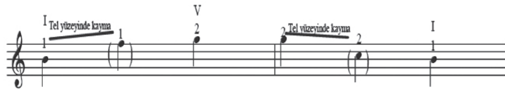
Şekil 3. Klasik geçiş

Konum geçme çeşitlerinin üçüncüsü, pesteki sesi seslendiren parmak ile çıkıcı, tizdeki sesi seslendiren parmak ile inici olarak gerçekleştirilir. Bu geçiş, pesteki sesin kaymayı gerçekleştirilmesi ve konumu tanımlayıcı klavuz sese ulaşmasının hemen ardından klavuz sestem daha tiz bir sese, yeni bir parmağın düşürülmesiyle gerçekleştirilir. Bunun inici uygulaması, hareketin tam tersi biçimde olmaktadır (Sassmannshaus, 2012c). Yani tizdeki sesin, inici konum geçişinde taşıyıcı görevini üstlenmesi ve bu parmağın ulaştığı, konumu tanımlayıcı klavuz sestem daha pes bir sese yeni bir parmağın düşürülmesidir (Sassmannshaus, 2012c), (Şekil 3). Bu geçiş klasik konum geçişi olarak da bilinmektedir (Thomsen, 2012; Chen, 2016, Fisher 1997, 157). Klasik geçişte kayma hareketi, eski sesi seslendiren yayın sonunda duyulmayacak kadar kısa olmak suretiyle, eski yayda hissedilir ve hedef ses yeni yay ile seslendirilir (Sassmannshaus, 2012d; Chen, 2016).