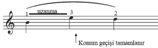
řekil 5. Geciktirmeli geiř (Galamin, 1962: 25)

Altıncı konum geme eřidi romantik geiřtir. Bu geiř hedeflenen sestem önce kayma hareketinin müzikal ihtiyalar sebebiyle duyurulması istendięi durumlarda kullanılır (Sassmannshaus, 2012c, Chen 2016, ). Bu geiř doęal bir glissando ile daha duygusal bir ifade řekli yaratmaktadır (Thomsen, 2012). Romantik geiřin ıkıcı uygulamasında, yeni parmağın dıřürülmesi eski konumda gerekleřtirilmektedir ve bu yeni parmağın eli, hedeflenen konuma tařıdığı görülmektedir. Romantik geiřin inici uygulamasında her zaman tizdeki parmak kayma ve kılavuz görevini üstlenir ve daha pes bir sese parmak dıřürülür (Sassmannshaus, 2012c, Chen 2016). İnici uygulamanın esasen inici klasik geiře dayandıęı görülmektedir (řekil 6). Burada önemli olan nokta kayma hareketinin müziğın gerektirdięi ölçüde duyurulmasıdır.