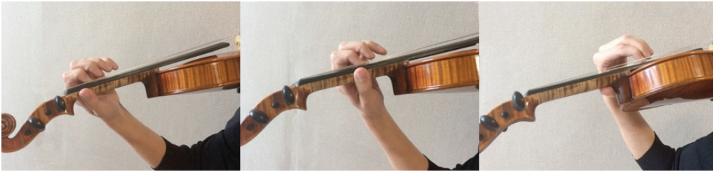
Görsel 1. Temel, alt ve üst konumlarda başparmak pozisyonut

Konum geçişlerinde başparmağın aldığı görev kritiktir. Sassmannshaus'a (2012a) göre başparmak birinci konumdan dördüncü konuma kadar el ile birlikte hareket etmeli, daha yüksek konumlarda keman sapının bitiminde kalmalıdır (Görsel 1). Fisher'e (1997) göre ise, net hareket elin büyüklüğüne göre değişmekle beraber, I.-II. konumlardan daha üst konumlara geçişte başparmak, el ile bir bütün olarak, III. konumdan daha üst konumlara geçişte ise biraz daha önce hareket etmelidir. Bunun yanı sıra III., IV. ve V. konumlardan birinci konuma inici harekette başparmak, elden önce geçişi gerçekleştirmelidir. Ayrıca VI. ve daha yüksek konumlardan I. konuma inişte başparmak, el ve kol bir bütün olarak hareket etmelidir. Bununla beraber yüksek konumlardan III. konuma iniş esnasında başparmak yerini korumalı, daha sonra yeni konumdaki pozisyonuna yerleşmelidir. Diğer taraftan Thomsen'a (2012) göre başparmak, çıkıcı konum geçişinde geride kalmamalı; beşinci konum civarından alt konumlara inerken parmakların biraz gerisine hareket etmelidir.