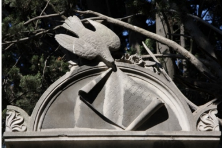
Görsel 9. Şişli Rum Mezarlığı, Nikolopoulos aile mezarı, güvercin kabartması

Güvercinin betimlendiği bir diğer mezar anıtı da Feriköy Latin Katolik Mezarlığı'ndaki 1876 tarihli Adalea Sassiae Longobardae aile mezarıdır (Görsel 1). Burada güvercin ağzında çelenk tutarken betimlenirken ouroboros biçiminde madalyon içindedir. Kabartmada güvercin figürü Tanrı'nın ve yeni yaşamın habercisi olarak tasvir edilirken, ouroboros madalyonla bu anlamı pekiştirilmiştir.