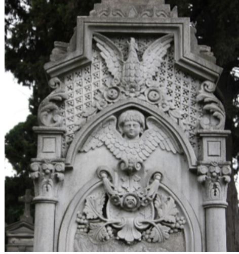
Görsel 14 . Şişli Ermeni Mezarlığı, Nerses Sırpazan mezarındaki kartal heykeli Görsel 15. Balıklı Rum Mezarlığı, Sunpudoğlu aile mezarı, kartal kabartması