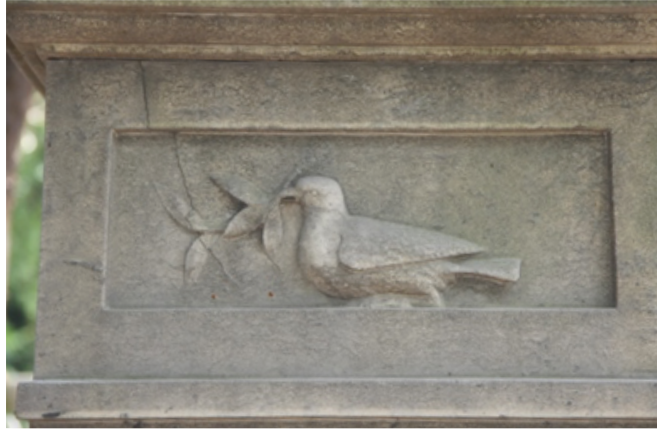
Görsel 7. Şişli Rum Mezarlığı, Anesti Simeon Taşçıoğlu anıtı, güvercin kabartması Görsel 8. Feriköy Latin Katolik Mezarlığı, Thalasso ailesi anıtı, güvercin kabartması

Feriköy Latin Katolik Mezarlığı'nda 1865 yılına tarihlenen Thalasso ailesi anıt mezarında tufan sonrası başlayacak yeni hayat sembolize edilmiştir (Görsel 8). Eski Ahit'te Nuh tufanının anlatıldığı bölümde Nuh tarafından gönderilen beyaz güvercin ağzında zeytin dalı ile gelmiş ve bu sayede suların geri çekildiği anlaşılmıştır (Tekvin 8/12). Bu hikâyede güvercin Tanrı'nın insanlarla barış yaptığını ve yeni başlayacak hayatı haber veren bir görev üstlenmiştir. Bu konunun betimlendiği mezar kabartmalarında Thalasso anıtında olduğu gibi ağzında zeytin dalıyla betimlenen güvercin yeni hayatı ve yeniden doğuşu sembolize etmektedir. Şişli Rum Mezarlığı'ndaki Nikolopulos aile mezarında diğerlerinden farklı olarak ağzında rulo (tomar biçimli kağıt) tutan güvercin betimlenmiştir (Görsel 9). 1890 tarihli anıtın alınlığı üzerinde öne doğru kafasını eğmiş biçimde güvercinin ağzındaki ruloda ölen kişinin bilgilerini içeren kitabesi yazılıdır. Bu anıtta da yeniden doğuşu sembolize eden güvercinin ayakları altında kalan bölüm çiçeklerle bezenerek gerçek dünyaya gönderme yapılmıştır.