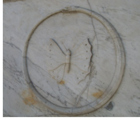
Görsel 1. Feriköy Latin Katolik Mezarlığı, Adalea Sassiae Longobardae aile mezarı, ouroboros ve güvercin kabartması Görsel 2. Şişli Rum Mezarlığı, Negrantontis aile mezarı, ouroboros ve kelebek kabartması