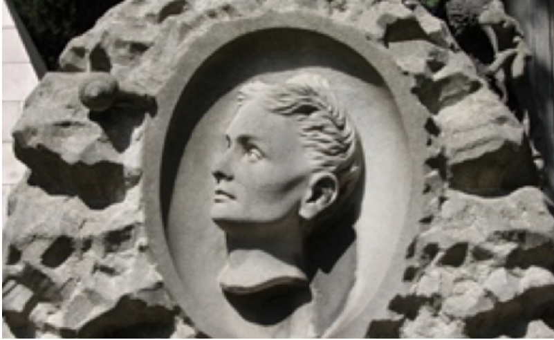
Görsel 10. Feriköy Latin Katolik Mezarlığı, T. Locothetti mezarı, salyangoz kabartması

Hıristiyan sembolizminde salyangoz Meryem'in lekesiz hamileliği, tembel ve günahkâr kişinin sembolü olarak bilinirken bu anlamı dışında ölüm, yeniden doğuş ve doğurganlığı da sembolize etmektedir (Ferguson, 1954, s.25). Salyangozun kıvrımlı ve spiral biçimli kabuğundan dolayı kadın rahmine benzetilmiş ve doğurganlığı temsil ettiği düşünülmüştür. Aztek kültüründe “gebe kalma, hamilelik ve doğumu” sembolize eden salyangoz, bahsi geçen anlamlar düşünüldüğünde aşk ve evliliği akla getiren bir motif olarak sanat tarihinde bu ikonografik anlamıyla oldukça az betimlenmiştir (Simons, 2015, s.309).