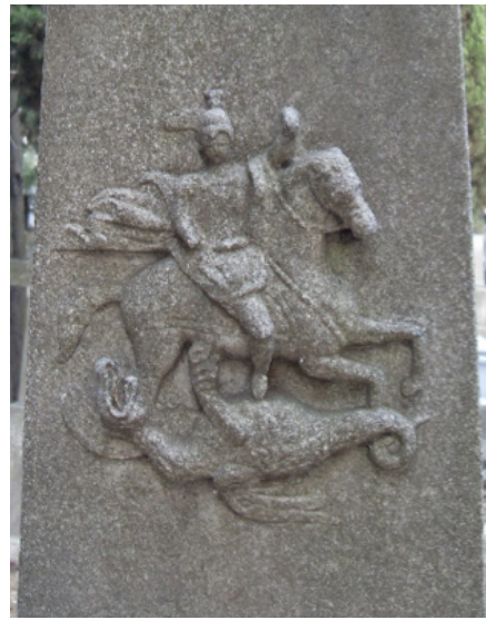
Görsel 18. Saint Esprit Katedrali kriptası, Sester ailesi anıtı, kuğu kabartmaları Görsel 19. Şişli Rum Mezarlığı, Aziz Georgios ve ejderha kabartması