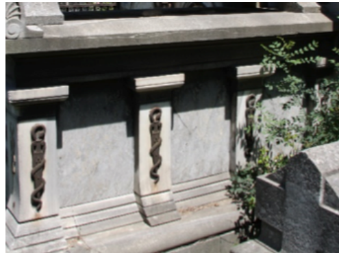
Görsel 5. Şişli Rum Mezarlığı, Doktor Aleksandros Kamburoğlu Mezarı, kadeh ve yılan kabartması