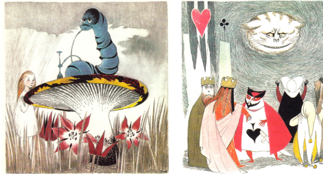
Görsel 3-4. Tove Jansson, Alice Harikalar Diyarında kitap illüstrasyonları, 1959

Sanatçı, Alice karakterini küçük bir kız olarak değil, ergenlikteki bir kız olarak illüstre etmiştir. Tenniel'in aksine karakteri düz saçlı sade beyaz bir elbise ile yorumlamıştır. Jansson'ın bu proje için mükemmel bir uyum sağlayacağını düşünen Yayıncı Ake Runnquist, proje tamamlandıktan sonra illüstrasyonları gördüğünde hemen heyecanla sanatçıya telgraf yollamıştır: "Alice için tebrik ederim, bir baş yapıt ürettin" (Popova, www.brainpickings.org).