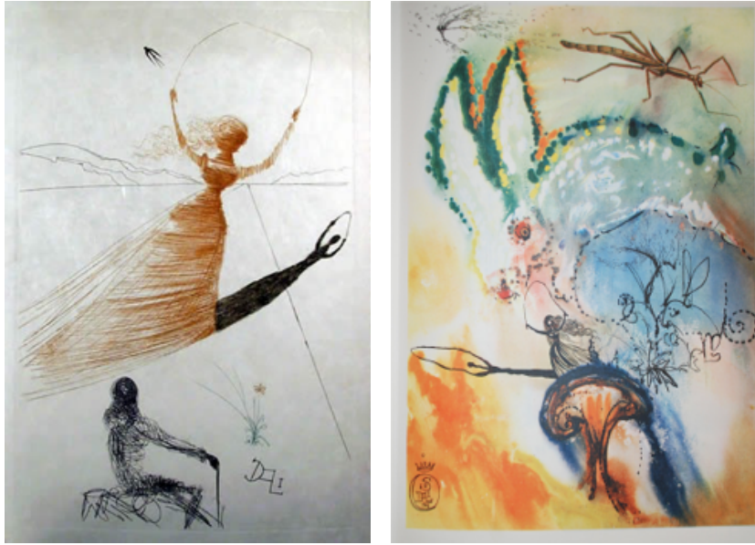
Görsel 5-6. Salvador Dali, Alice Harikalar Diyarında kitap illüstrasyonları, 1969

İngiliz Random House yayınevi, Carroll ile Dali'nin bir araya gelebilme potansiyelini görmüş ve sanatçıyı kitabı illüstre etmesi için ikna etmiştir. Dali, 1969 yılında kitap için guaj ve suluboya teknikleri ile 13 illüstrasyon çizmiştir (Leppanen-Guerra, 2011, s.160-163). Sanatçının illüstrasyonları oldukça canlı renklere, soyut yorumlamalara sahiptir. Bu yorumları, tavşan, kelebek ve kraliçe çizimlerinde görmemiz mümkündür (Brooker, 2004, s.78-79). Dali, tavşan deliğini gerçeküstü bir yorumla resimlemiştir. Meşhur eriyen saat görselini kitabın illüstrasyonlarında da kullanmış, çılgın çay partisinde evin en önemli öğesi olarak yorumlamıştır (Leppanen-Guerra, 2011, s.160-163).