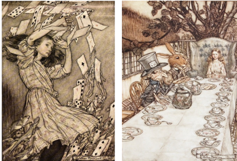
Görsel 1-2. Arthur Rackham, Alice Harikalar Diyarında kitap illüstrasyonu, 1907

Rackham'ın 1907 yılında "Alice Harikalar Diyarı" kitabını resimlediği dönemde etkin olan Art Nouveau etkilerini sanatçının çizimlerinde görmemiz mümkündür. Kıvrımlı romantik çizimleri adeta Art Nouveau'nun yansımasıdır. Bu dönemde batılı sanatçılar, ithal edilen Japon tekstil tasarımlarından ve tahta baskılardan (Ukiyo-e) büyük ölçüde etkilenmişler ve Ukiyo-e baskıların stilistik karakteristiklerini resimlerine yansıtılmışlardır. Japon tahta baskıların Avrupa'ya getirdiği en büyük yenilikler siyah kontürlü dış hatlar, düz parlak renkler ve gölgesiz figürler olmuştur. Rackham'ın illüstrasyonlarındaki yumuşak renkler, kıvrımlı çizgiler, uzun çizgisel figürler de Japon ağaç baskı etkileri gözlemlenmektedir (Lacy vd., 2013, s.46). Sanatçı, kitap için hazırladığı illüstrasyonları gravür tekniği ile oluşturmuş, 13 renkli ve 14 siyah beyaz illüstrasyon çizmiştir (Nichols, 2014, s.25). Ayrıca döneminin tarzını karakterlerin kıyafetlerine de yansıtmış, çılgın çay partisi karesinde Alice'in elbisesini, eşinin Çin deseni elbisesinin aynı olarak illüstre etmiştir (Hudson, 1974, s.76).