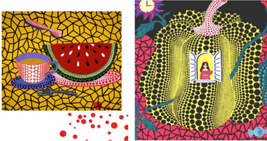
Görsel 9-10. Yayoi Kusama, Alice Harikalar Diyarında kitap illüstrasyonları, 2012

2012 yılında illüstrasyonlarını çizdiği, Penguin Classics tarafından yayınlanan “Alice Adventures in Wonderland” kitabı, tavşan deliğinden aşağı başlayan yolculuğu yine kendi çağdaş yorumuyla, beneklerle yorumlamıştır. Sanatçı, çalışmalarında fantezi ve kabusu, hayal gücünü ve deliliği, basitliği ve korkuyu karıştırmıştır. Carroll’un klasik mesajını daha önce hiç görmediğimiz bir tarzda, renkler, şekiller ve lekeler kullanarak yeni bir tarzda resmetmiştir. Kitabın bazı sayfalarında illüstrasyon ile tipografiyi birlikte ele almış, farklı boyutlardaki tipografik düzenlemeler ile dikkat çekmek istediği metinlere vurgu yapmıştır. Kendisini modern dünyanın “Alice” i olarak tanımlayan Kusama’nın hayata dair bakış izlerini, yarattığı yaşı belli olmayan Alice karakteriyle görmemiz mümkündür (Caples, 2014, s.82).