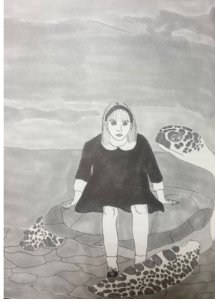
Görsel 13-14. Pelin Kırca, Alice Harikalar Diyarında kitap illüstrasyonları, 2015