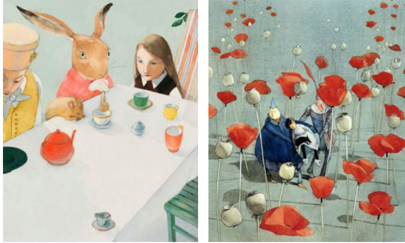
Görsel 7-8. Lisbeth Zwerger, Alice Harikalar Diyarında kitap illüstrasyonları, 1999

Zwerger, çocuk edebiyatına katkısından dolayı 1986 yılında Han Christian Andersen ödülünü almıştır. Sanatçının kitabı New York Times tarafından yılın en iyi resimli kitabı seçilmiştir. Uluslararası çocuk edebiyatının en başarılı çağdaş illüstratörlerinden biri olarak kabul edilmiştir. Alice in Wonderland, Wizard of Oz, Little Mermaid, Little Red Riding Hood, The Nutcracker, Swan Lake gibi birçok kitap için illüstrasyonlar çizmiştir (Zipes, 2015, s.668).