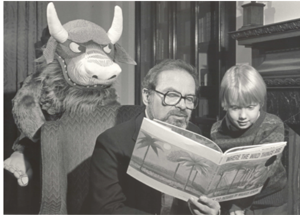
Görsel 3. Maurice Sendak, 'Sendak, kendi tasarladığı canavar maskotuyla bir okuma etkinliğinde'

Kitabımın kahramanı Max, annesine öfkesini kustuktan sonra, uykulu, aç ve kendisiyle barışık bir biçimde gerçek dünyaya geri dönebiliyor. Tabii ki hepimiz, çocukları, onlarda kaygıya neden olan ve duygusal anlayışlarını aşan acı verici deneyimlere karşı korumak istiyoruz. Bu normal. Ne var ki, asıl inkar ettiğimiz kaçınılmaz gerçek; bütün çocukların, yaşamlarının ilk yıllarından itibaren, kafalarını karıştıran duygularla, günlük yaşamlarının bir parçası olan kaygı ve korkuyla yüzleşmek, sürekli hissettikleri yoksunlukları ellerinden geldiğince iyi yönetmeye çalışmak zorunda olduklarıdır. Fantasia hala, çocuğun ilkel yönlerini eğitmek için sahip olduğu en iyi silahtır. Benim işime olası bütün tutkusunu ve gerçekliğini veren tam da; inanılmaz kırıl-ganlıklarına karşın tüm yabancı şeylerin hükümdarı olmak için savaşan çocukların kaçınılmaz gerçeklerine olan gönül bağımdır (Poslaniec, 2008: 67).