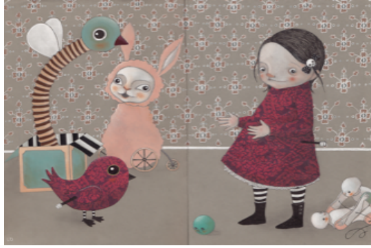
Görsel 7. Lauranne Quentric, 'Kumaş ve kağıtla hazırlanmış kolaj kitap sayfası'

Bu duruma bağlı olarak, neredeyse her gün, yaşamımızdan akan binlerce görüntünün pek çoğunda, artık; tümüyle 'illüstratöre ait bir tarz'da, farklı ve özgün olma iddiasıyla üretilmiş sayısız illüstratif görselle ilişki kuruyoruz.