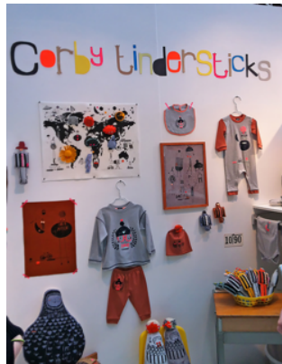
Görsel 8. Corby Tindersticks, 'Bubble London, January 2013 etkinliğinde yer alan stand'

Sanat ve tasarım başta olmak üzere, disiplinlerarası sınırların erimesi, var olan tanımların değişmesi, hatta yok olması, kendi üretim aşamasında sayısız alternatifle yüzleşen illüstratörü de durağanlıktan kurtarmış, yeni sürece bağlı olarak değişken bir konum kazandırmıştır.