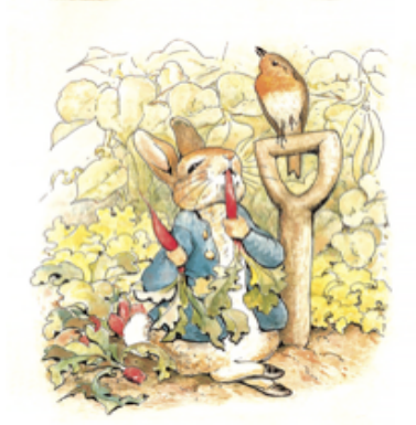
Görsel 1. Beatrix Potter, 'Tavşan Peter'in Maceraları'

cın yetmediği durumlarda sınırları zorlama' olarak yansımıştır. Bu eğilimin profesyonel çalışmalarındaki karşılığını; 'gerçeğinden gerçekçi, hatta ondan çok daha albenili, alabildiğine detaycı, teknik ustalık isteyen, zaman zaman olağanüstü sahne ve öğelere dönüşen' örneklerde çokça görürüz.