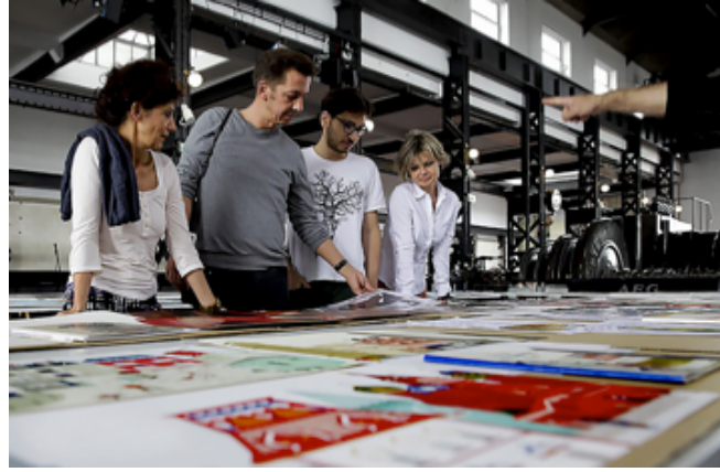
Görsel 10. Ilustrarte 2014, 'Uluslararası jüri sergi için seçim yapıyor'

son on yıldır yükselen akımlar, uygulamada kullanılan bazı teknikler 'orijinaliteyi'olumsuz etkilemekte, hatta ayırdedici özellikleri ortadan kaldırmaktadır. Bilinen, gelenekselleşmiş kimi illüstrasyon etkinliklerinde öne çıkan, sergilenmeye değer bulunan eserlerin ve son yıllarda yayınlanan kitapların pek çoğunda ise, belli tarzlara olan talebin artmasıyla; biçimlendirme ve kompozisyonda, renk paletinde benzerlikler, işlerin bütününde belli akımların etkisi görülmektedir.