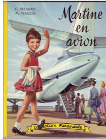
Görsel 2. Marcel Marlier, '1950'lerden itibaren popüler olan Ayşegül serisinin orijinallerinden'

Konumuz dışında kalan ve illüstrasyon tarihinin önemli yapıtlarını da içeren bu örneklerin, yalnızca teknik açıdan iyi olarak değerlendirilemeyecek kadar geniş ufuklar açtıkları yadsınmaz. Diğer yandan, çoğu 'çocuk/gençlik edebiyatı eserlerinin içeriğini görselleştirmek' ya da 'reklam elemanlarını renklendirmek' amacıyla kullanılan illüstrasyon örnekleri, biçimsel açıdan da olsa, geçirilen değişimlerden etkilenmişlerdir.