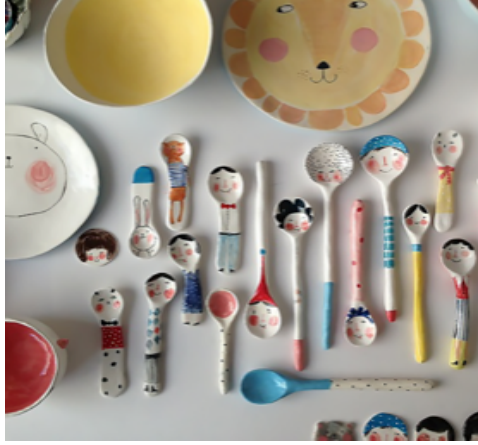
Görsel 5. Tamsin Ainslie, 'İllüstratif seramik tabak ve kaşık tasarımları'

Zira, Poslaniec'in defalarca belirttiği gibi, 'çocuk işi' olmaktan sıyrıldığından bu yana illüstrasyon; kitap görseli, reklam materyali v.b. olmaktan çıkmış, daha ziyade 'illüstratif çalışma' olarak adlandırılabilir bir üretim yaklaşımı ve 'disiplinlerarası' kimlik kazanmıştır.