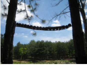
Resim 19. Christina Koch