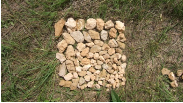
Resim 16. E. Behsat Beşir