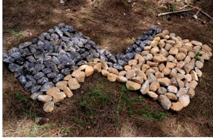
Resim 18. Cenk Umur, "SYZYG"Y

Öğrencilerin tercih ettiği doğal gereçlerden biri de farklı renk ve boyuttaki taşlar olmuştur. Taşların büyük - küçük (Resim 16), açık- koyu (Resim 18,37) etkilerinden yararlanılmıştır. Resim 17'de ( Ayşegül Aydın- Cenk Umur- Büşra Aydoğan) taşlar ve çam kozalaklarının koyu-açık karışıklığının kullanılmasıyla giderek uzaklaşan yıllankavi bir biçim verildiği görülmektedir. Bu biçim arayışında doğanın doğal döngüsüne bir gönderme de bulunma çabası sezilebilmektedir. Doğal gereçleri sanatsal bir anlatım aracına dönüştürebilmek için öğrencilerin çevresel sanata ilişkin edindikleri bilgilerden yararlanabildikleri gözlenmektedir.