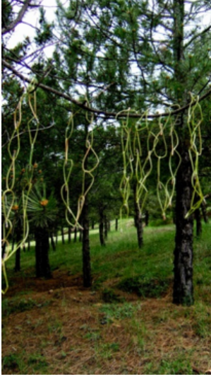
Resim 35. Seda Arık