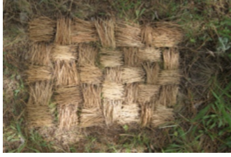
Resim 1. Alev Toros