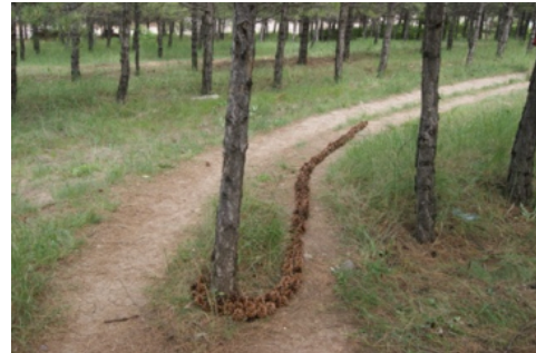
Resim 8. Aybıçe Akdoğan