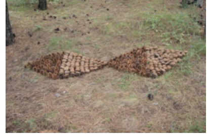
Resim 21. Günce Işınak

Çam kozalakları yerleşkede mevsim nedeniyle çokça bulunan ve en çok tercih edilen gereçlerden biri olmuştur. Bir birim olarak ele alınan kozalakların renk farklılıklarından (Resim 20) yararlanıldığı gibi, ters yüz olarak (Resim 2, 13, 21) kullanıldığında bıraktığı doku ve renk etkisini fark eden öğrenciler olmuştur.