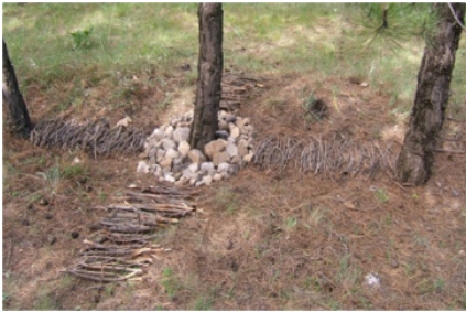
Resim 7. A. T. Muhammed Ameen

Resim 6, sonbahar mevsimi nedeniyle yerleşke içinde kış çiçeklerinin dikilmesi için yaz çiçeklerinin sökülerek atılmak üzere işçiler tarafından toplandığını gören bir öğrencinin bu çiçeklerle yaptığı iş görülmektedir. Öğrenci, yapay gölün kenarında bulunan ve kökleri fazla su aldığı için kurumuş olan çam ağaçlarının durumuna dikkat çekmek istemiştir. Öğrencinin bu tavrı hem çevreye duyarlı bakışın, hem de amaca uygun yer ve gereç seçiminin çevresel sanatın amacıyla örtüştüğünü göstermektedir.