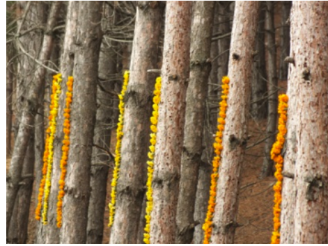
Resim 6'dan detay

Resim 6, sonbahar mevsimi nedeniyle yerleşke içinde kış çiçeklerinin dikilmesi için yaz çiçeklerinin sökülerek atılmak üzere işçiler tarafından toplandığını gören bir öğrencinin bu çiçeklerle yaptığı iş görülmektedir. Öğrenci, yapay gölün kenarında bulunan ve kökleri fazla su aldığı için kurumuş olan çam ağaçlarının durumuna dikkat çekmek istemiştir. Öğrencinin bu tavrı hem çevreye duyarlı bakışın, hem de amaca uygun yer ve gereç seçiminin çevresel sanatın amacıyla örtüştüğünü göstermektedir.