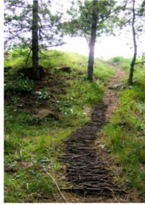
Resim 14. Barçın Köroğlu