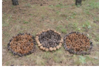
Resim 20. Aylin Gültekinoglu