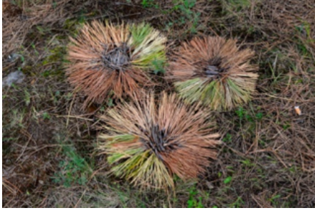
Resim 26. Günce Işmak