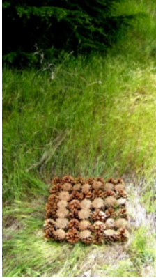
Resim 13. Alper Duyşak

Resim 14'de öğrenci kalınlı inceli kurumuş dalları bir ağacın düşen gölgesi ve patika ile ilişkilendirerek yol kavramına göndermede bulunmuştur.