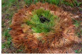
Resim 11. Buket Menekşe