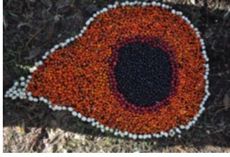
Resim 2. Aslı Cansız