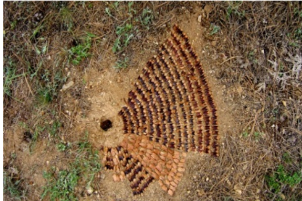
Resim 30. Recep Güleç

Doğal gereçlerle çalışmak amacıyla doğayı gözlemlemek, yalnızca estetik duyarlık kazandırması açısından değil, doğal güzelliklerin gizini keşfetme açısından da sanat eğitiminde etkisi olabilmektedir.