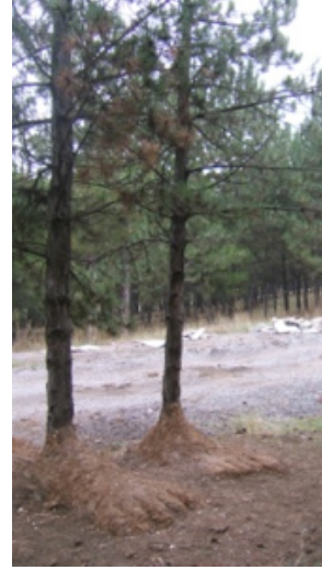
Resim 32. B. E. Aydoğan- C. Umur, “Kaçış”

Resim 32’de, iki öğrencinin ortaklaşa çalışarak gerçekleştirdikleri ve “Kaçış” adını verdikleri işleri görülmektedir. İnsanın doğaya yabancılaşması, çevreye duyarsızlığı ve verdiği zararları sorgulaması gerektiği konusundaki kaygılarını yansıtmaya çalışmışlardır. Öğrenciler mesajlarını yazılı ifadeleriyle de vermeyi denemişlerdir :