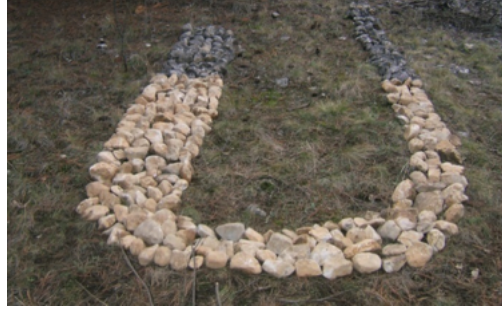
Resim 39. Büşra Aydoğan, "U Dönüşü"

Ortaya çıkan işlerin nasıl bir sergi adıyla tanımlanabilir arayışının sonucunda ise öğrencilerin önerileri alındı ve öneriler arasından yine öğrencilerin tercihi ile "U DÖNÜŞÜ" adına karar verildi. Serginin adının saptanmasında Psikoloji öğrencisi B. Aydoğan'ın yaptığı işi (Resim 39) ve işi üzerine yazdığı metin etkili olmuştur: