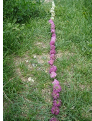
Resim 15. Christina Koch,

Resim 14'de, kırılarak aynı uzunlukta olmaları sağlanmış kurumuş ağaç dalları bir patika üzerine döşenmiş ve sanki gökyüzüne doğru uzanmakta olan bir yol izlenimiyle doğada yolculuk gibi bir anlam yaratılmaya çalışılmıştır.