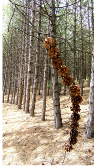
Resim 36. Christina Koch