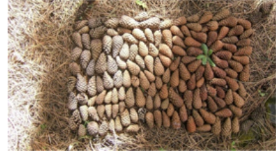
Resim 3. Buket Hakbilen

Dağınık halde bulunan çam yapraklarının, dikey ve yatay örgü dokusuyla (Resim 1) veya merkezden dışa doğru renk değişimleri göz önüne alınarak yerleştirilen (Resim 11, 26, 27) ve içinde bulunduğu doğal ortamda, doğal ışık altında düzenlenmiş görünümüyle plastik bir içerik kazandığı görülmektedir. Tek başına pek bir şey ifade etmeyen çam yaprakları, toprağa rastgele karışmış meyveler bir düzen içinde tekrar edildiğinde nasıl estetik bir biçime dönüştürülebildiği görülmektedir. Resim 4, 5, 6'daki işler ise buldukları mekanla da ilişkilendirilmişlerdir. Resim 3 ve 34'e ilişkin olarak öğrenci, sıradan bir bakışın ötesine geçerek nesnelerin ayrıntılarını, ayrıntıların nesneyle, çevresiyle ve kendisiyle olan ilişkilerini farkedişine yazılı anlatımında da yer vermiştir;