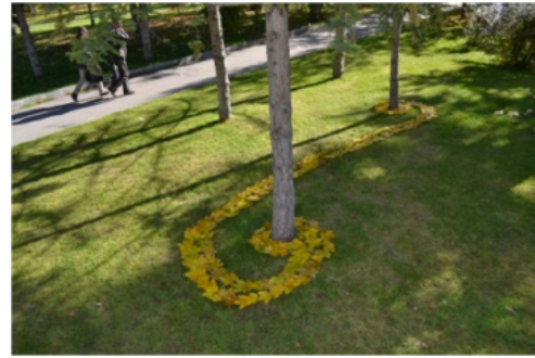
Resim 25. Ayşegül Aydın, "Rüzgar"

Yerleşkenin doğal yapısı ve bitki örtüsünün elverdiği ölçüde doğal gereçlerin seçiminde çiçek, yaprak, taş gibi birimlerle geniş mekanlar (Resim 6, 9, 17, 25) değerlendirildiği gibi küçük çaplı işlerde, gereçlerin ayrıntılarındaki ilişkilerin fark edildiği ve bu ilişkilerin kullanıldığı (Resim 12, 30, 34) etkili işler de ortaya çıkmıştır.