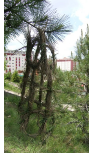
Resim 37. Özden Öz

Çevresel sanat uygulamaları sürecinde öğrencilerin görmeye odaklanabilmeleri için bakmak ve görmek arasındaki ayrıma sıklıkla dikkat çekilmiştir. Görsel algıyı ve estetik bakışı geliştirmede, doğal gereçlerle çalışmanın zengin seçenekler sunduğu ve bu seçeneklerin ise ancak dikkatin yoğunlaştırılmasıyla görünür olabileceği uyarıları yapılmıştır. Bu uyarıların öğrencilerin bireysel farklılıklarını açığa çıkarmada etkili olabildiği izlenmiştir. Zemin ve mekanı değerlendiren öğrencilerin yanı sıra bireysel algı ve ifade farklılıklarını özgürce ifade edebilmeleri açısından (Resim 19, 35, 36, 37) bazı öğrencilerin işlerini ağaç dallarına asarak düzenledikleri görülmüştür.