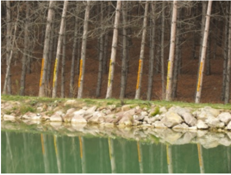
Resim 6. Cenk Umur