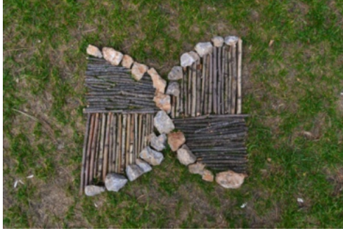
Resim 22. Deniz Biçer

Çam kozalakları yerleşkede mevsim nedeniyle çokça bulunan ve en çok tercih edilen gereçlerden biri olmuştur. Bir birim olarak ele alınan kozalakların renk farklılıklarından (Resim 20) yararlanıldığı gibi, ters yüz olarak (Resim 2, 13, 21) kullanıldığında bıraktığı doku ve renk etkisini fark eden öğrenciler olmuştur.