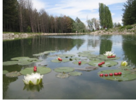
Resim 5. Christina Koch