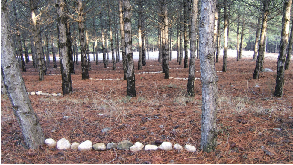
Resim 9. Cenk Umur

Sanat eğitiminde, yaratıcı güçlerin ortaya çıkarılabilmesi için doğanın sonsuz olanaklarından yararlanmak mümkündür. Öğrencilere doğanın bu olanaklarını kendi amaçlarına uygun olarak araştırmaları için zaman zaman doğal gereçlerin buldukları mekanla olan ilişkilerine dikkatleri çekilmiştir. Kurumuş ağaç dalları, taş, yaprak, çam kozalağını tercih eden öğrencilerin bazıları bu gereçleri düzenlerken geniş bir mekanı da işin içine katmayı başaramışlardır (Resim 7, 8, 9, 14, 17, 24, 25).