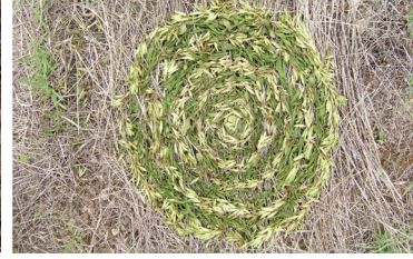
Resim 12. İzgi Biçer

Resim 14'de öğrenci kalınlı inceli kurumuş dalları bir ağacın düşen gölgesi ve patika ile ilişkilendirerek yol kavramına göndermede bulunmuştur.