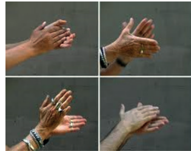
Resim5: Nevin Aladađ, "řehir Sesi III", Video