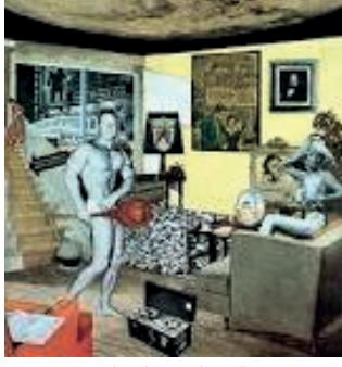
Resim13: Richard Hamilton, "Günümüz Evlerini Bu Denli Farklı, Çekici Kılan Tam Olarak Nedir?", Kolaj