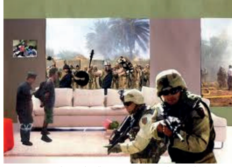
Resim14: Martha Rosler, "Savaşı Eve Taşımak: Güzelim Ev, Yeni Seri", Karışık Teknik