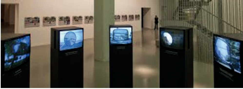
Resim6: Nevin Aladağ, “Şehir Sesi I”, Video Yerleştirme

2009 yılında Uluslararası İstanbul Bienali için ürettiği yapıtında kolaj benzeri bir yapı kullanan Aladağ, müzik aletleri, rüzgar, martı, su ve doğa çıkışı vb. sesleri kullanmıştır. “Şehir Sesi II”de (Resim 4), Dikiz aynasından yansıyan izleyici görüntüleri eşliğinde popüler şarkı seslerini, “Şehir Sesi III”de (Resim 5) ise, değişik yaşlardan insanların el çırpma seslerini kullanmıştır.