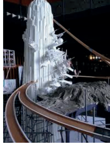
Resim1: Lee Bul, “Büyük Hikayem Ağla Taşlara”, Yerleştirme

“Büyük Hikayem Ağla Taşlara”, (Resim 1) konusunda bağımsız bir şekilde değerlendirildiğinde değişik açılardan izlenebilecek farklı malzemeler kullanılarak oluşturulmuş estetik bir heykel izlenimi vermektedir. Ele aldığımız yapıt “Kasıtlı olarak çelişkili ve ütopyacı projelerin baştan belli kullanılmaz hale geliş ve çürüyüşlerinin izleriyle yüzleştiği hayali bir alanı işgal ediyor” 2 . Ütopik projelerin baştan öngörülebilir eksiklikleri, yetersizlikleri ve daha sonra kullanılmayacak nitelikte olmalarından doğan çürümeleri yansıtmaları nedeniyle, yan yana getirilmelerinde -bu açıdan- sorun oluşturabilecek farklı malzemelerin bir arada kullanımı yöntem olarak doğru gözükmemektedir.