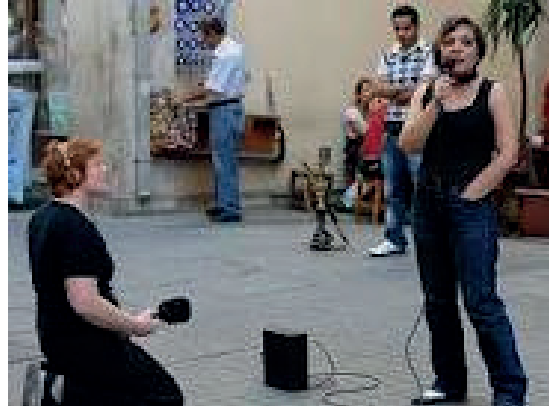
Resim7: Sharon Hayes, "Seni Sevdiğimi Bilmiyordum", Performans