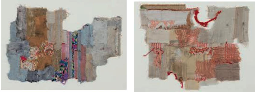
Resim12: Geta Bratescu, “Artıklar”, Karışık Teknik ve Kolaj

Kadına özgü malzemeler denildiğinde ilk akla gelebilecek şey “iğne ve iplikle neler yapılabilir?” sorusudur. Bratescu, sanatsal üretimini bu ön yargıyı sorun haline getirmek bir yana, sahiplenir bir yaklaşımla yapar. Bu nedenle olsa gerek “Bir yanda geometrik ve endüstriyel biçim, diğer yanda ise organik ve doğal biçimden oluşan ikilik belki de ilk o zaman zihnimde belirdi. Sonraki sanat çalışmalarımda bu olgu sürekli bir dürtü olarak varoldu.” 4 demiştir. Geta Bratescu'nun 12.Uluslararası İstanbul Bienali'nde sergilenen serisi (Resim:12) 1982 yılında yapılan ikinci seridir. Burada sanatçı yukarıdaki alıntıda belirtildiği gibi geometrik ve organik biçimlerin birbirleri ile olan karşıt ilişkisini kullanmıştır. Bu ilişki ile soyut bir resimde yakalanabilecek etkileri kumaşla elde etmeyi denemiştir.