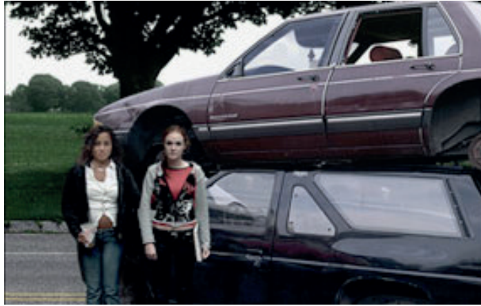
Resim2: Nancy Davenport, "Kampüs", 2004, c-print

Bu bağlamda, İMÇ'de genel olarak, Çin, Tijuana, Tayvan ve İstanbul gibi farklı coğrafi noktaların küresel ekonomi bazlı sorunlarını ve insan istismarlarını belgeleyici nitelikte yapıtlara yer verildiği görülür. Ancak bu çalışmalar izleyicinin o bölgelere bir anlık da olsa dikkatini çekmekten ve tepkilerinin doğruluğunu kanıtlamaktan öteye gitmez. Çalışmaların çoğunluğunda iyimserlikten uzak, durumu tespit etme ve kabullenme söz konusudur.