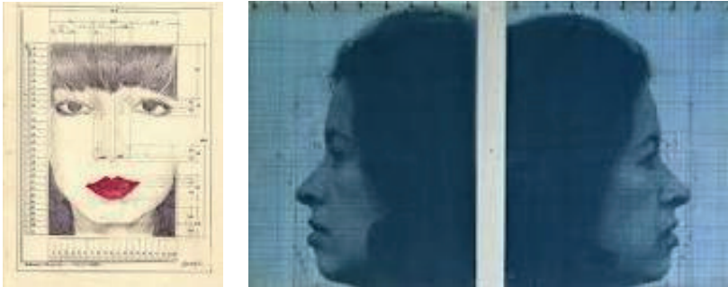
Resim11: Teresa Burga, “Otoportre”, Yerleştirme (Karışık Teknik)

Sonuç olarak bu yapıtta, sıradanlıktan uzak bir yaklaşımla, bir kadının kendisi ile ilgili verileri kullanarak kendine bakışı sergilenmiş olur.