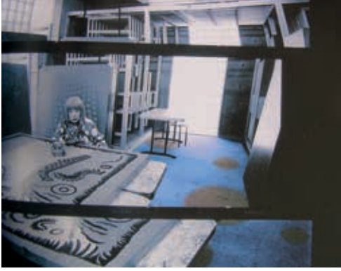
Resim8: Y. KUSAMA, "Atölye", 2011