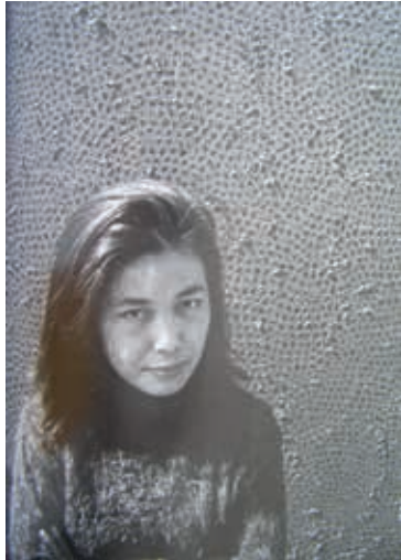
Resim1: Yayoi KUSAMA, New York, 1961

Çalıştığı her disiplinde önemli başarılarla imza atmıştır. “Reina Sofia”, “Pompidou”, “Tate”, “Whitney”, “Victoria”, “Miro”, “Gagosian”, “Moma” gibi önemli merkezlerde sergiler yapmıştır. Uluslararası sanat fuarlarına ve önemli bienallere katılmış, ünlü “Luois Vuitton” giyim mağazası ile tasarım sözleşmesi yapmıştır. Yaşı ilerledikçe sanatsal faaliyetleri artırmış ve çocukluk yıllarına göndermeler yaparak kendisiyle hesaplaşmıştır. Kendisini sıklıkla eleştirmiş, hayatının belli dönemlerinde her şeye öfke ile yaklaşmış, şüphe ile bakmış, kimseye güvenmemiş, dışarıdaki günlük hayatı korkunç bulmuş, sürekli yazarak, çizerek ve boyayarak huzur bulmaya çalışmıştır. Bu kaygılarını verimli bir sanatsal yaratıma dönüştürmüştür. Medya da onun bu verimli dönemleri ile ilgilenmiş, özellikle de New York’ta geçirdiği yılları üzerinde durmuştur. Çünkü bu dönemde yaptığı başarılı işlerle dikkatleri üzerine çekmeyi başarmıştır.