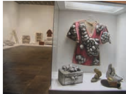
Resim7: Y. KUSAMA, “Düzenleme”, New-York,1960