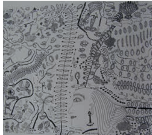
Resim13: Y. KUSAMA, Tuval Üzerine Serigrafi Baskı , 2004