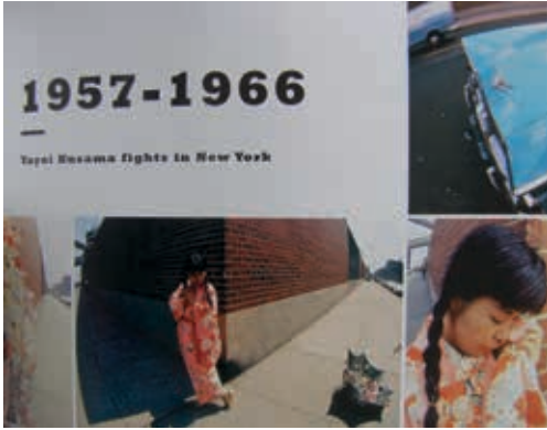
Resim10: Y. KUSAMA, Happening, New-York , 1966