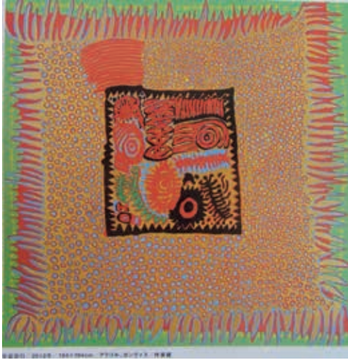
Resim14: “Evrene Yolculuk”, Akrilik,194x194cm, 2012

Sanatçının son dönem performansları turne şeklinde farklı kentlerde çoğu kez performatif, müzikal, fotoğrafik ve sinematografik biçimleri, dönemin ruhuna uygun bir biçimde yenilikçi, riskli teatral bazen de naif bir anlayışla devam etmektedir.