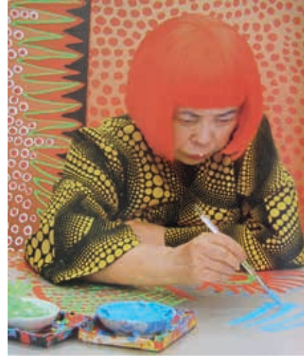
Resim15: Yayoi KUSAMA, Atölyesinde Çalışırken, 2012