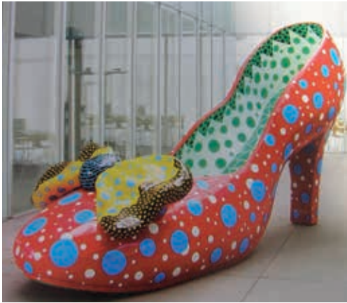
Resim12: Y. KUSAMA, "Kırmızı Ayakabı" , Mixed Media , 2002