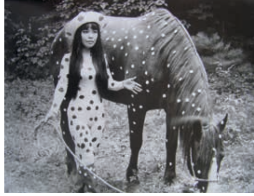
Resim4: Y. Kusama, Happening, 1967