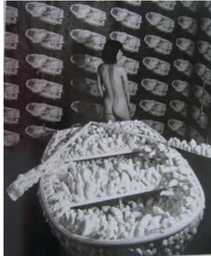
Resim2: Y. Kusama, Stands up to fear, New York, 1963