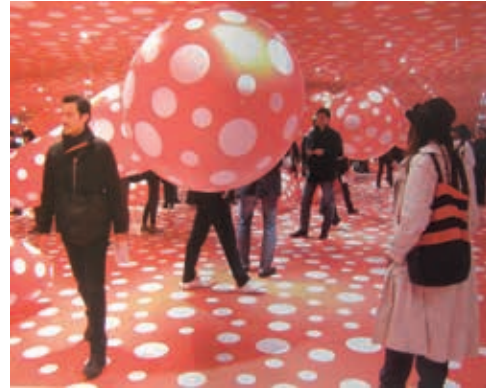
Resim11: Y. KUSAMA, Düzenleme, Paris-Ponpido , 2011