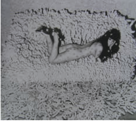
Resim3: Y. Kusama, foto-kolaj, 1966