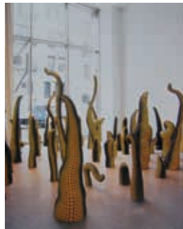
Resim6: Y. KUSAMA, “Yaşam”, Mixed Media, 1998