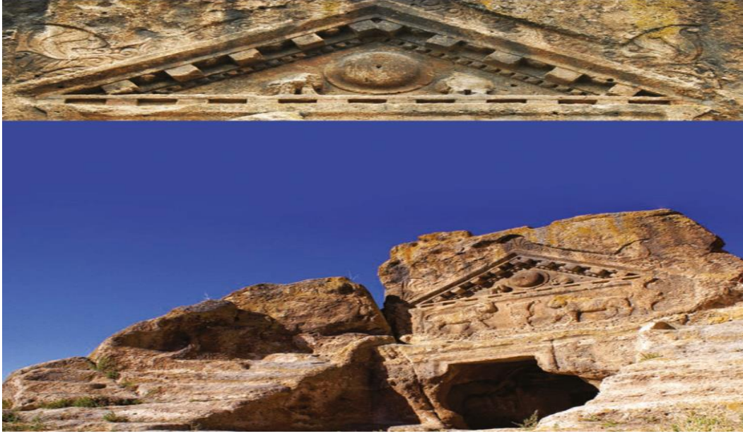
Görsel 3.6. Aslanlı Mabet , http://www.eskisehirkulturturizm.gov.tr/TR-157674/solonun-mezariaslanli-mabet.html , (Erişim Tarihi: 10.10.2018)