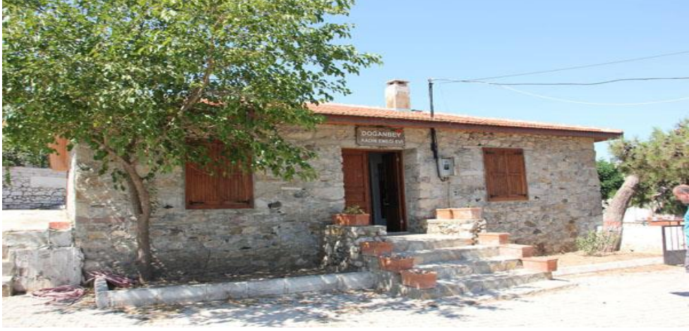
Görsel 2.12. Doğanbey Kadın Emeği Evi