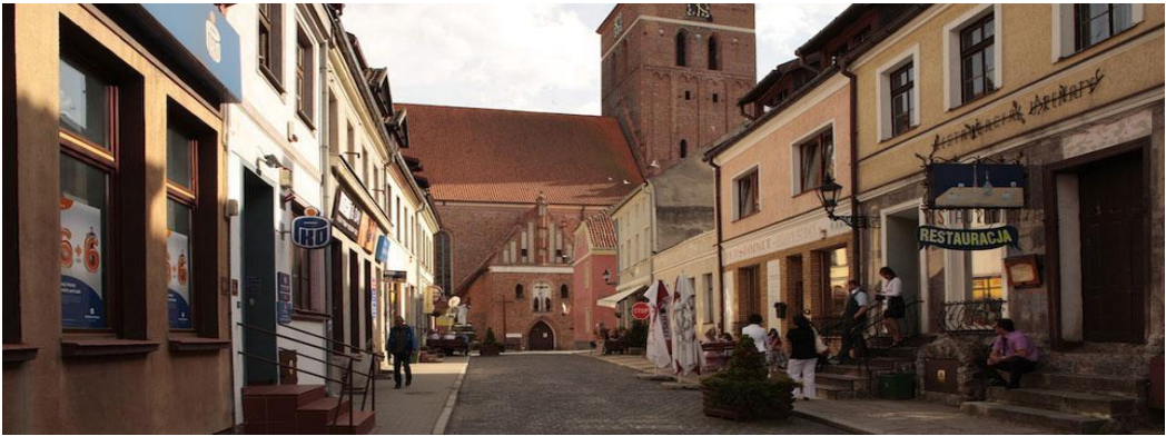
Görsel 2.4. Reszel tarihi sokaklarından bir görüntü( http://www.cittaslow.org/network/reszel , Erişim Tarihi: 25.09.2018)