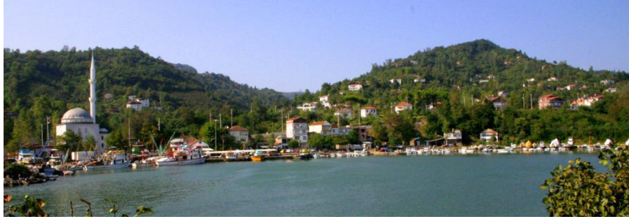
Görsel 2.13. Perşembe ilçesi, Ordu