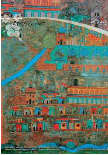
Görsel 3.1. Matrakçı Nasuh Efendi'nin 1533-1536 yıllarında Seyitgazi'nin genel görünümünü resmettiği minyatür ( https://www.kulturportali.gov.tr/.. ) (Erişim Tarihi: 10.10.2018)

Yine Evliya Çelebi ise Seyahatnamesi'nde Seyitgazi'ye yer vermiş, Seyyid Battal Gazi'nin ilçede gömülü olduğundan bahsetmiştir. 38 Tarihi dokusuyla, birçok medeniyete ev sahipliği yapmış, birçok uygarlıkların önemli merkezi olmuş olan Seyitgazi, kültür turizmine güçlü tarihi yapısı ve sahip olduğu zenginliklerle önemli ölçüde avantaj sağlamaktadır. İlçede taşınmaz kültür varlıkları olarak belirlenen önemli yapılar bulunmaktadır. Seyyid Battal Gazi Külliyesi, Midas Anıtı, Doğanlıkale, Bahşeyiş Anıtı, Aslanlı Mağbet, Asmainler Saklı Vadi, Gerdekkaya Mezar Anıtı, Sücattin-i Veli Türbe ve Külliyesi, Üryan Baba, Melikgazi Türbesi ve Zahran Vadisi bu değerli kültür varlıklarındandır. Bu önemli ve değerli tarihi dokuların hepsinin ayrı değerlere sahip olması yanında kalesi, kervansarayı gibi daha birçok tarihi yapılarıyla kültür ve inanç turizminin örneklerini vermektedir.