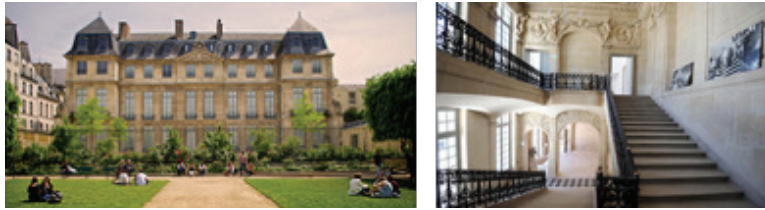
Görsel 4-5. Geçmiş 1600'lü yılların ortalarına dayanan Hotel Sale, 1985 yılından beri Kübizm akımının kurucusu Pablo Picasso müzesi olarak sanata hizmet etmektedir.

Günümüzde Picasso Müzesi olarak anılan Hotel Sale, yine farklı amaçlarla yapıldığı ve kullanıldığı halde müzeye dönüştürülerek sanatın hizmetine verilen önemli yapılardan biridir. Paris'te Marais bölgesinde yer alan yapı Barok mimarisinin en güzel örneklerinden biridir. Geçmiş 1600'lü yılların ortalarına kadar gitmektedir. Birçok kez el değiştiren bina 1671 yılında Venedik Elçiliği olarak kullanılmış, ardından önemli eserlerin ve kitapların depolandığı Edebi Ulusal Depo imi altında kullanılmaya başlanmıştır. 1797 yılında çeşitli kurumlara kiraya verilen Hotel Sale, 1829 yılında Merkez Sanat Okulu'na dönüştürülmüştür. Tarihin önemli isimlerinden Balzac da bu okulda eğitim almıştır. 1929 yılında tarihi anıtlar statüsüne dahil edilen yapı 1974-1979 yılları arasında restore edilmiş, 1979-1985 yılları arasında ise mimar Roland Simounet tarafından müzeye çevrilmiştir. Hotel Sale, 1985 yılından beri Kübizm akımının kurucusu Pablo Picasso'nun 5000'den fazla eserinin sergilendiği bir müze olarak kullanılmaktadır. (Görsel: 4-5)