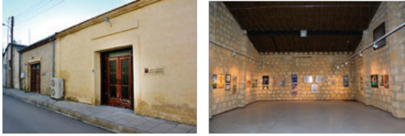
Görsel 25-26. İsmet Vehit Güney Sanat Merkezi'nin dış ve iç görünümü.

Başkent Lefkoşa'da geçmişten kalan, tarihi eser statüsü olmayan ama kültürel bir değer olarak sahip çıkılan bir yapıdır. Surlarla çevrili eski şehrin hemen dışında bulunmaktadır. İngiliz hakimiyetinin hüküm sürdüğü dönemde 1905-1951 yılları arasında hizmet veren demiryolu şirketinin ambarları olarak inşa edilmiştir. 1955'ten sonra yine devlete ait kurumların ambarları olarak kullanılan yapı, 1974 yılından sonra da kuzeydeki idari yapı tarafından benzer amaçlarla kullanılmıştır. 2009 yılında Kuzey Kıbrıs'ta ilk kez bir sanatçı hayatta iken adının verildiği bir sanat merkezi olarak Kültür Dairesi tarafından hizmete konulmuştur (Hastürk, Beyit, Bağışkan, 2018) (Görsel: 25-26).