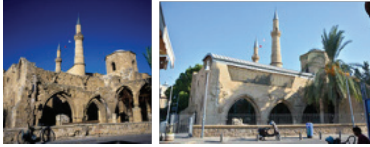
Görsel 19-20. Bedesten'in restore edilmeden ve edildikten sonraki görünümü.

Restorasyonu 2009 yılında Avrupa Birliği'nin mali katkıları ile UNDP-PFF tarafından bitirilen yapı, kültür-sanat amaçlı aktivitelerde kullanılmak üzere ülkeye yeniden kazandırılmıştır (Görsel: 19-20). Giriş kapısı bile 2x3 metre boyutlarında olan bu hibrit yapı 800 metrekare gibi geniş bir alana sahiptir ve tavan yüksekliği 10-12 metre civarındadır. Böylesi bir yapıda yer alacak çalışmaların bu alanı doldurması, yapının büyüklüğü altında ezilmemesi gerekmektedir. O nedenle sergilenecek çalışmaların hacimlerinin de büyük olması kaçınılmazdır. Yapının güneye bakan kısmında üç büyük kemer bulunmaktadır. Restorasyonda mekanın bu durumuna modern bir müdahalede bulunulmuş, kemerler arasındaki boşluklara duvar rolünü üstlenecek portatif kalın cam paneller yerleştirilmiştir. Böylelikle kemerler büyük birer pencere özelliğine sahip olmuştur.