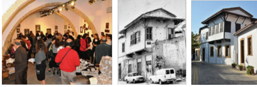
Görsel 14-15-16. Saçaklı Ev'deki sergi salonu ve Saçaklı Ev'in restore öncesi (1986) ile restore sonrası görünümü (2018).