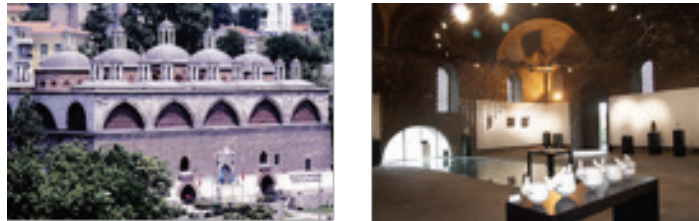
Görsel 8-9. Günümüzde Mimar Sinan Güzel Sanatlar Üniversitesi'ne bağlı kültür ve sanat merkezi olarak hizmet veren Tophane-i Amire binasının dış ve iç görünümü.

Avrupa'da olduğu gibi Türkiye'de de birçok mimari yapı yapılaş amaçları dışında dönüştürülerek sergi salonu olarak kullanılmaktadır. Bu yapılardan en önemlisi İstanbul'daki Tophane-i Amire binasıdır. 15. yüzyılda Bizans döneminde St. Claire ve Aya Photini kiliselerinin yer aldığı Metopon adlı bölgede kurulmuştur. Yapı, Sultan II. Mehmet tarafından fetihten sonra kurulmuş, burada Osmanlı ordusunun askeri topları üretilmiştir. Bina, 1850'lerden sonra Osmanlı İmparatorluğu'nda silah sanayisinin ve silah ticaretinin merkezi olmuş, 1900'lü yıllarda bir süre eğitim merkezi olarak kullanılmıştır. 1958 yılında Askeri Müze olarak kullanılması gündeme gelen ve 1992 yılına kadar çeşitli düzenlemeler geçiren Tophane-i Amire binası, bu tarihte Mimar Sinan Üniversitesi'ne devredilmiştir. Günümüzde Mimar Sinan Güzel Sanatlar Üniversitesi Tophane-i Amire Kültür ve Sanat Merkezi olarak hizmete açılan bu tarihi askeri binada Beş Kubbe, Tek Kubbe ve Sarnıçlar adı altında üç ayrı sergi holü bulunmakta ve bu mekanlarda yurtiçi ve yurtdışı sergiler düzenlenmektedir (Görsel: 8-9).