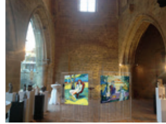
Görsel 27-28. Soldaki fotoğraf tavandan tabana şeffaf askı sistemlerinin mekanın özelliklerini saklamadan sergileme yapılmasına katkısını, sağdaki fotoğraf ise örgülü tellerden oluşturulabilecek taşınabilir sergi panosu simülasyonunu göstermektedir.

Turizm faaliyetleri ile tarihi ve kültürel miras birbiri için kaynak oluşturmaktadır (Ceylan, Somuncu, 2016, s.55). Bahse konu tarihi mekanlardaki sanat etkinliklerinin bir yıl önceden belirlenerek turizm tanıtım broşürlerinde yer verilmesi dış dünyanın ülkeye bakışını ciddi şekilde etkileyecek ve değiştirecektir. Günümüzde bu tür tarihi mekanlara eğlence sektörünün de ilgisi söz konusudur. Bu mekanların yalnızca kültür-sanat etkinliklerine ev sahipliği yapmaları eğlence sektörünün gerek yüksek volümlü ses kullanımıyla, gerekse yoğunluklu insan akışıyla yapıya vereceği zararların da önüne geçecektir.