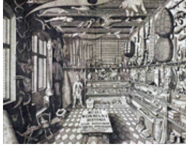
Görsel 1. 17'nci yüzyılda ortaya çıkan Merak Odaları'ndan (Cabinets of Curiosities) bir örnek.

Aydınlanma Dönemi ile birlikte sergileme olgusu müzelere kaymış, müzeler Merak Odaları'nın gizemine, bireyselliğine, kural ve akıldışılığına yöntemsel disiplinler kazandırmaya başlamıştır.