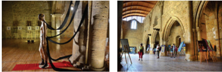
Görsel 21-22. Bedesten'de sergilenen eserlerin yapının büyüklüğü altında his olarak ezilmeleri gerekmektedir.

Bu durumundan ötürü gün ışığını doğrudan içine alan yapıda tek yönlü dominant bir aydınlanma söz konusudur. Yapının yarısı günün büyük bölümünde sert bir ışıkla karşı karşıya kalmaktadır. Sergileme açısından eserlerin ışığa dönük yerleştirilmesini zorunlu kılan bu koşullar, izleyicinin de bakış yönünü kısıtlamaktadır (Görsel: 21-22).