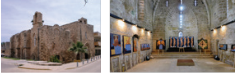
Görsel 10-11 İkoz Kiliseler'in dış ve iç görünüşü, 2017.

Yapının güney ve kuzey yönlerindeki duvarlarına eserleri yukarıdan aşağıya aydınlatacak küçük bir ışık sistemi döşenmiştir. Sergilemelerde gün ışığından yararlanılmamaktadır. Zamanla yer seviyesinin altında kalan yapının özel bir giriş bölümü bulunmamaktadır. 3.40 x 2.60 metre boyutlarındaki geniş ve yüksek giriş kapısı izleyiciyi doğrudan serginin ortasına bırakır şeklindedir. Duvarlara hiçbir şekilde herhangi bir nesne çakılmamakta ve asılmamaktadır. Küçük olan Hospatiler Kilisesi ise özel bir işletme tarafından bar olarak kullanılmaktadır.