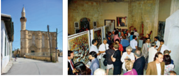
Görsel 12-13. Haydar Paşa Galerî'nin dış ve iç görüntüsü.

bölgesinde bulunan yapı 1990 yılında bakımdan geçirilerek sanat faaliyetleri için hizmete konulmuştur (Görsel:12-13).