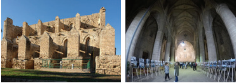
Görsel 23-24. Buğday Cami olarak anılan St. Peter ve St. Paul Kilisesi'nin dıştan ve içten görünümü..

Mağusa kenti surlar içi bölgesinde bulunan St. Peter ve St. Paul Kilisesi de 2009 yılında ibadethaneden kültür-sanat mekanına çevrilen bir yapıdır. Yapının geçmişi 1360 yılı dolaylarına kadar uzanmaktadır. Latin kilisesi olarak kullanılırken 1571 yılında Osmanlılar tarafından camiye dönüştürülmüş ve Sinan Paşa Cami olarak adlandırılmıştır. İngiliz sömürge idaresinin hüküm sürmeye başladığı 1878 yılından 1957 yılına kadar patates ve tahıl deposu olarak kullanılmış olan yapı bu nedenle halk arasında Buğday Cami olarak bilinmektedir. Yapı, Mağusa bölgesinde bulunan Gotik tarzındaki kiliseler içerisinde en büyük ve en iyi korunmuş olanıdır (Görsel:23-24).