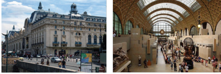
Görsel 2-3. Tren garından müzeye dönüştürülen Orsay Müzesi'nin dış ve iç görünüşü.

Paris'te 1898-1900 yılları arasında tren garı olarak inşa edilmiş olan yapı 1983-1986 yılları arasında Pierre Colboc, Renaud Bardou, Jean Paul Philippon ve Gae Aulenti isimli Fransız ve İtalyan mimarlar tarafından müzeye dönüştürülmüştür. Orsay Müzesi'nin uzunluğu 175, genişliği 75 metredir. (Görsel: 2-3)