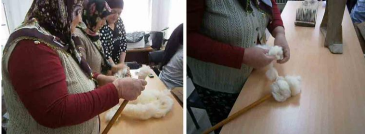
Fot. 4. Çorap örmeye yünlerin kolçak yapımı

Tarama işleminden sonra yünler oklava şeklindeki araca sarılarak ve bükülerek “kolçak” yapılmaktadır (Fot. 4). Kolçak kol altına yerleştirilerek kirman ya da iğ ile yünler eğrilmektedir (Fot. 5). Yünler eğrildikten sonra yumak haline getirilmekte ve örme işlemine başlanmaktadır.