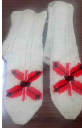
Örnek No : 6 Desen Adı: Kelebek Kullanılan Renkler: Doğal krem rengi, kırmızı, bordo