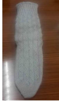
Örnek No : 8 Desen Adı: Model ismi tam bilinmiyor Kullanılan Renkler: Açık mavi

Araştırmada elde edilen çorap örnekleri incelendiğinde daha çok boyasız doğal yünden örüldüğü, örülme sırasında boyanmış liflerle desenlerin oluşturulduğu görülmektedir. Çoraplarda en çok kullanılan renkler kırmızı, yeşil, siyah, bordo ve mavi renklerdir. Uygulanan desenler isimlerini doğadan esinlenilerek bitki ve hayvanlardan almaktadır. Bu desen isimlerine koç boynuzu, sinek kanadı, karanfil, küpeli, söğüt yaprağı ve kelebek örnek verilebilir. Ayrıca araştırma örneğine katılan kadınlar yün çorabın özellikleri konusunda sıcak tuttuğunu, yünün ter emme özelliğinden dolayı koku yapmadığını ve çok sağlıklı olduğunu belirtmişlerdir.