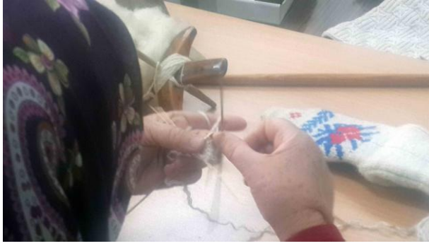
Fot. 6: Çorap örme

Örnekleme yer alan kadınlardan bir diğeri ise çorap örmeyi şöyle anlatmıştır. “Dokuz sayıdan başlıyor çorabın ucunu. Topuğu ayrı örülüyor. Burundan başlanıyor topuğa kadar geliyor. (Çorabın boğazında ters örgü yer almakta) (Çorabın arkasında yer alan ters örgü) model hocam oraya ters (örgü) koyuyorlar açılıyor. Çorap daha rahat ayağa girip çıkıyor. ...likralı kumaş değil bunlar malum örgü olduğu için daha rahat girsin çıksın ayağa. ...boyun kısmına ip takılıyor (düşmesin diye)”.