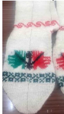
Örnek No : 4

Kullanılan Renkler: Doğal krem rengi, kırmızı, mavi, pembe, saks mavisi ve koyu yeşil