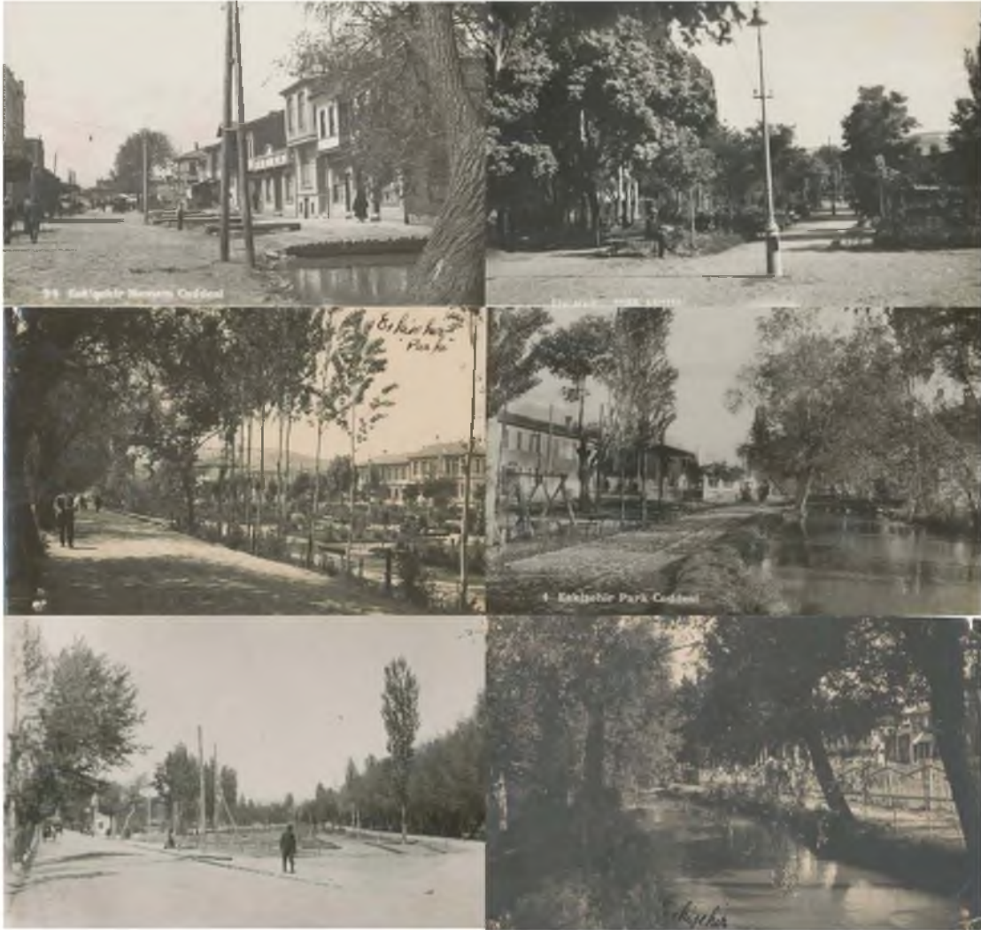
Şekil 7. 1930'li yıllara ait alan ve çevresine ait fotoğraflar [19].