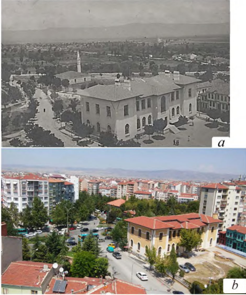
Şekil 3. a) 1920’li yıllara ait alan ve çevresine ait fotoğraf [19], ve b) 2000’li yıllar alan ve çevresi [20].

Şekil 3’de 1920’li yılların sonlarında çekilen fotoğrafta sağ önde Turan Numune Mektebi görülmektedir. Alaaddin Camii’sinin avlusunda yer alan mezarlık ileriki yıllarda kaldırılacak ve bu alan park olarak kullanılacaktır. Kentin ilk yeşil alanlarından olan ve günümüzde kentlinin dinlenme, buluşma mekanı olarak işlev gören park yeşil alan olma özelliğini korumaktadır. Kentin merkezinde yer alan yeşil alan, kentte bir nirengi noktası olma özelliğine sahiptir.