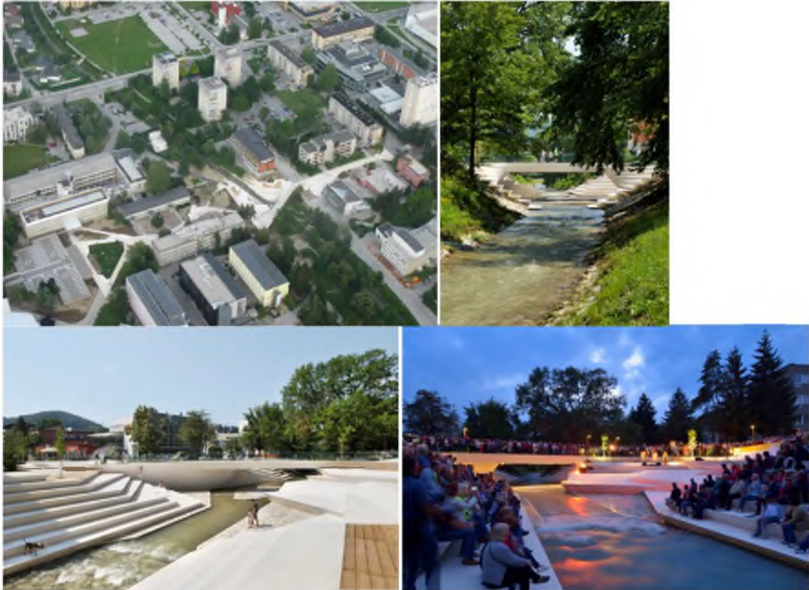
Şekil 18. Slovenia Velenje’de kentin ana aksında çok programlı bir düzenleme [39]

Slovenia Velenje’de, kentin ana akslarından biri üzerinde suyun doğal akışına müdahale etmeden kamusal, çok programlı bir düzenleme yapılmıştır. 2014 yılında Enota tarafından yapılan bu düzenleme de modern kentin gerekliliklerinin doğal su elemanına nasıl dahil olabileceğine iyi bir örnektir [39].