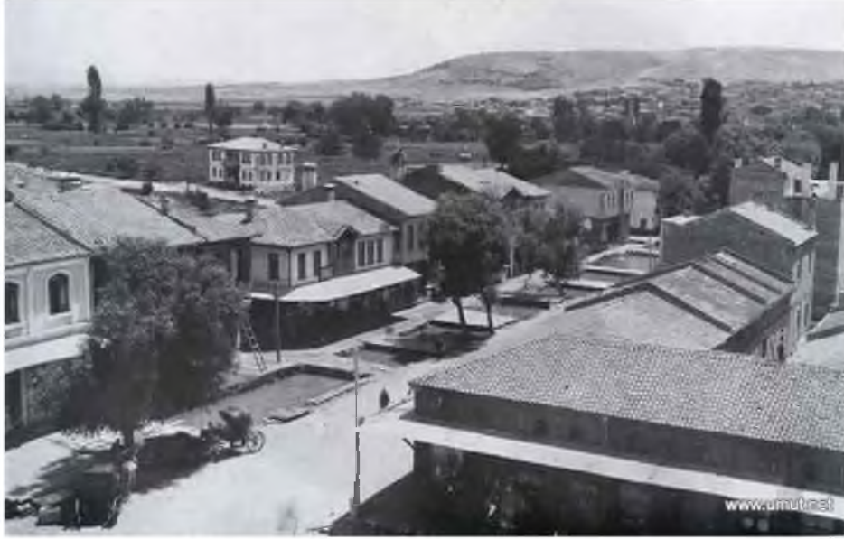
Şekil 8. Eskişehir Hamamyolu Bölgesi (1940) [27].

1950 yılından itibaren ülkenin kalkınma hamleleri kentte, Odunpazarı'nda oturan zengin yerli halkın kentin ticaret merkezi alanlarına ve yakın çevresine yerleşme eğilimi kent içi alanlardaki yerleşme yoğunluğunu artırmıştır. Mevcut yerleşim alanlarındaki 1-2 katlı yapıların aynı parsellerde 3-4 katlı apartman ve ticarethanelere dönüşmesine yol açmıştır [26]. Bu durumu sonraki yıllarda, kent merkezinde inşa edilen aile apartmanları izlemiştir. 1950-60 yılları arasında kente Balkan ülkelerinden çok sayıda göçmenin gelmesi ve yine bu dönemde yaşanan sel felaketi nedenleriyle çok sayıda işçi ve memur kooperatifi konutlarının yapılmasının kentin mekânsal büyümesinde önemli rol almıştır [23].