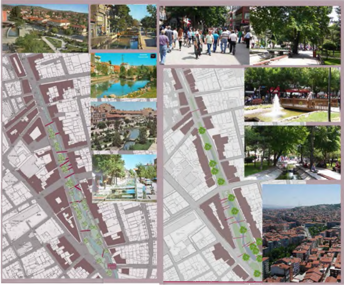
Şekil 15. 1973-2006 yılı halihazır haritası karşılaştırmalı durum tespiti (konut, park, geçiş) [18, 28, 20-35].

Hamamyolu Aksı'nın 1973-2006 yılı halihazır haritaları üzerinden karşılaştırmalı analizi yapıldığında;