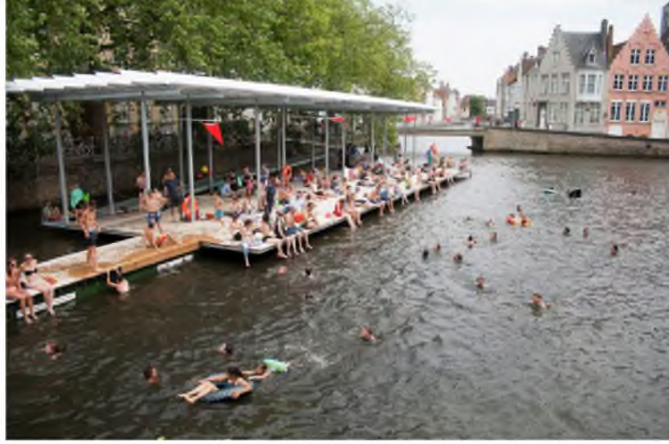
Şekil 17. Belçika Bruges’da deck tasarımı, kıyı-su ilişkisi [38]

İçinden su geçen kentlerin bir ayrıcalığı vardır. Kamusal mekanlarda su ile kurulan ilişkinin gücü, kamusal mekanların yaşamın da o kentte güçlü olmasını beraberinde getirmektedir. Belçika Bruges’da (2015) su üzerinde tasarlanan deck’in kamusal yaşama katkısı görülmektedir. Deck tasarımı ile suyla ilişki kurulan yüzey miktarı arttırılmıştır [38].