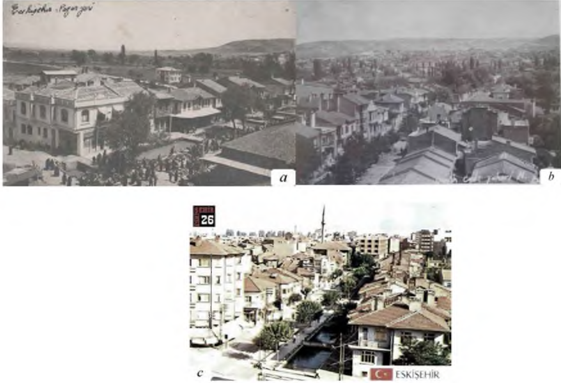
Şekil 11. a) 1930 yılı, b) 1940 yılı, ve c) 1970 yılı Hamamyolu Caddesi'nde Akar Deresi (Kıyı) Konut-Ticaret Yoğunluğu [19, 28].

1930'lı yıllara kadar Akar Deresi açıktan akmaktadır. Vişnelik Mahallesi tarafından, Akarbaşı Mahallesi'ne oradan Hamamyolu'na akan dere, bölgenin can damarıdır. 1970'li yıllarda bir kısmının üstü kapatılarak uzun bir süre Hamamyolu Caddesi'nden sıcak suların kenarından akarak Porsuk Nehri'ne karışmaktadır [23]. Aks üz erinden geçen Akar Deresi'nin 1980'li yılların ortasında kirlilik yarattığı, bataklığa döndüğü ve sinek sorunu yarattığı gerekçesiyle tamamen üzeri kapatılır. Kent merkezinde kamusal (geçiş) alanı özelliği olan aks, zamansal çerçevede yoğun yaya kullanımının olduğu alandır.