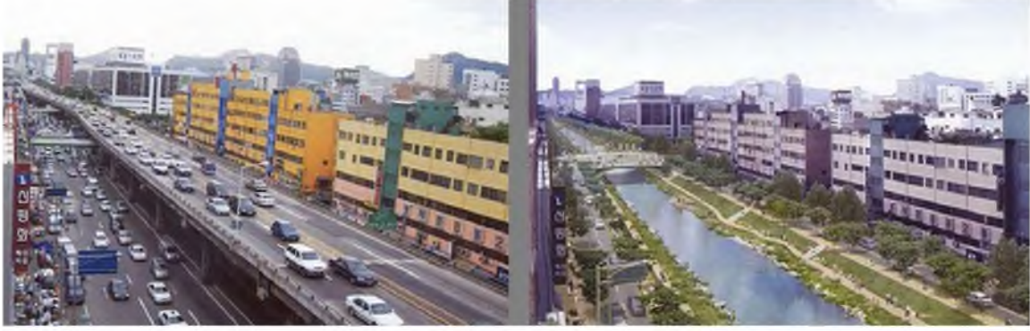
Şekil 19. Cheonggyecheon Nehri öncesi(2003)-sonrası(2005) [41]

Bir başka uygulamada ise; Hamamyolu Aksı ile benzerlikler görülmektedir. Güney Kore'nin başkenti Seoul'da yer alan Cheonggyecheon Nehri, Han nehrinin bir kolu olup, çevresinde yaşanan sağlık problemleri nedeniyle 1940'lı yıllarda üzeri kapatılarak çok şeritli otopan yoluna dönüşmüştür. 2000'li yılların başında devlet başkanı bu kentsel alanı restore etme işlemini başlatır ve iki yıllık bir süreçte günde yaklaşık 60000 kentlinin temas ettiği aks tasarlanır. Biyolojik çeşitlilik açısından farklılaşan alan aynı zamanda ekolojik olarak korunan yeşil aks olarak hizmet vermektedir [40].