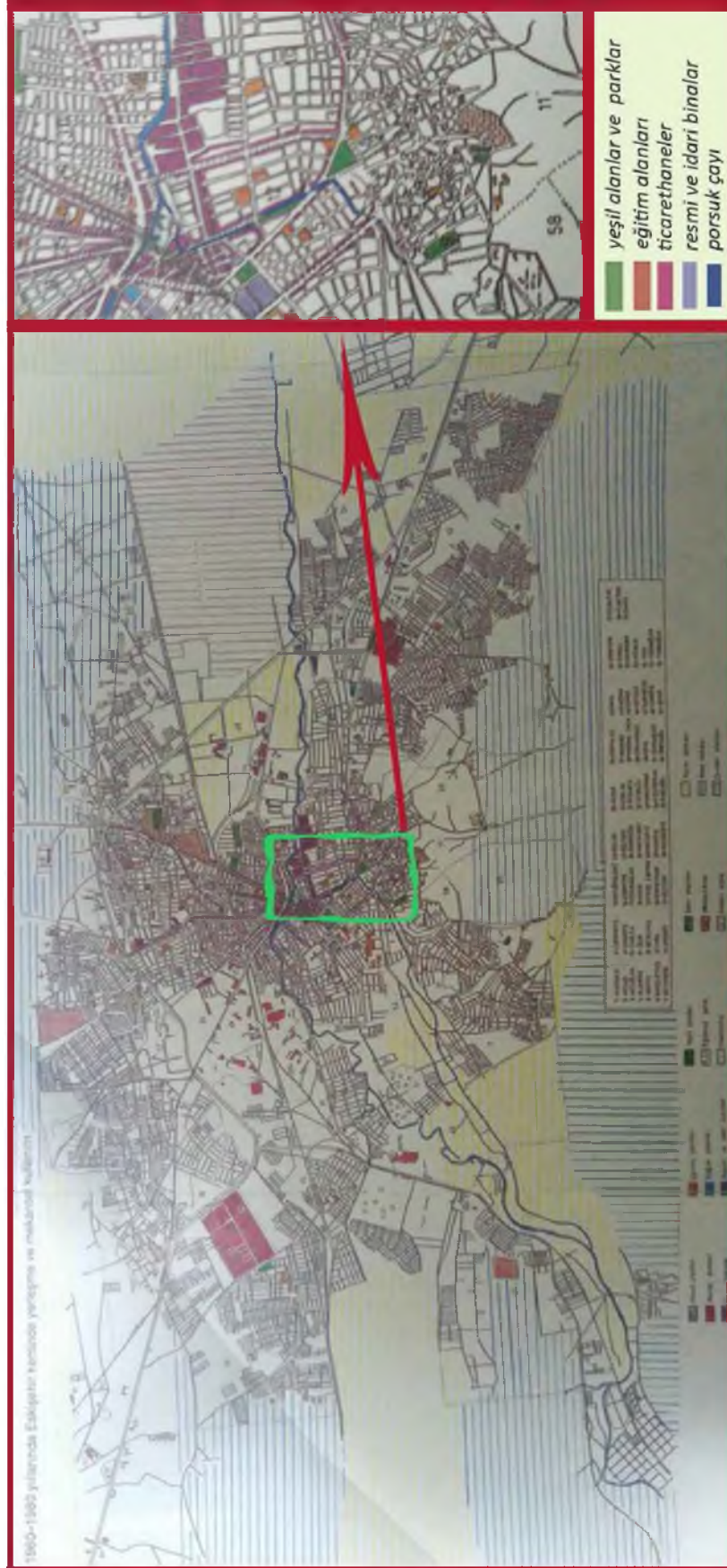
Şekil 10. 1960-1980 yıllarında Eskişehir kentinde yerleşme ve mekansal kullanım. Kaynak: Eskişehir Kentinde Yerleşmenin Evrimi, [12].