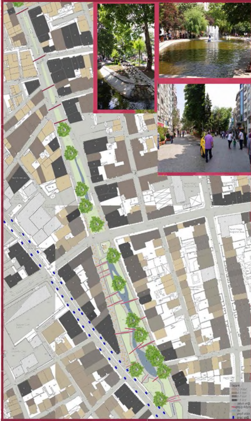
Şekil 14. 2006 yılı halihazır haritası durum tespiti (konut, park, yoğunluk, geçiş) [18, 20]