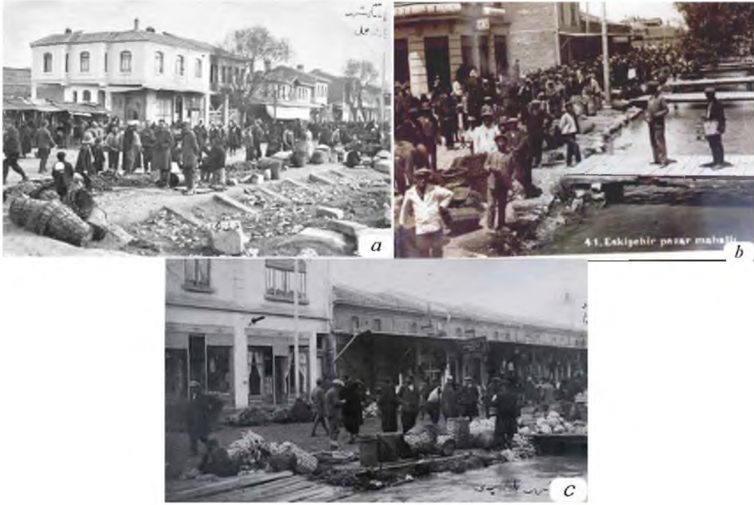
Şekil 12. a) 1920 yılı, b) 1930 yılı, c) 1940 yılı Hamayolu Caddesi'nde Akar Deresi (Kıy) Konut-Ticaret Yoğunluğu [21, 23, 27].