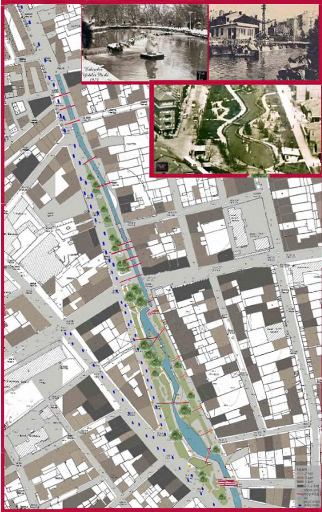
Şekil 13. 1973 yılı halihazır haritası durum tespiti (konut, park, yoğunluk, geçiş) [18, 30, 31]