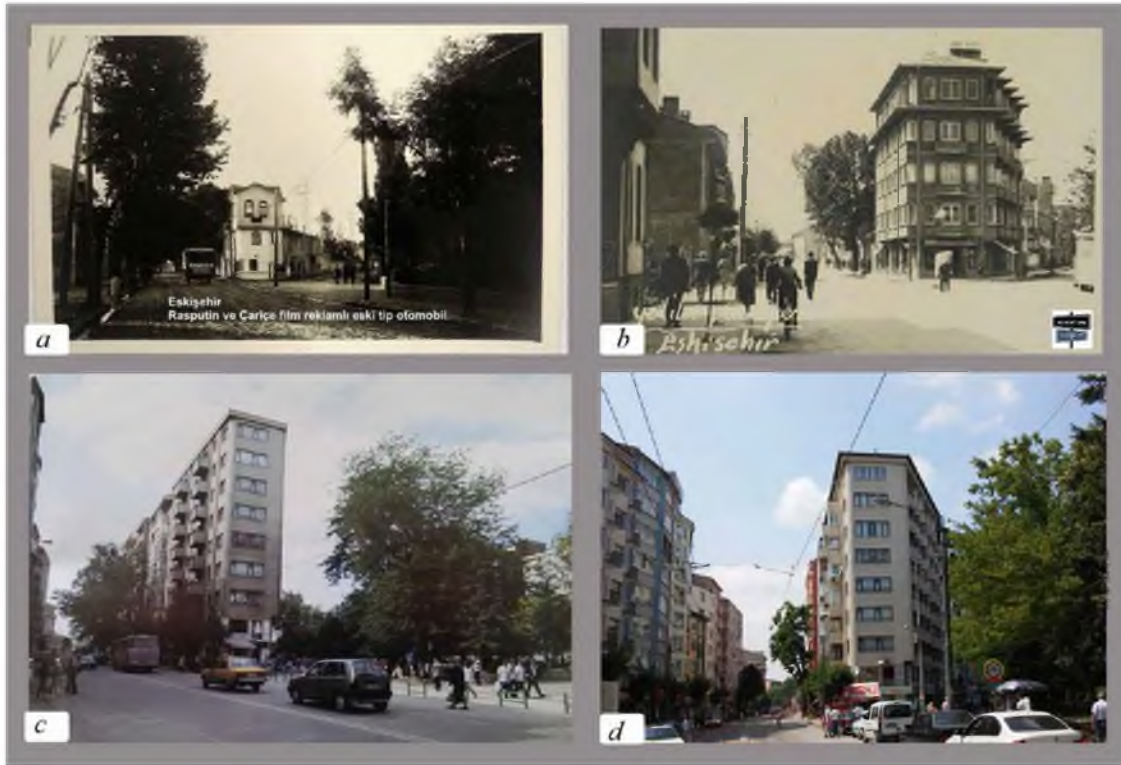
Şekil 16. Tarihsel süreçte Hamamyolu Caddesi girişi (a) 1960, b) 1970, c) 1990, ve d) 2000' li yıllar [20, 28, 36, 37].