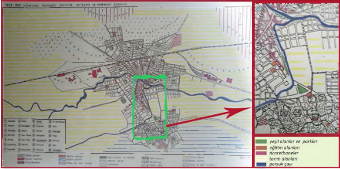
Şekil 6. 1923-1950 yıllarında Eskişehir kentinde yerleşme ve mekansal kullanım [12].