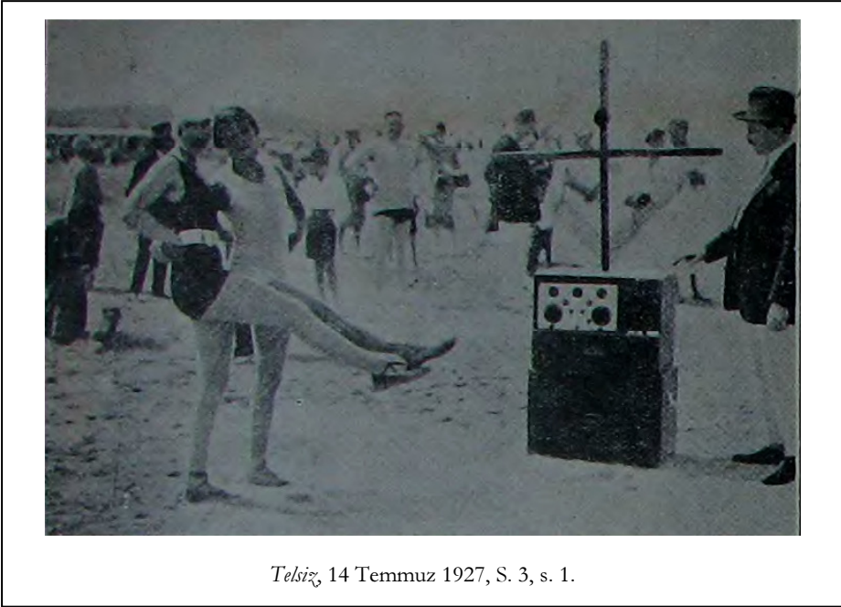
Telsiz , 14 Temmuz 1927, S. 3, s. 1.

hazırlanmadan önce yapılması gereken tıpkı sinemada olduğu gibi radyo tiyatrosunun da kendi sanatkârlarını yetiştirmesidir. 73