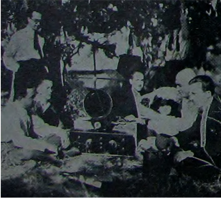
Telsiz, 28 Temmuz 1927, S. 5, s.1.