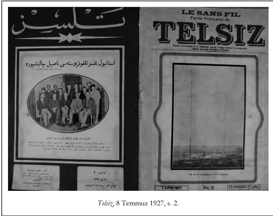
Telsiz, 8 Temmuz 1927, s. 2.

nın sonunda bulunan Fransızca anlatımdır. Fransızca metinler dergi ve radyo hakkında fikirlerini beyan edenlerin mektuplarından ve İstanbul radyosunun Fransızca program akışından oluşmaktadır.