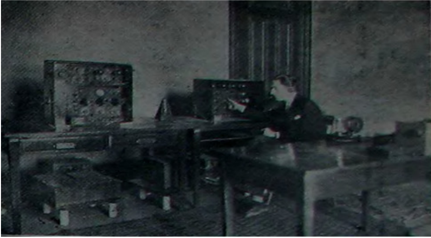
Telsiz , 8 Temmuz 1927, S. 2., s. 4.

Bu arada programların 45 gün önceden hazırlandığını da öğrenmekteyiz. Uzmanların denetiminden geçen bu programın yayınında sorunlar en aza indirilmeye çalışılır. En basitinden sanatçılardan herhangi birisi hastalanacak olursa hemen onun yerini doldurabilmek için önlem alınır. 85