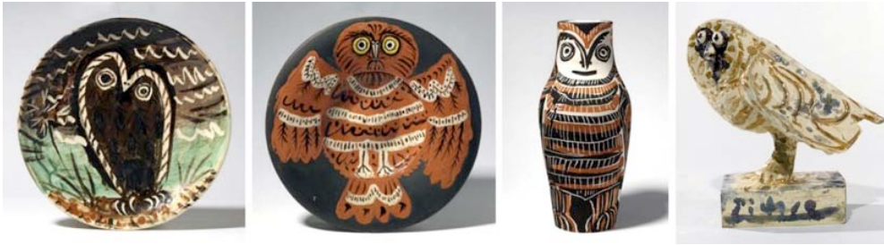
Resim 20. a) Baykuş desenli tabak, Vallauris, 1947-1948, Beyaz earthenware bünye, tornada şekillendirilmiş, kazıma yapılarak oksitler ve astarlarla dekorlanmış, saydam sırlı pişirilmiştir. 37 x 37 x 4.8 cm. b) Baykuş desenli tabak, 1957, Kırmızı earthenware bünye, tornada şekillendirilmiş, kazıma yapılarak oksitler ve astarlarla sigrafitto tekniği ile dekorlanmış, siyah patine uygulanarak, saydam sırlı pişirilmiştir. 43.8 x 43.8 x 6.3 cm. c) Baykuş desenli form, 1961, Beyaz earthenware bünye, tornada şekillendirilmiş, kazıma yapılarak, kırmızı ve siyah astarlarla dekorlanmıştır. 21.8 x 21.8 x 47 cm, Picasso Müzesi, Barselona, İspanya, d) Kızgın Baykuş, 1953, Sırlı earthenware bünye, 34.29 x 35.56 x 15.7 cm, Milwaukee Sanat Müzesi, ABD.