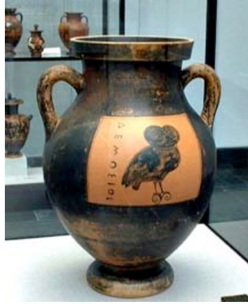
Resim 8. Antik Yunan Baykuşlu Form, Antikensammlungen Müzesi, Münih, Almanya.

Yunan kırmızı-siyah seramiklerinde “baykuş” figürü farklı formlar üzerinde uygulanmıştır “Anna A. Lemos (1991)”. Bazen bir vazo, bazen bir tabak, bazen de bir saklama kabı, hydria (Antik Yunanda kullanılan, biri dökmek için dik, ikisi kaldırmak için yatay, üç kulba sahip su testisi), kalpis (hydria’ya benzer fakat boynu hydriadan daha dar olan üç kulplu bir kap formu), lekythos (tek kulplu, dar boyunlu, kapalı bir tür Antik Yunan kap formudur, zaman içinde boyu uzamış ve gövdesi daralmış, sürahi, testi benzeri bir kullanımı/formu vardır) yada skyphos (ayaksız, iki kulplu, küçük, antik yunan seramik içki kupası) üzerinde baykuş figürü ile karşılaşılabilmektedir (Resim 8).