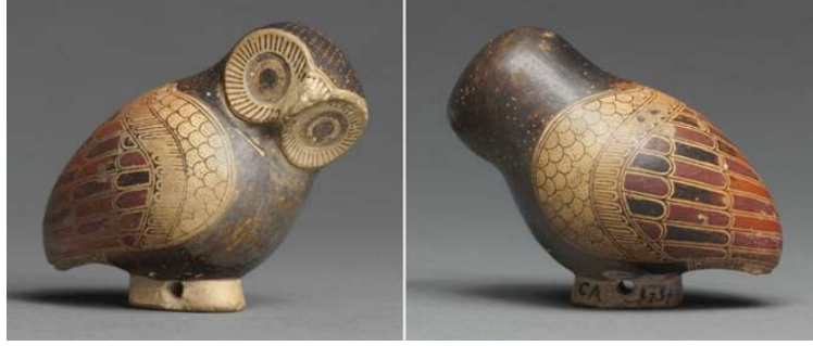
Resim 11. "Minyatür Baykuş", İkel Korint Dönem, Oryantalist Dönem, M.Ö. 725-600. Uzunluk 5 cm, siyah, beyaz ve pişmiş toprak renk, Louvre Müzesi.

Antik Roma Kuzey Afrika seramik sanatının nadir örneklerinden bir tanesi olan, olağanüstü bir şekilde tüylerin kazıma tekniği ile şekillendirildiği, oturmuş, yandan bakan, muhtemelen kozmetik veya diğer değerli merhemleri saklamak için üretilmiş minyatür pişmiş toprak kap örneği, M.S. 300'lere tarihlenmektedir (Resim 12).