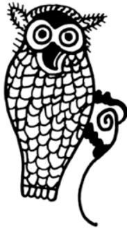
Resim 6. İon vazo üstü bezemelerinde kullanılan baykuş figürü. "Anna A. Lemos (1991)"

İon seramik sanatından bahsederken üzerinde durulması gereken en önemli merkezlerden biri Khios'dur. Khios yani bugünkü adıyla Sakız Adası, Ege Denizi'nde bulunan bir İon kentidir. Burada başlıca Yunan çömlek stillerinden 'vahşi boğa stilinde' (wild goat style), 'hayvanlı kadeh stilinde' (the animal chalice style) ve 'siyah figür stilinde' (the black figure style) geometrik bezemelerle süslenmiş, hayvan ve insan betimlemeli özgün seramik vazolar yapılmaktadır. Yunan vazo resim sanatının önemli stillerinden biri olan siyah figür tekniği ilk kez M.Ö. 7. ve 6. Yüzyılın ilk yarısında Akdeniz seramik pazarını ele geçiren Korintli ustalar tarafından uygulanmıştır. Büyük beğeni toplayan bu teknik kısa zamanda hızla yayılmıştır. Boğa, geyik, koç, aslan, at gibi hayvanların ve ata binen savaşçı, miğferli kahraman, asker gibi insan figürleri çizgisel bir anlatımla vazolar üzerine uygulanmaktadır. Bunların arasında kartal, horoz, tavuk, kaz, baykuş (Resim 6), güvercin gibi çok sayıda kuş betimlemeleri ve stilize edilmiş mitolojik uçar varlıkların sıklıkla kullanımı da dikkat çekmektedir "Deniz Onur Erman (2009)".