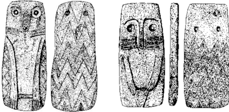
Resim 4. Kalkolitik Döneme ait olduğu düşünülen Tessalyan Sesklo kültürüne ait üzeri "Zik-Zak" ve "V" şeklinde kazınmış baykuş ana tanrıça betimlemeli figürinlerin önden ve arkadan görünümü.