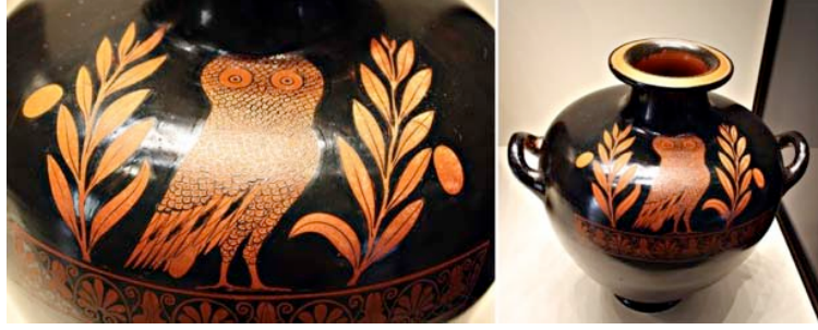
Resim 9. Attika kırmızı figürlü, yaklaşık 35 cm yüksekliğinde pişmiş toprak form, M.Ö. 480-470.

Yunanlı çömlekçiler, hydria'nın bir farklı türü olan kalpis'i, göz yaşlarını biriktirmek için üretmişlerdir. Taşıma ve boşaltmaya yardımcı olması için üç kulplu tasarlanmış bu hydria, Getty Villa, Malibu, California koleksiyonuna aittir (Resim 10).