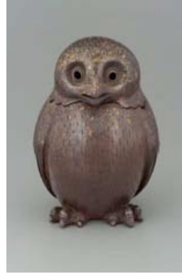
Resim 17. Tsushima seramiği baykuş.

Kaliforniya Bilim Akademisinin Antropoloji Koleksiyonda bulunan, Kuzey Amerika, Zuni Pueblo kültürüne ait, 1940-1960 yıllarına tarihlenen, Küresel vücuduna modellenmiş kanadı, kuyruğu, kulakları, gagası ve ayakları ile ayakta duran 17.2 cm yüksekliğinde, 9.3 cm genişliğinde ve 9.1 cm derinliğinde olan baykuş heykelciğinin, kuyruk altında büyük yuvarlak bir deliği vardır. Beyaz astarlıdır ve dış yüzeyine pürüzsüz bir kazıma dekoru uygulanmıştır. Bünye üzerine tüy deseni koyu kahverengi boya ile boyanarak verilmiştir. Açık pozisyonda olan gagası, ayakları ve bakışını tam anlatabilmek için göz etrafı kırmızı boya ile dekorlanmış, imzasız bir heykelciktir (Resim 18).