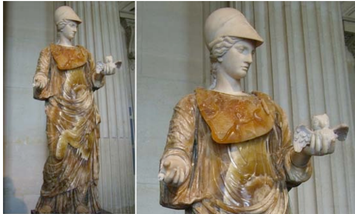
Resim 2. Baykuşlu Tanrıça Athena, Louvre Müzesi.

Yunan Mitolojisinde, zeka, sanat, strateji, barış ve savaşın tanrıçası olarak bilinen Athena'nın sembolleri; mızrak, zeytin dalı ve baykuş'tur. Mızrak; savaşı, zeytin dalı; barışı, baykuş ise; akıl ve bilgeliği temsil eder. Athena'nın babası Tanrıların Tanrısı Zeus, annesi ise Hikmet Tanrıçası Metis'tir. Athena Yunan kentlerini koruyan, barış, akıl, strateji tanrıçası olarak ün yapmış, Roma dönemlerinde ise minerva isminde aynı ilgiyi görmüştür. Louvre Müzesinde, M.S. 2. Yüzyıl'a ait, yaldızlı oniks ve beyaz mermerden üretilmiş, Minerva isimli Baykuşlu Tanrıça Athena heykeli bulunmaktadır (Resim 2).