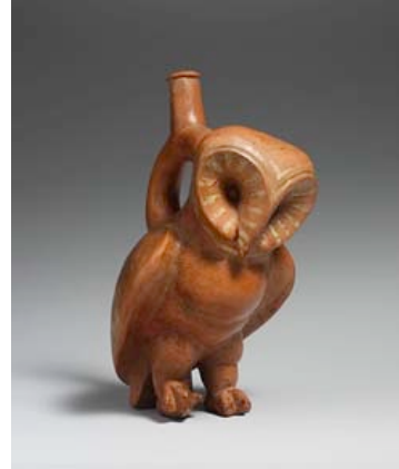
Resim 13. Ağızlıklı Baykuş Şişe, 2. - 3. Yüzyıl, Peru bölgesi, Moche kültürü, yükseklik 24.1 cm, genişlik 11.7 cm.