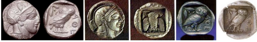
Resim 3. Eski Yunanda Atina kentinde basılan madeni paralar ve Attika sikkelerinin önyüzlerinde Tanrıça Athena'nın kabartma resmi, arka yüzlerinde ise baykuş kabartma resmi bulunmaktadır.

Mitolojide önemli bir yer kaplayan, Atina şehrinin koruyucu tanrıçası olan Athena adına bir çok yerde tapınaklar inşa edilmiş, paralar ve heykeller yapılmıştır. Bu kentin paraları üzerine baykuş resimleri basılmıştır (Resim 3).