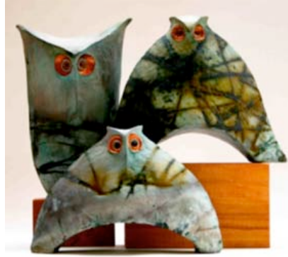
Resim 28. "Üç Baykuşlar"