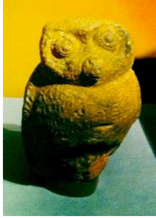
Resim 14. "Pişmiş Toprak Baykuş", Lagos Ulusal Müzesi.

Lagos Ulusal Müzesi koleksiyonunda bulunan, sırsız, pişmiş topraktan yapılmış, yüksekliği yaklaşık 12.5 cm boyutunda olan baykuş örnek, Afrika kıtasında bulunan Nijerya'nın İfe Krallığı döneminde, Yoruba topluluğu tarafından 12. - 15. Yüzyıl'da üretilmiştir (Resim 14).