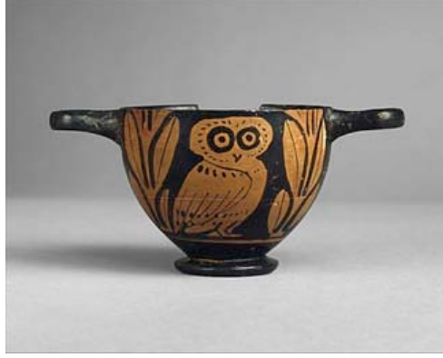
Resim 7. Attika, Yunanistan Kulplu Pişmiş Toprak Vazo, M.Ö. 5. Yüzyıl, Metropolitan Müzesi, İngiltere.

Yunan kırmızı-siyah seramiklerinde “baykuş” figürü farklı formlar üzerinde uygulanmıştır “Anna A. Lemos (1991)”. Bazen bir vazo, bazen bir tabak, bazen de bir saklama kabı, hydria (Antik Yunanda kullanılan, biri dökmek için dik, ikisi kaldırmak için yatay, üç kulba sahip su testisi), kalpis (hydria’ya benzer fakat boynu hydriadan daha dar olan üç kulplu bir kap formu), lekythos (tek kulplu, dar boyunlu, kapalı bir tür Antik Yunan kap formudur, zaman içinde boyu uzamış ve gövdesi daralmış, sürahi, testi benzeri bir kullanımı/formu vardır) yada skyphos (ayaksız, iki kulplu, küçük, antik yunan seramik içki kupası) üzerinde baykuş figürü ile karşılaşılabilmektedir (Resim 8).