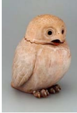
Resim 16. Bizen seramiği baykuş.

Japon seramik kültüründe de baykuş figürünü görmek mümkündür. Boston Güzel Sanatlar Müzesi koleksiyonunda yer alan iki farklı örnekten ilki olan, 19. Yüzyıl Baykuş figürü türünün en çekici örneklerindendir, Japonya'nın, Imbé - Bizen bölgesinde üretilmiştir (Resim 16). İkincisi ise Japonya Shiga - Tsushima bölgesi, 1820 yılı üretimi olan sırlı stoneware baykuş formudur (Resim 17).