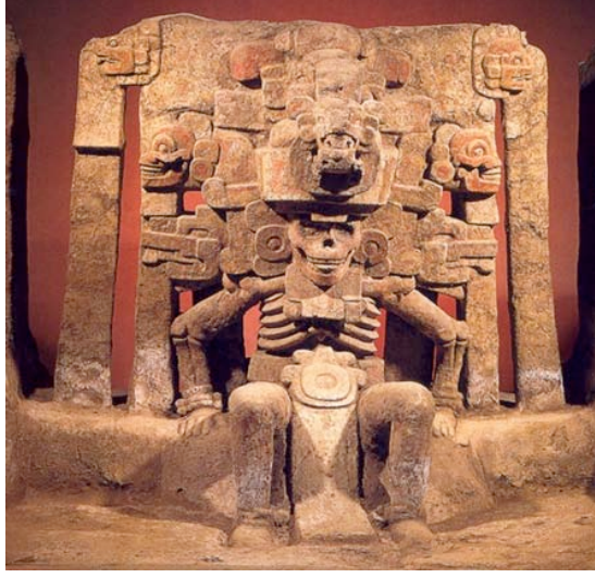
Resim 1. Ölüm ile ilişkilendirilen Aztek Mictlantecuhtli Tanrısının, çoğu zaman başlığında baykuş tüyleri ile tasvir edilmiş heykeli. ( http://www.mexican-folk-art-guide.com/day-of-the-dead-history.html#UrFgPI3WG7g )

Orta Asya Arap mitolojisinde, baykuş kötü alamet olarak görülürdü.