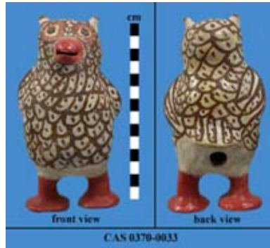
Resim 18. "Pişmiş Toprak Baykuşlar", Lagos Ulusal Müzesi.

Kaliforniya Bilim Akademisinin Antropoloji Koleksiyonda bulunan, Kuzey Amerika, Zuni Pueblo kültürüne ait, 1940-1960 yıllarına tarihlenen, Küresel vücuduna modellenmiş kanadı, kuyruğu, kulakları, gagası ve ayakları ile ayakta duran 17.2 cm yüksekliğinde, 9.3 cm genişliğinde ve 9.1 cm derinliğinde olan baykuş heykelciğinin, kuyruk altında büyük yuvarlak bir deliği vardır. Beyaz astarlıdır ve dış yüzeyine pürüzsüz bir kazıma dekoru uygulanmıştır. Bünye üzerine tüy deseni koyu kahverengi boya ile boyanarak verilmiştir. Açık pozisyonda olan gagası, ayakları ve bakışını tam anlatabilmek için göz etrafı kırmızı boya ile dekorlanmış, imzasız bir heykelciktir (Resim 18).