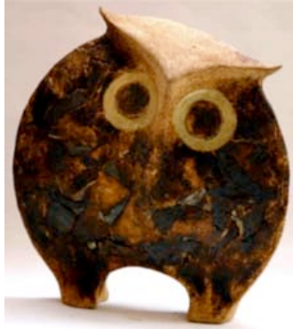
Resim 27. "Üzüm I".

Deniz Onur Erman, baykuşun gözlerini, bakişlarını, pençelerini, duruşunu, hareketlerini, ifadesini kil ile birleştirerek stilize edilmiş seramik formlara, yüzey uygulamalarına, çoklu düzenlemelere ve tekli figüratif çalışmalara dönüştürür. Seramik uygulamalar yaparken farklı türde kiler kullanır, değişik pişirim yöntemleri dener, kimi çalışmalarında ise kille birlikte yan malzemeler kullanır. Sanatçı, yüzey uygulamaları seramik duvar karoları ve duvar tabakları şeklinde çalışır, form çalışmalarında baykuş soyutlamaları, stilize baykuş yorumları, tekli ya da grup halinde sergilenen formlar dikkat çekmektedir (Resim 27-28).