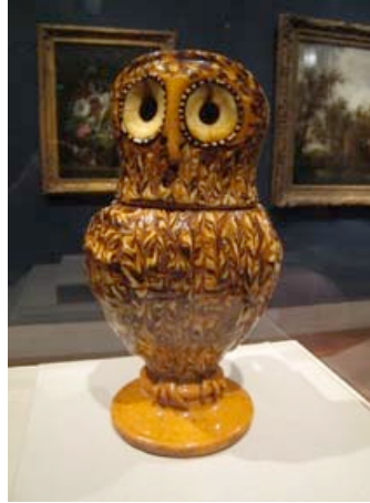
Resim 15. "Baykuş Sürahi", Staffordshire, İngiltere, 17. Yüzyıl, (1690-1710), Earthenware Bünye, Kurşunlu Sır, 23.5 x 15.24 x 15.24 cm, Nelson-Atkins Müzesi, İngiltere.

İngiltere Nelson-Atkins Müzesi koleksiyonu olan, turuncu Earthenware , "Baykuş Sürahi", Staffordshire bölgesi üretimidir. İngiltere'deki bu bölgede; 17. Yüzyılın başlarından beri earthenware pişmiş toprak bünyeli ve kurşunlu sırlı ürünler üretilmekteydi ve aşağıdaki örneğe benzer üretilere rastlamak mümkündür (Resim 15).