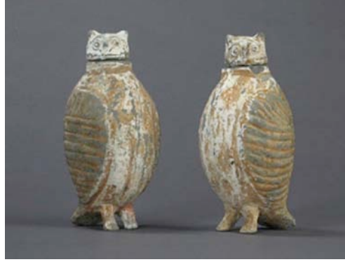
Resim 5. Beyaz ve gri renkli seramik baykuşlar, Yükseklik: 20.3 x Genişlik: 8.9 x Derinlik: 10.2 cm., M.Ö. 206-220, Han Hanedanlığı / Çin. ( http://www.hmluther.com/productpage2.php?subcategory=SCULPTURE&parent=ART&item=7333 )

M.Ö. 206 - M.S. 220'ye tarihlenen Çin Han Hanedanlığı döneminde üretilmiş, bir çift beyaz ve gri pişmiş toprak baykuş, Paris, Guimet Müzesi (Musée National des Arts Asiatiques-Guimet), koleksiyonunda bulunmaktadır. Her biri alçak rölyef ile şekillendirilmiş kanatlara ve oval vücudunun üzerinde hareketli bir kafaya sahiptir, iki ayakları ve kuyrukları üzerinde durmaktadır (Resim 5).