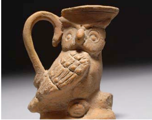
Resim 12. Antik Roma Kuzey Afrika Baykuş Figürlü Kap, Yükseklik yaklaşık 17 cm, M.S. 300.

Aslında, hayvan formlu seramikler Korint'ten (Gördüs / Gördös, Mora Yarımadası'nı Yunanistan anakarasına bağlayan Korint Kıstağı'nın üstünde yer alan bir şehir devletiydi) Atina'ya gelmiş olmasına rağmen, altıncı yüzyıla doğru yol alındıkça, Attika üretim özellikleri Korint bölgesindeki seramik üretim gelişmelerini etkilemiştir. New York Metropolitan Sanat Müzesi koleksiyonunda olan aşağıdaki ağızlıklı baykuş şişe bu duruma örnek bir Attika eserdir (Resim 13).