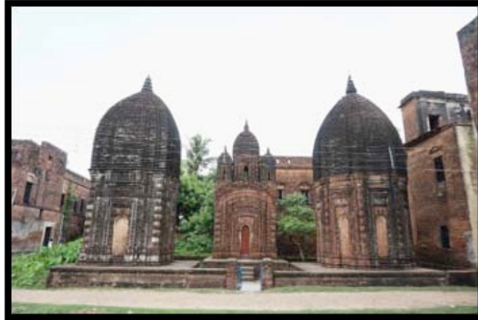
Görsel 10. Bengal'de bulunan Sribati Tapınak Kompleksi

Aynı stil ve büyüklükteki yapıların yan yana dizilmesiyle oluşan tapınaklar gruplandırılarak değerlendirilmektedir. Diğer bir "Grup" tapınak örneği de ortak bir avluya bakan ancak farklı biçimlerde inşa edilmiş tapınaklardır. Gruplandırılmış on iki adet "At-chala" tarzında inşa edilmiş ve Kral Şiva'ya adanmış yüz sekiz adet tapınak ve yirmi beş farklı tapınaktan oluşan Sukhariada bulunan Anandabhairavi tapınağı, Kalna'da yer alan Rajbari tapınak kompleksi, Sri-bati tapınak kompleksi ve Pratepeshwar Tapınağı grup tapınak örnekleri arasında yer almaktadır. 3 Kral Şiva'ya adanmış tapınaklar Mihrace Teja Chandra Bahadhur tarafından 1809 yılında yapılmıştır. Bu tapınaklar teşbih boncuklarını andıracak şekilde bitişik olarak dizilmiş iki daireyi oluşturacak biçimde yerleştirilmişlerdir. Tapınakların duvarlarında Ramayana ve Mahabharata destanlarından hikayeler ve av sahneleri terakota karolar üzerine betimlenmiştir.