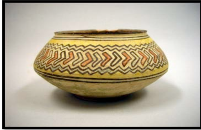
Görsel 2. İndüs Vadisi'nde bulunan çok renkli kilden yapılmış kap

İndüs Vadisi'ne ait seramik örneklerde dikkat çeken diğer bir özellik de kilden yapılmış mutfak gereçlerinin çömlekçi çarkı kullanılarak şekillendirilmesidir. Tıpkı figürünlerde olduğu gibi mutfak gereçlerinde de geometrik ve tekrarlanan dekoratif öğeler görülmektedir. Ancak figürünlerde sadece siyah ve kırmızı renk kullanılmışken mutfak gereçlerinde mavi, yeşil ve sarı gibi renkler de kullanılmıştır.