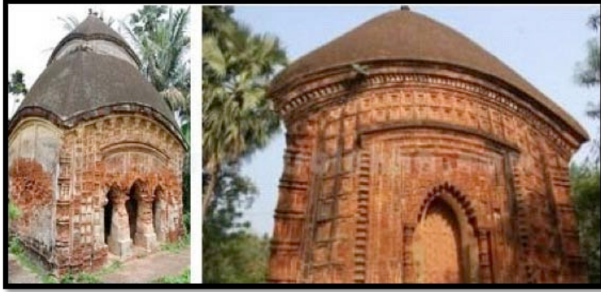
Görsel 9. Char-chala ve "At-chala" tapınak örnekleri

Aynı stil ve büyüklükteki yapıların yan yana dizilmesiyle oluşan tapınaklar gruplandırılarak değerlendirilmektedir. Diğer bir "Grup" tapınak örneği de ortak bir avluya bakan ancak farklı biçimlerde inşa edilmiş tapınaklardır. Gruplandırılmış on iki adet "At-chala" tarzında inşa edilmiş ve Kral Şiva'ya adanmış yüz sekiz adet tapınak ve yirmi beş farklı tapınaktan oluşan Sukhariada bulunan Anandabhairavi tapınağı, Kalna'da yer alan Rajbari tapınak kompleksi, Sri-bati tapınak kompleksi ve Pratepeshwar Tapınağı grup tapınak örnekleri arasında yer almaktadır. 3 Kral Şiva'ya adanmış tapınaklar Mihrace Teja Chandra Bahadhur tarafından 1809 yılında yapılmıştır. Bu tapınaklar teşbih boncuklarını andıracak şekilde bitişik olarak dizilmiş iki daireyi oluşturacak biçimde yerleştirilmişlerdir. Tapınakların duvarlarında Ramayana ve Mahabharata destanlarından hikayeler ve av sahneleri terakota karolar üzerine betimlenmiştir.