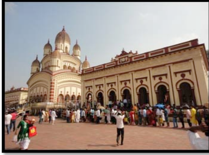
Görsel 4. Dakshineswar Kali Tapınağı, ana tapınak, Kalküta/ Hindistan

Hindu sanatının en önemli özelliklerinden biri eşsiz görselleştirme gücüdür. Özellikle mitlere dayalı olan Hinduizm'de zihinde tasavvur edilen tanrılar, onların özellikleri, hikayeleri Hindu sanatında sanatçıların imgeleştirme yetenekleri ile benzersiz bir şekilde somutlaştırılmıştır (Goetz, 1964:148-149). Sanatçılar tarafından iki ve üç boyutlu formlar olarak biçimlendirilen tanrı formları başta büyük tapınaklar olmak üzere günlük yaşam alanlarında bulunmaktadır.