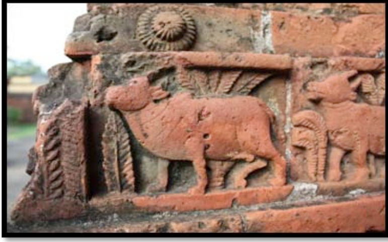
Görsel 13. Madan-Mohan Tapınağı, detay, Bishnipur / Hindistan

Köşelerde dört adet küçük ve ortada bir adet büyük kuleden oluşan tapınaklar Pancha-ratna olarak isimlendirilmektedir. 1643 yılında Malla Kralı Raghunath Singha tarafından yaptırılan Shyam Rai Tapınağı önemli Pancha-ratna terakota örneklerindedir. Tapınağın dört tarafında da üç kemerli girişler bulunmakta ve dış cephelerin hepsi terakota plakalar ile kaplanmıştır. Plakalar üzerinde Tanrı Krişna ve Rahda'nın sevişme sahneleri bulunmaktadır.