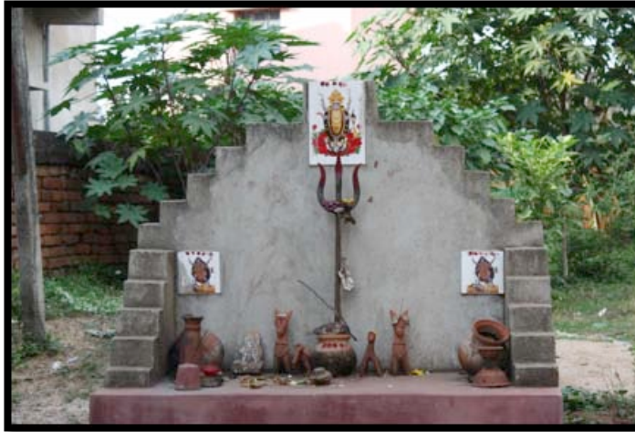
Görsel 5. Mahalle arasında yer alan sunak, Bishnipur / Hindistan

Hindu sanatının en önemli özelliklerinden biri eşsiz görselleştirme gücüdür. Özellikle mitlere dayalı olan Hinduizm'de zihinde tasavvur edilen tanrılar, onların özellikleri, hikayeleri Hindu sanatında sanatçıların imgeleştirme yetenekleri ile benzersiz bir şekilde somutlaştırılmıştır (Goetz, 1964:148-149). Sanatçılar tarafından iki ve üç boyutlu formlar olarak biçimlendirilen tanrı formları başta büyük tapınaklar olmak üzere günlük yaşam alanlarında bulunmaktadır.