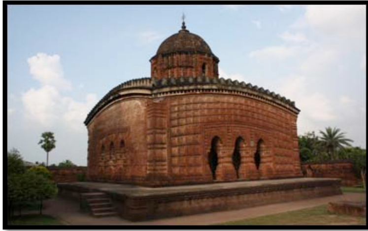
Görsel 12. Madan-Mohan Tapınağı, Bishnipur / Hindistan

Ek-ratna stili tapınaklar sivri tepeleri ve kuleli yapılarıyla At-chala tarzı tapınakları andırsalar da kulenin altında kalan çatının basık yapısı ile birbirlerinden ayrılmaktadırlar. Bishnupur'un en büyük tapınaklarından biri olarak bilinen Madan-Mohan Tapınağı 1694 yılında Malla Kralı Durjana Singha tarafından yaptırılmıştır (Perryman, 2000:172). 'Ek-ratna' (tek kule) biçiminde inşa edilmiş olan tapınak Hinduizmde bulunun Puranalar ile Ramayana ve Mahabharata destanlarında yer alan anlatımların sahnelendiğı terakota birimlerle kaplanmıştır. Ana tapınağın dört tarafı duvarlarla çevrilmiş ve üç girişinde de büyük çaplı ikişer adet revak bulunmaktadır. Revak sütunlarının üzerinde Kral Rama ve Hindu tanrıların maymunlarla yapmış olduğu mitolojik savaş tasvir edilmiştir. Aynı zamanda tapınağın dış cephesinde bulunan terakota karoların ve sütunların üzerinde çeşitli çiçek, kuş betimlemeleri ile Kral'ın romantik sahneleri bulunmaktadır. Radha Shyam ve Lalji tapınakları da Ek-ratna biçimine örnek olmaktadır.