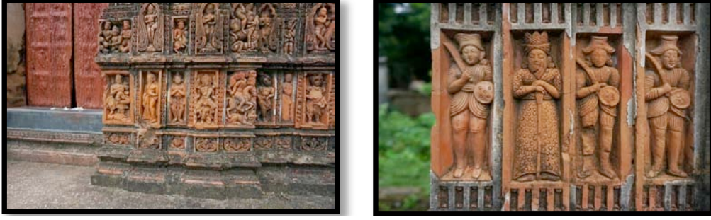
Görsel 11. Bengal'de bulunan Sribati Tapınak Kompleksi- terakota detaylar

Ek-ratna stili tapınaklar sivri tepeleri ve kuleli yapılarıyla At-chala tarzı tapınakları andırsalar da kulenin altında kalan çatının basık yapısı ile birbirlerinden ayrılmaktadırlar. Bishnupur'un en büyük tapınaklarından biri olarak bilinen Madan-Mohan Tapınağı 1694 yılında Malla Kralı Durjana Singha tarafından yaptırılmıştır (Perryman, 2000:172). 'Ek-ratna' (tek kule) biçiminde inşa edilmiş olan tapınak Hinduizmde bulunun Puranalar ile Ramayana ve Mahabharata destanlarında yer alan anlatımların sahnelendiğı terakota birimlerle kaplanmıştır. Ana tapınağın dört tarafı duvarlarla çevrilmiş ve üç girişinde de büyük çaplı ikişer adet revak bulunmaktadır. Revak sütunlarının üzerinde Kral Rama ve Hindu tanrıların maymunlarla yapmış olduğu mitolojik savaş tasvir edilmiştir. Aynı zamanda tapınağın dış cephesinde bulunan terakota karoların ve sütunların üzerinde çeşitli çiçek, kuş betimlemeleri ile Kral'ın romantik sahneleri bulunmaktadır. Radha Shyam ve Lalji tapınakları da Ek-ratna biçimine örnek olmaktadır.