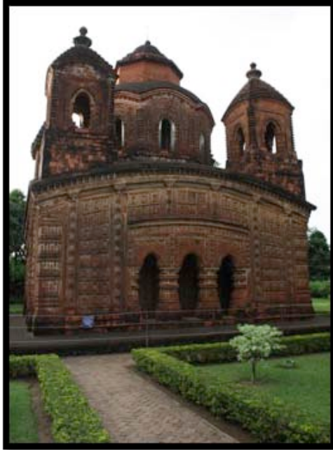
Görsel 14. Shyam Rai Tapınağı, Bishnipur / Hindistan

Köşelerde dört adet küçük ve ortada bir adet büyük kuleden oluşan tapınaklar Pancha-ratna olarak isimlendirilmektedir. 1643 yılında Malla Kralı Raghunath Singha tarafından yaptırılan Shyam Rai Tapınağı önemli Pancha-ratna terakota örneklerindedir. Tapınağın dört tarafında da üç kemerli girişler bulunmakta ve dış cephelerin hepsi terakota plakalar ile kaplanmıştır. Plakalar üzerinde Tanrı Krişna ve Rahda'nın sevişme sahneleri bulunmaktadır.