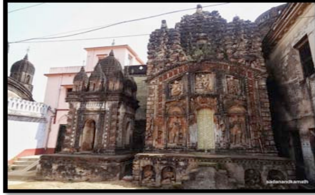
Görsel 21. Goverdhan Tapınağı, Mancha örneği Bhadravara, Kotulpur

Tapınakların yakınlarında “mancha” adı verilen tapınaklardan daha küçük boyutlu yardımcı yapılar bulunmaktadır. Mancha’ların tek tip bir biçimsel özelliği bulunmamaktadır. Ancak genellikle yüksek dikmelerden oluşan kemerli bir mimarisi bulunmaktadır. Mancha yapılarında tıpkı tapınaklarda olduğu gibi dış cephelerinde terakota kaplamalar görülmektedir.