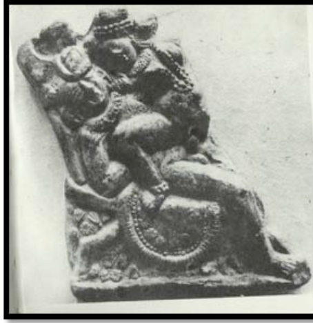
Görsel 3. Tamluk'ta bulunan terakota kabartma

Hindistan dinsel sanatının örneklerinde seksüel anlatımların da oldukça ön planda olduğu görülmektedir. Bir geleneğin eskilere ait parçaları olarak değerlendirilen seksüel imgeler taşıyan terakota örnekler tanrıların çiftleşmelerini ya da fantezi dünyalarına dair izler taşımaktadır (Desai, 1985:9-14).