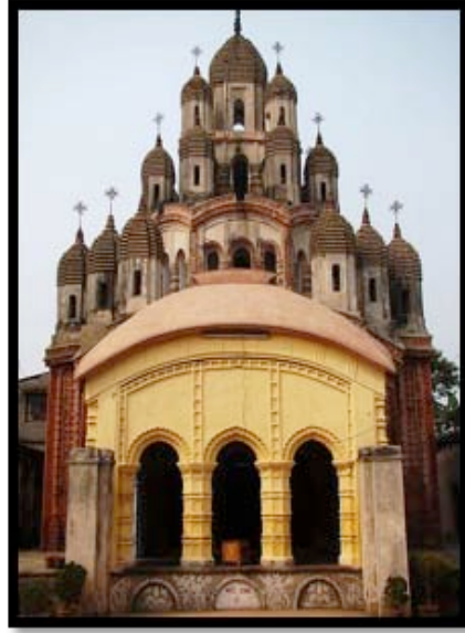
Görsel 17. Gopal Bari Tapınağı

“Yağmurdan, güneşten korunmak için yapılan ve arkası bir duvara verilen çatı” 4 olarak tanımlanan sundurma pek çok Hindu tapınağında görülen bir özelliktir. Bir sırtı duvara dayalı olan yapısı bulunan tapınaklar Sundurmalı (Porches) Tapınaklar olarak adlandırılmaktadır. Sundurmalar, tapınaklarda ziyaretçilerin ve ibadet edenlerin sosyalleştiği ve yiyecek içecek servislerinin yapıldığı mekanlar olarak kullanılmaktadır. Bazı terakota tapınaklarda, sundurma tapınağın bir parçası olarak, tapınakla aynı şekilde dekore edilmiş iken bazı tapınaklarda daha gösterişli bir biçimde bulunmaktadır. Kalna'da bulunan Gopalji Tapınağı sundurmalı tapınak örnekleri arasında yer almaktadır.