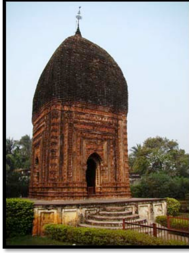
Görsel 18. Pratapeswar Tapınağı, Kalna

Sekizgen olarak tasarlanmış tapınaklar da Hindistan'da bulunan tapınak çeşitleri arasında yer almaktadır. Yaygın olarak tercih edilmeyen sekizgen yapı biçimi Rekha ve Pidha Deuls şeklindeki gibi bir inşa yöntemi kullanmıştır. Ancak sekizgen tapınaklarda Rekha ve Pidha Deuls tapınaklarında olduğu gibi bir yüksek kavisli çatı sistemi kullanılmamıştır. Sekizgen tapınakların çatılarındaki kavis daha alçak ve basık bir görünümdeydir. Birbhum Bölgesi, Ilambazar'da yer alan Mahaprabhu tapınağı nadir görülen sekizgen tapınaklardan biridir. Aynı bölgede yer alan bir diğer sekizgen tapınak ise Chandranatha-Shiva Tapınağıdır. Bu eşi görülmemiş bir şekilde tapınak sekizgen tapınak mimarisi ile Navarathna tarzının etkileyici uyumunu göstermektedir.