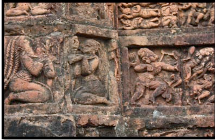
Görsel 8. Jor Bangla-Kesta Rai Tapınağı –detey, Bishnipur / Hindistan

Dört adet üçgen kavisli çatının tek bir noktada birleştiği çatı tasarımından oluşan tapınaklar Char-chala olarak adlandırılmaktadır. Bu tapınaklar genellikle dar ve bindirmeli tonozlardan ve uzun kaidelerin taşıdığı merkezi bir kubbe yapısından oluşmaktadır. Char-chala tarzı inşa edilmiş tapınaklar Bengal bölgesinin batısında görülmektedir. Eğer Char-chala mimarisinde yapılmış tapınağın çatısının üzerine minyatür bir tapınak daha inşa edilirse tapınak biçimi “At-chala” olarak değişmektedir.