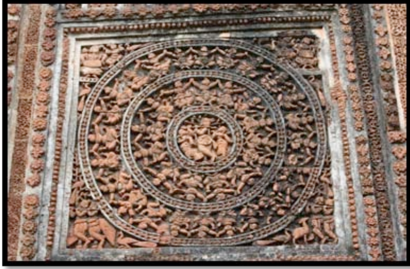
Görsel 15. Shyam Rai Tapınağı, detay, Bishnupur / Hindistan

Navarathna tarzı tapınaklar Pancha-ratna stili tapınaklardan türetilerek oluşturulmuştur. Pancha-ratna biçiminde bulunan ortadaki büyük kulenin üzerine dört adet daha küçük kuleler eklenmiştir. Böylelikle dokuz kuleden oluşan tapınaklar Navarathna olarak adlandırılmıştır. Hadal Narayanpur'da bulunan Choto Taraf Tapınağı Navarathna mimari yapısına örnek teşkil etmektedir. Tapınağın üçlü kemer girişinin ortada yer alan ana panelinde ana girişinde Mahabharata destanından epik bir sahne terakota plakalara kabartma tekniği kullanılarak betimlenmiştir.