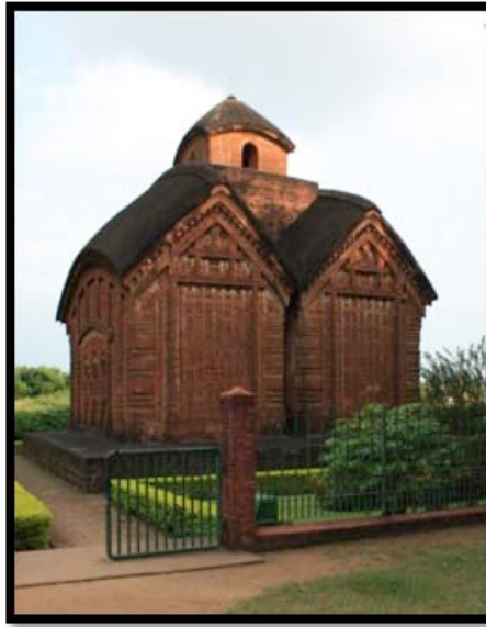
Görsel 6. Jor Bangla-Kesta Rai Tapınağı, Bishnipur / Hindistan

“Ek Bangla” olarak adlandırılan grupta yer alan tapınakların genel özelliği iki adet eğimli çatıdan oluşmasıdır. On altıncı ve on dokuzuncu yüzyıllar arasında Vishnupur(Bishnupur) şehri sanatın da yöneticisi olarak bilinen Malla kralları tarafından yönetilmiştir (Perryman, 2000:171). Bu dönemde Malla Kralı Raghunath Singh tarafından yaptırılmış olan Jor Bangla-Kesta Rai Tapınağı “Ek Bangla” tapınak yapısında inşa edilmiştir. İki farklı çatısı bulunan yapı ortada yer alan tek bir kule tarafından birleştirilmiştir. Tapınak bir metre yüksekliğindeki laterit taş üzerine inşa edilerek tüm dış yüzeyi terakota plakalarla kaplanmıştır. Dış cephelerde yer alan terakota plakalar, Hindu dininde yer alan insan yaşamına ait hikayeleri, tanrı ve tanrıçaların tasvirlerini, hayvan, çiçek ve geometrik süslemelerden oluşmaktadır.