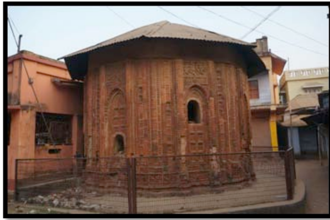
Görsel 19. Mahaprabhu Tapınağı

Sekizgen olarak tasarlanmış tapınaklar da Hindistan'da bulunan tapınak çeşitleri arasında yer almaktadır. Yaygın olarak tercih edilmeyen sekizgen yapı biçimi Rekha ve Pidha Deuls şeklindeki gibi bir inşa yöntemi kullanmıştır. Ancak sekizgen tapınaklarda Rekha ve Pidha Deuls tapınaklarında olduğu gibi bir yüksek kavisli çatı sistemi kullanılmamıştır. Sekizgen tapınakların çatılarındaki kavis daha alçak ve basık bir görünümdeydir. Birbhum Bölgesi, Ilambazar'da yer alan Mahaprabhu tapınağı nadir görülen sekizgen tapınaklardan biridir. Aynı bölgede yer alan bir diğer sekizgen tapınak ise Chandranatha-Shiva Tapınağıdır. Bu eşi görülmemiş bir şekilde tapınak sekizgen tapınak mimarisi ile Navarathna tarzının etkileyici uyumunu göstermektedir.