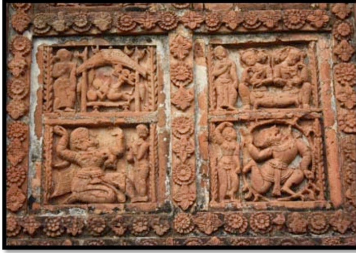
Görsel 7. Jor Bangla-Kesta Rai Tapınağı –detay, Bishnipur / Hindistan