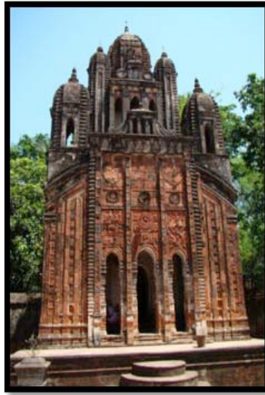
Görsel 16. Choto Taraf Tapınağı, Hadal Narayanpur- Bankura

Navarathna tarzı tapınaklar Pancha-ratna stili tapınaklardan türetilerek oluşturulmuştur. Pancha-ratna biçiminde bulunan ortadaki büyük kulenin üzerine dört adet daha küçük kuleler eklenmiştir. Böylelikle dokuz kuleden oluşan tapınaklar Navarathna olarak adlandırılmıştır. Hadal Narayanpur'da bulunan Choto Taraf Tapınağı Navarathna mimari yapısına örnek teşkil etmektedir. Tapınağın üçlü kemer girişinin ortada yer alan ana panelinde ana girişinde Mahabharata destanından epik bir sahne terakota plakalara kabartma tekniği kullanılarak betimlenmiştir.