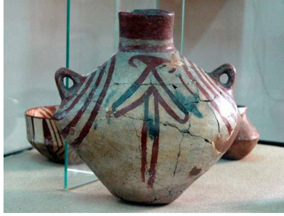
Görsel 1: Kalkolitik dönem geometrik bezemeli astarlı seramik kap, M.Ö. 18. Y.Y., Anadolu Medeniyetleri Müzesi

Tarihin kaydettiği en eski seramik buluntular Anadolu’ da M.Ö. 6000 yıllarına aittir. O dönemde insanlar resimleri sadece mağara duvarlarına yapmamışlardır. Çevresini inceleyen insan ihtiyaçları doğrultusunda ürettiği nesnelere de yine çevresinde gördüğü çeşitli bitki, hayvan motiflerini kendince yorumlayarak resmetmiştir. Bu nesnelere birisi olan seramik, üzerine yapılan bezemeler ile o dönem insanının yaşantısından kesitler sunarak, tarihi belge niteliği kazanmaktadır. Anadolu insanı bu bezemeleri, törensel içki kapları, idoller, ana tanrıça heykelleri, kandiller gibi günlük kullanım eşyalarında kullanmıştır (Görsel 1).