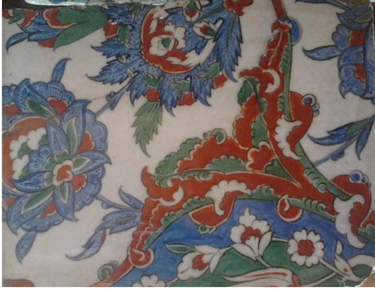
Görsel 3: Topkapı Sarayı'ndan İznik Çinileri, 16. yy., Kütahya Çini Müzesi