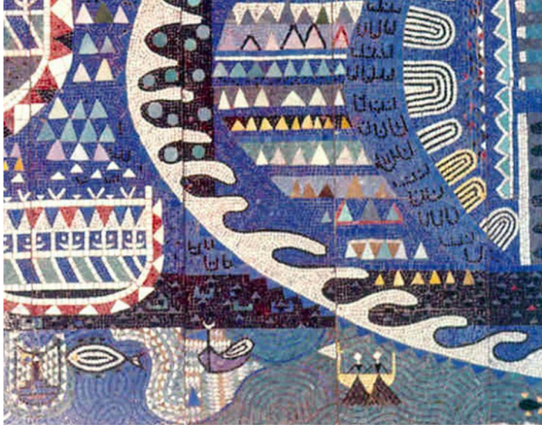
Görsel 5: Bedri Rahmi Eyüboğlu, Mozaik Pano