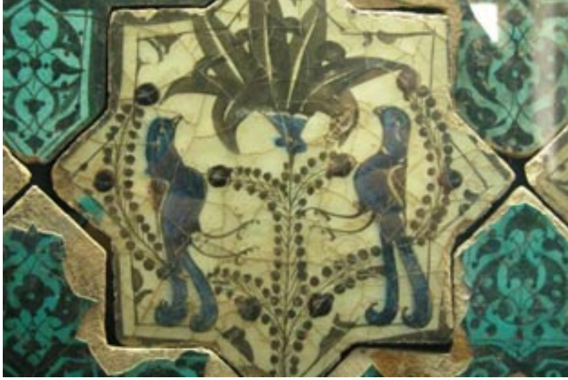
Görsel 2: Kubadabad Sarayı Çinileri, 13. yy., http://www.selcuklular.com/upload/2009/3683-0.jpg (Erişim Tarihi: 08.08.2014)