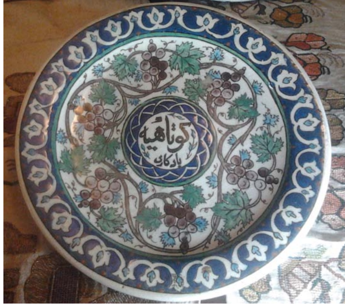
Görsel 4: Kütahya Çinileri, 20. yy., Kütahya Çini Müzesi, (Fotoğraf: Kişisel Arşiv)