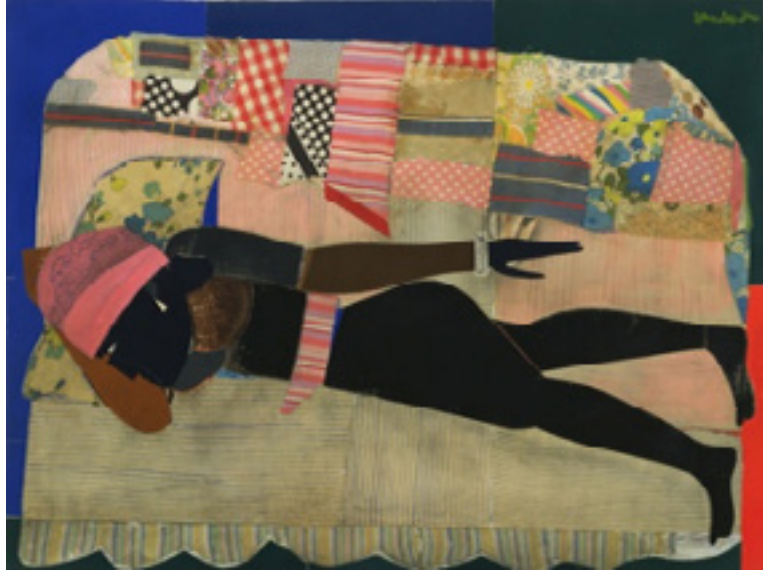
Görsel 2: Patchwork Quilt (Kırkyama Yorgan) 90.9 x 121.6 cm (1970)

1960 sonrasında ortaya çıkan kavramsal sanat akımı ile sanatta malzeme kavramı kalkmıştır. 'Kavramsal sanatta form önemsizdir. Düşünce; sayı, fotoğraf, kelime ya da başka herhangi bir yolla ifade edilebilir' (Bağatır, 2011:27). Bu bağlamda kırkyama yöntemini kavramsalcular da kullanmışlardır. Ünlü sanatçı Joana Vasconcelos birçok çalışmasında kumaşlardan faydalanmıştır. Küçük kumaş parçalarını birleştirerek oluşturduğu dev yapıtlar dünya çapında bir üne sahip olmuştur. Kırkyama tarzı yapılmış en bilindik çalışmalarından bir tanesi 'Contamination (Kirlilik)' adlı eserdir. 3 2011 yılında sergilenen bu eser Venedik 54. Görsel Sanatlar Bienali kapsamında Palazzo Grassi otelinin neredeyse hepsini kaplayacak şekilde yapılmıştır (Görsel 3).