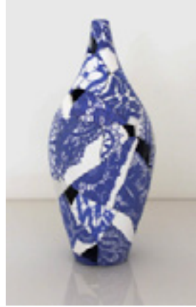
Görsel 9: Ceramic Patchwork Bottle -Zoe Hillyard, Lizzie Mary Collection New Brewery Arts -2013

Sanatçı çalışmalarında kendi tasarladığı ya da ailesinden kalma kumaşları ya birebir ya da dijital baskısı alınarak kullanmaktadır. New Brewery Art'da sergilenen bir çalışmasında dört kuşak öncesine ait dantellerle birlikte kendisinin çocukluk yaşlarında yaptığı dantelleri kullanmıştır.