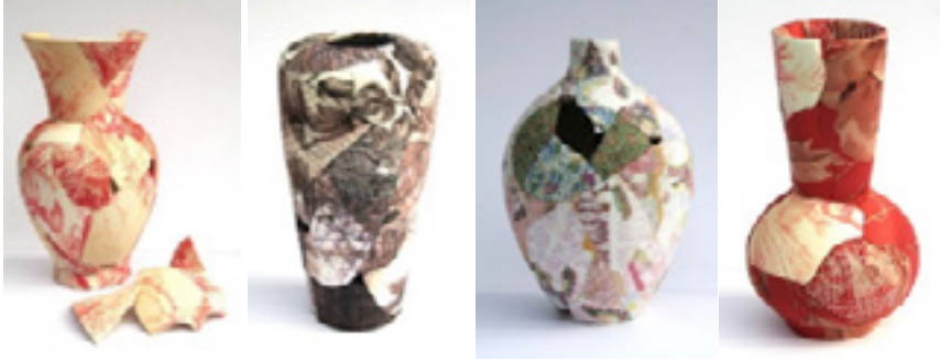
Görsel 6: Dijital Print Collection(Dijital Baskı Koleksiyonu), Zoe Hillyard, 2012

Zoe Hillyard kumaşın yanı sıra kullandığı kumaş desenlerini dijital baskı yöntemi ile seramik yüzeyler üzerine uygulamaktadır. Gerçek kumaş ve baskı yönteminin birlikteliği ile ortaya çıkan eserler beğeni toplamış ve British Müzesi gibi önemli müzelerin koleksiyonlarında daimi olarak sergilenmektedir.