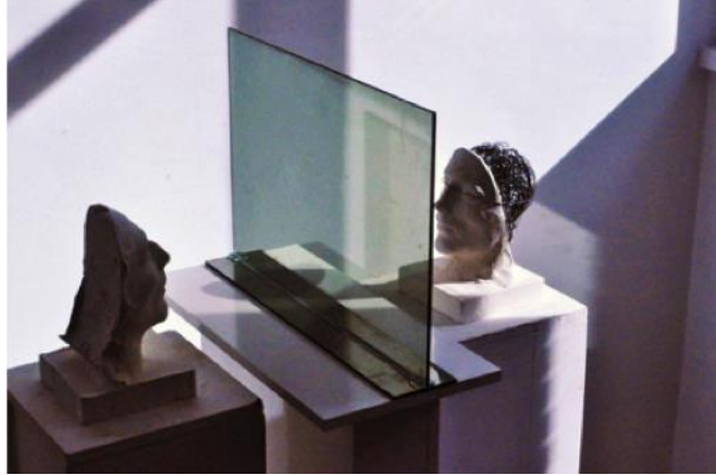
Resim 1. Oktay'ın nesne dönüştürme etkinliğine ait yerleştirme çalışması.

Yukarıdaki tabloyu incelediğimizde öğrencilerden dördünün ifade aracı olarak video sanatını seçtikleri, birisinin yerleştirme yaptığı, kalan birisinin de afiş çalışması yaptığı görülmektedir. Ele aldıkları kavramları incelediğimizde ise etkinliğin yapısı itibarıyla hayatlarından yola çıkan çalışmalar gerçekleştirdikleri ve genel olarak olumsuz yönde etkilendikleri olayları seçtikleri anlaşılmaktadır. Öğrencilere bu durum sorulduğunda, negatif şeylerin yaşamlarında daha fazla iz bıraktığı ve olumlu şeylere göre daha fazla hatırlandığı yönünde yanıtlar alınmıştır.