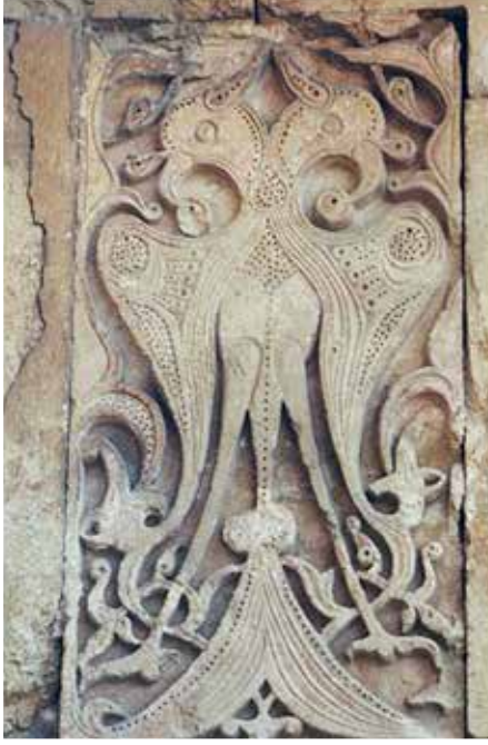
Resim 4: Büyük Selçuklu Çift Başlı Kartalı

Çoğu yazar en eski kuşevlerinin 16. yüzyıl- da yapılmaya başladığını iddia ederler. Oysa Cengiz Bektaş'ın "Kuşevleri" kitabında belirt- tiğine göre, Sivas İzzeddin Keykavus Şifahane- si'nde bulunan örnekler 13. yüzyıldan, Çoban Köprüsü'ndeki kuşevi 14. yüzyıldan, Cengiz Bektaş'ın Karadağ Değle'de bir kilisede bulunduğu kuşevleri ise çok daha eskilerden kalmadır. 7 İstanbul'daki en eski örnekler ise Mimar Sinan'dan yani 16. yüzyıldan kalmadırlar. Mimar Sinan'ın hemen hemen her yapıtında kuşevlerine ayrı bir önem verildiği gözlenmektedir. Bu da Mimar Sinan'ın büyük bir sanatçı olmasının yanında, insani yönünün ne kadar gelişmiş olduğunu, kendinden güçsüzleri düşünerek yapıtlarına onlar için de yer verdiğini göstermektedir.