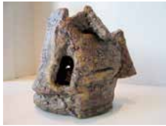
Resim 16: Küre Şekilli Kuşevi, Stan Bitters