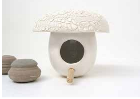
Resim 14: Küre Şekilli Kuşevi, Michael McDowell