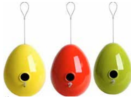
Resim 12,13: Yumurta Kuşevleri, Jim Schatz