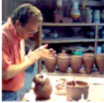
Resim 9: Kedi Çıkışlı Kuşevi