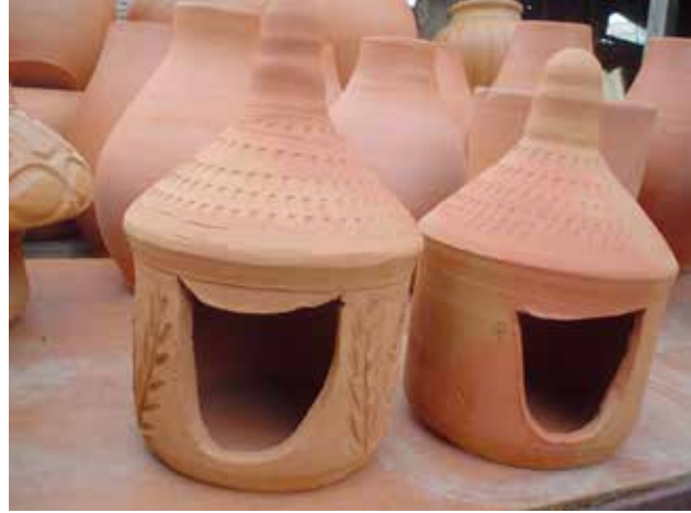
Resim 7: Menemen Yöresinden Kuşevi