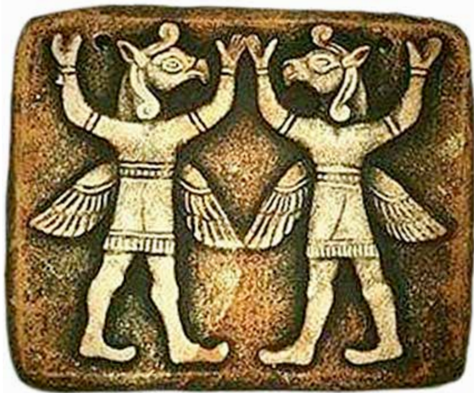
Resim 3: Hitit Kuş Adamları imitasyonu

Ayrıca Anadolu'da Türklerden önce yaşamış kültürlerin de, Osmanlı kültürü üzerindeki etkisi vardır. Örneklersek; Hititlerde kuş adamların, Eski Yunanda Zeus'u temsil eden kartalın, Perslerde ve Selçuklularda güç simgesi olan çift başlı kartalın, Hıristiyanlıkta güvercinin kutsal olması; Osmanlı kültürünü direk olmasa da, dolaylı yollardan etkilemiştir.