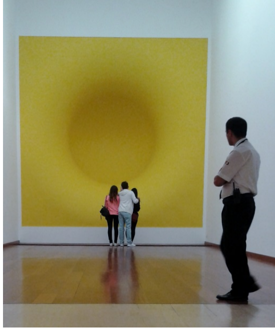
Görsel 3. Anish Kapoor Sergisinden, Sabancı Müzesi, 10 Eylül 2013 – 2 Şubat 2014, İstanbul.

Müzelerin, izleyiciyle sanat çalışması arasında sınırlar bulundurmasının yanı sıra, müzelerin kamusal olduğunu savunan pek çok eleştirmen bulunmaktadır. Kamusal olmasalardı, herkesin kullanabildiği tuvaletleri de olmazdı şeklinde açıklamalar da bu ifadelerin içindedir. Aslında, müzelerin kamuya ait olduğunu gösteren, kamunun ifade ettiği düşünceler ve gerçekleştirdiği eylemler de, bu fikri doğrular. Örneğin; Kültür Bakanlığı'nın Louvre Müzesi koleksiyonunu milyonlarca Euroya Abu Dhabi'ye satmasının gündeme gelmesi Fransa'da sansasyon olmuştur. Sonuçta, Kültür Bakanlığı kamuya Louvre'un koleksiyonunun verilmeyeceğini, sadece adının ve müzecilik konusundaki bilgilerinin paylaşılacağını açıklamak zorunda kalmıştır. Benzer bir olay da, ünlü modacı Salvatore Ferragamo'nun, koleksiyonunun defilesini yapmak üzere Louvre'u kiraladığında, halkın tepkisini ortaya koymasıyla, ortaya çıkmıştır. Louvre Müzesi yetkilileri bir açıklama yapmak için ciddi bir bütçe ayırmıştır. Açıklamada, düzenlenmek istenen defile için ayrılan alanın, müzenin galerilerinden biri olmadığını, yalnızca cam piramidin yanındaki bölüm olduğunu belirtir (Köksal, 2013).