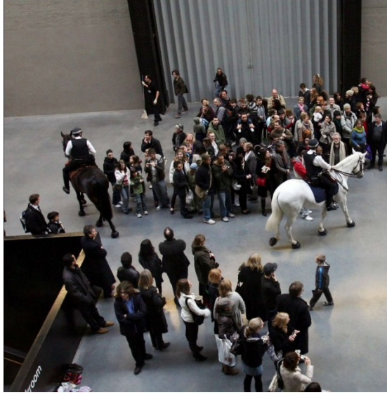
Görsel 4. Tania Bruguera: Tatlin'in Fısıltısı 5, 2008.

http://www.tate.org.uk/whats-on/tate-modern-tanks-tate-modern/exhibition/tania-bruguera-immigrant-movement-international