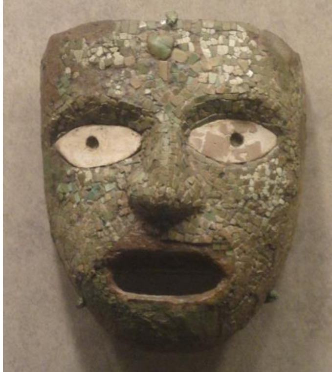
Görsel 6: Seramik maske, Meksika Antropoloji Müzesi

insan ve hayvan silüetleri taşıyan kaplar ve heykeller olarak karşımıza çıkmaktadırlar. Mayalar taştan yapılan maskelerin yanında seramikten çok karakteristik ve güçlü ifade anlamı olan maske örnekleri de yapmışlardır. Meksika'nın önemli kültür mirası olan seramik ve diğer malzemelerden yapılan maskeler "Anadolu ve Orta Amerika Ülkelerindeki Geleneksel Seramik El Dekorlarının Karşılaştırılması" isimli, (1306E224 numaralı) Anadolu Üniversitesi Yayın ve Araştırma Teşvik Projesi kapsamında Meksika'ya yapılan araştırma gezisinde en dikkat çekici objeler arasındadır.(Görsel 6)