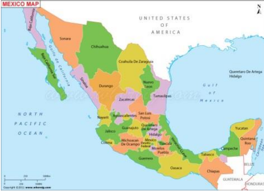
Görsel 2: Meksika haritası

( http://www.thinglink.com/scene/365590627666100225 )