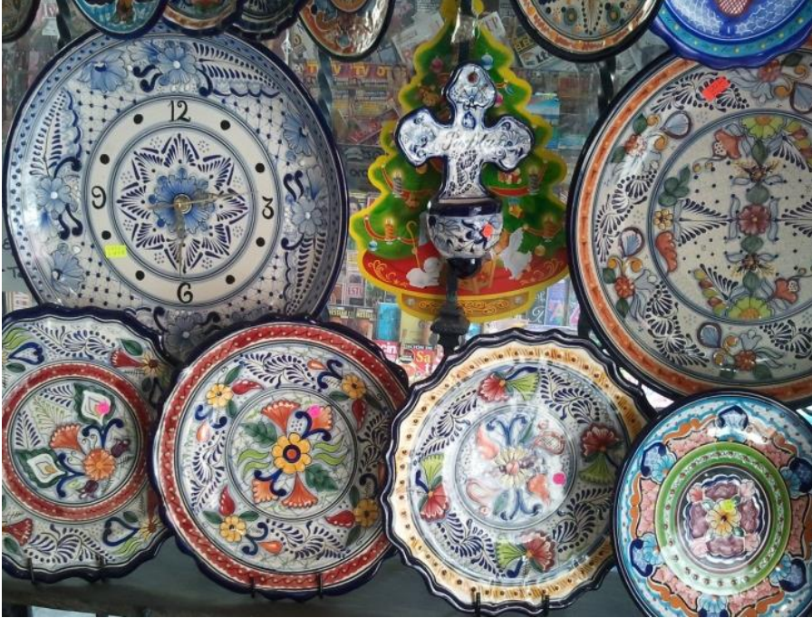
Görsel 7: Talavera Seramikleri, Pueblo Meksika, (Fotoğraf: Cemalettin Sevim)

kullanılmaya başlanmıştır. Bununla birlikte klasik formların yanında Avrupa etkisindeki formlarda yapılmıştır. İspanyol ve Avrupa kültürünün etkisiyle seramik dekorlarında ve renklerinde değişimler olmuştur. Bu yeni etkileşime rağmen değişik bölgelerdeki yerel halk ve çömlekçiler geleneksel kültüre dayalı üretimlerini günümüze kadar sürdürmeye devam etmişlerdir. Bugün hala Meksika’da geleneksel ve kendine has yöntemleri ile üretim yapan bölgeler bulunmaktadır. (Pueblo, Jelisco, Mepetec, Mexico, Guerrero, Guanajuato, Chihuahua, Chiapas ve Oaxaca) İspanyol işgalinden sonra Puablo eyaletine İspanya’nın Talavera bölgesinden seramik ustaları gelerek mayolika tekniği ile düşük derecede pişirilen seramik kaplama karoları ve kullanım eşyaları yapmışlardır. Meksikalı ustalar tarafından benimsenen talavera seramikleri daha sonra Meksika kültürünün etkisiyle yeniden biçimlenip, başlangıçta mavi ve tonlarının üzerinde olan renkler sarı, kırmızı, siyah, yeşil ve mor olarak üretimini günümüze kadar sürdürmüştür.(Görsel 7)