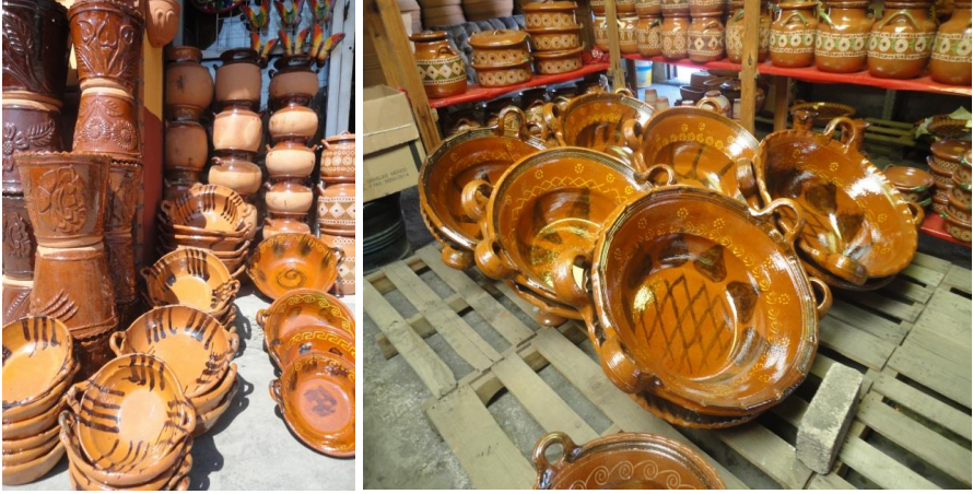
Görsel 8-9: Geleneksel Metepek seramikleri, Metepec Meksika, (Fotoğraf: Öznur Yıldırım)

Geleneksel seramik üretimi yapılan Mepetec'te içi sırlı mutfak kapları (tencereler, kaseler, kupalar) kuru kafalar, fantastik öğelerle bezenmiş güneş, ay rölyefleri ve renkli boyanmış hayat ağaçlarının üretimi devam etmektedir. Diğer önemli bölgelerde de geleneksel kültüre bağlı üretimlerin sürdüğü bilinmektedir (Görsel8- 9).