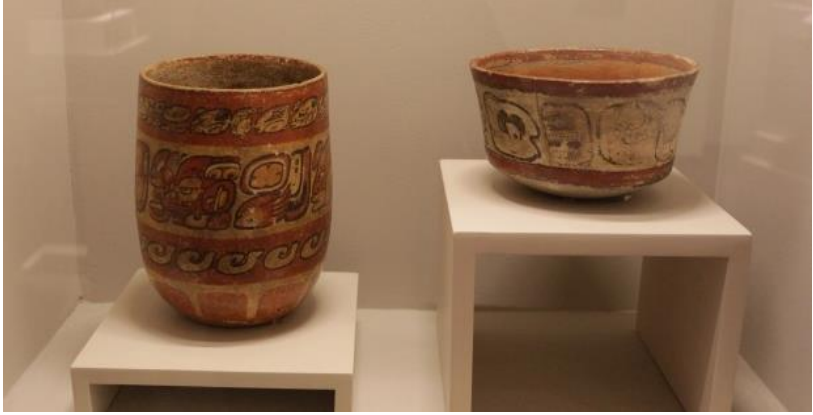
Görsel 3: Dekorlu maya kâseleri, Meksika Antropoloji Müzesi

Maya seramiği, vazolar, çanaklar, ritonlar, mühürler, ocaklar, tabaklardan müzik aletlerine uzanan zengin bir çeşitlilik gösterir. Seramik eserlerin çoğu geometrik motiflerle bezenmiştir. Ayrıca bu eserlerde hayvan ve insanların temsil edildiği görülmektedir. Kalınlıkları fazla olmayan ince ve simetrik tarzda yapılan Maya seramiklerini genellikle cilalı, çok renkli ve bazen de tek rengin çeşitli tonlarıyla renklendirme tekniği kullanılarak hazırlanmış oldukları göze çarpmaktadır. Genellikle açık fırınlarda 800 °C varan derecelerde pişirildiği bilinen seramik eserlerdeki süslemeler maya yazısı ile yazılmış metinleri, soylularla, askeri olaylarla ilgili sahneleri ve yöneticileri, doğaüstü yaratıkların betimlemeleri tasvir edilir. Sanat eserlerinden bazıları soylularla imzalanmış olup ittifakları güçlendirmek üzere hediye olarak ya da mezarlara bırakılan ev eşyası olarak kullanılmıştır. Mayalar tarafından üretilen ve müzelerde sergilenen eserler görsel olarak incelendiğinde normal üretimlerin yanında genel klasik çömlekçiliğin üzerinde işler olduğu görülmektedir. Dekorlar ve işçilikler çok net ve temiz, her biri kendi içerisinde görsel bir anlam, içsel bir anlatımın taşıdığı duygusunu uyandırmaktadır. Ayrıca formların zarif destekler, meme formunda, hayvan ayağı şeklinde bacaklara sahip olması ve formların yerden yükseltilmesi onlara farklı görünüm kazandırmıştır. (Görsel 4- 5)