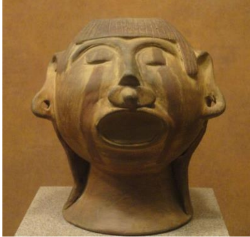
Görsel 1: İnsan başı formunda seramik kap, Meksika Antropoloji Müzesi

Meksika'da geleneksel seramik sanatının temelleri Maya kültürüne dayanmaktadır. Bilindiği gibi Mayalar' da seramik sanatının yanında heykel sanatının da güçlü ve etkili olmasından dolayı, aralarında etkileşimler olduğu görülmektedir. Bu nedenle Meksika seramikleri geleneksel kap kacak kapsamının dışında heykelsi görünüm veren unsurları da üzerinde taşımaktadır (Görsel 1).