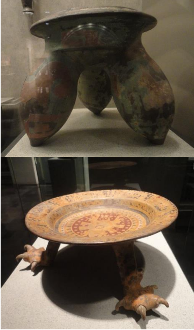
Görsel 4- 5: Farklı yapıda kap ayakları, Meksika Antropoloji Müzesi

Mayalar yaptıkları seramik formlar üzerine insan, hayvan figürlerini ve güncel olayları rölyef ve resimsel olarak işleyerek yerleştirmişlerdir. Günlük kullanım kap kacakları dışında anlam ve görevler yüklenen maya seramikleri, fantastik yaratıcılık örnekleri ile dekorlu kaplar, ritonlar,