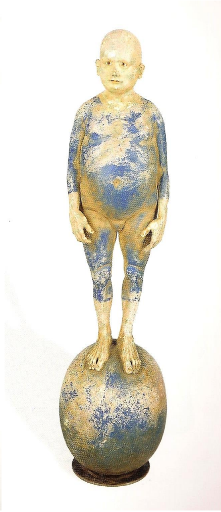
Görsel 14: Rosario Guillermo, 2011 (Terra Ardiente, Rosario Guillermo, Escultura, 2012 p:37)