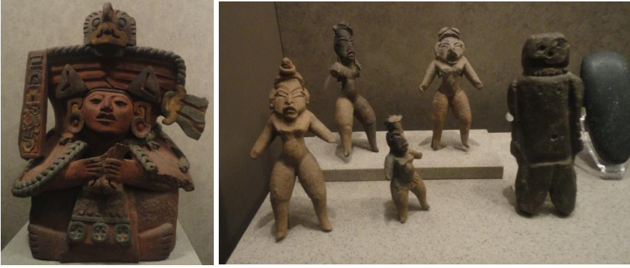
Görsel 10-11: Maya döneminden mikro seramik heykeller, Meksika Antropoloji Müzesi (Fotoğraf: Öznur Yıldırım)

Maya ve Aztek heykellerinin konusunu savaşı tasvirleri, yerel tanrıların portreleri, kuru kafalar, mitolojik hayvanlar oluşturmaktadır. “Bunlarda sembolik içerik o kadar açık değildir ama bunlarda karikatür duygusu ve neşeli ironiler ön plandadır.” (Rosario Guillermo, Brief Introduction to the History of Sculpture in Mexico s:34) İspanyolların Meksika’yı işgalinden sonra inançlarda da değişiklikler meydana gelmiştir. Dini liderler seramik heykellerin yerel dini imgelerin kil ile geliştirilmesini yasaklayarak kültürel ve dini kimliklerinin yok olmasına neden olmuştur. Bu durumda seramik heykellerin yapım etkinliğini azaltmıştır. 1890 yılından sonra Meksika’nın zengin kültürünün farklılığını özellikle seramik heykeller olmak üzere seramik heykel sanatının gelişmesini sağlamak için girişimlerde bulunulmuştur. Sanat atölyeleri kurulmuştur. “Bu atölyelerde o dönemi yansıtan çok renkli kil heykelcikler üretmişlerdir. Bu eserler XX. yüzyıl başladığında hala az da olsa üretilmekteydiler. Küçük boyutlarda ünlü insanların figürleri ve görevlilerin büstleri, “popüler tiplerin” figürleri seramik sırlar, oksitlerle süslenip, fırınlanmışlardır” (Rosario Guillermo, Brief Introduction to the History of Sculpture in Mexico s:34).