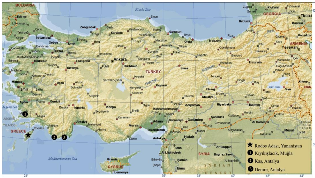
Şekil 1. Çalışma alanı

Ölçümlerde, ilgili vücut ve üreme organları kısımlarının adlandırılmasında Bolzern vd. (2013) takip edilmiştir. Metin içerisinde kullanılan tüm ölçümler milimetre cinsindedir.