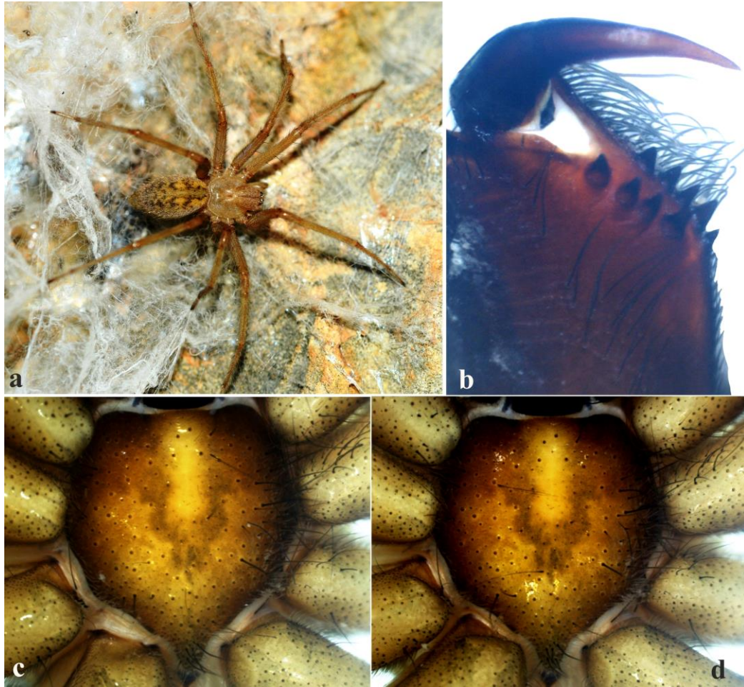
Şekil 2. Tegenaria vankeerorum a. Genel görünüş, erkek b. Keliser dişçikleri, dişi c. Sternum, erkek d. Önceki ile aynı, dişi

Ön ve arka vücudun renklenmesi gerek erkek gerekse dişi bireylerde tekdüze, yeşilimsi-kirli sarı. Karapaksın göğüs bölümünün kenar bölgeleri nispeten daha açık renkli. Labyum, gnathokoksa ve keliserler koyu kahverengi. Keliserlerin ön kenarında dört, arka kenarında ise dört ya da beş adet diş bulunmaktadır. Sternum kalp şeklinde, sarımsı-kahverengi. Orta bölgesinde V şeklinde çok belirgin olmayan bir leke mevcut. Bacaklar ince kahverengi siyah kıllarla kaplı. Bacak kısımlarının alt uç bölgeleri belli belirsiz daha koyu renkli. Bacak kısımlarının uzunluğu için Tablo 1'e; dikenlenmeleri için Tablo 2'ye bakınız. Abdomenin sırt kısmının ön tarafında birbirlerine simetrik siyahımsı noktalar; arka tarafında ise üç adet şerit deseni bulunmakta. Örü memeleri kahverengimsi.