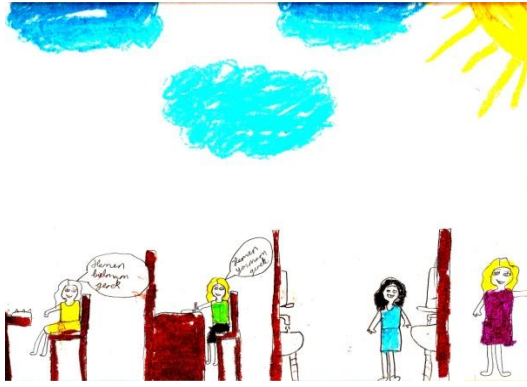
Resim 3: Berna'nın resmi

ETEKLERİ TUTUŞMAK Bir gün kalktım yataktan Birde baktım saate Çok geç kalmışım Müdüre beni aradı Banu kızda beni hemen Çağırdu sopayla Beni koştadı Bende bundan kaçtım Bardakla açmadım 10 gün sonra aradı İşe gelmemi söyledi