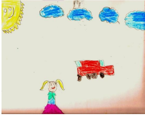
Resim 2: Melike'nin resmi

Eteklerimin tutuşuyor Otobüs geldi haberim yok Eteklerim tuttu hemen, Bir sağa baktım bir sola, Otobüs gitmiş haberim yok. Eyvah! okula geç kaldım, Hani babalığım tekrar bekle otobüsü. Eyvah! okuldan geldim. Ne de dinim anama babasına