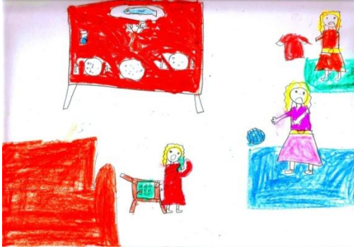
Resim 1: Rüya'nın resmi