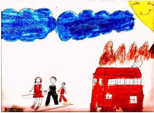
Resim 4: Mine'nin resmi

Öğrenci şiirlerinde yer alan oyun telaşı teması, oyuna dalmak ve eve ekmek almayı unutmanın getirdiği telaş olarak ifade edilmiştir. Resimde yer alan diğer bir tema trafik yoğunluğu telaşdır. Aşağıda bu temaya ilişkin öğrenci ifadelerinin yer aldığı resim ve şiir örneği verilmiştir.