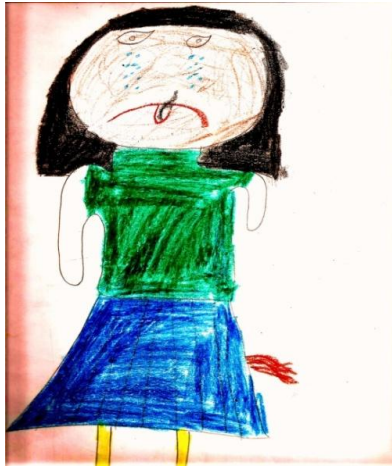
Resim 5: Fulya'nın resmi

Tablo 3 incelendiğinde, 13 öğrencinin şiirlerinde, 14 öğrencinin ise resimlerinde etekleri tutuşmak deyimini metaforik olarak ifade ettikleri görülmektedir. Öğrencilerden 2'si şiirini anneler günü nedeniyle deyim anlamı dışında kullandıkları için şiirleri anlatım biçimi açısından değerlendirmeye alınmamıştır. Öğrencilerden 2'si resminde deyim hem metaforik anlatımla hem de düz anlatımla ele almıştır. Bir öğrenci ise resimlerinde deyim yalnızca gerçek anlam biçiminde ifade etmiştir. Bir diğer deyişle, tüm öğrenciler şiirlerinde gerçek anlatımı hiç kullanmazken, yalnızca 3 öğrenci resminde deyim gerçek anlamını vermeyi tercih etmiştir. Aşağıda öğrencilerin anlatım biçimlerine ilişkin resim ve şiir örnekleri ile yapılan görüşmelerdeki ifadelerine yer verilmiştir.