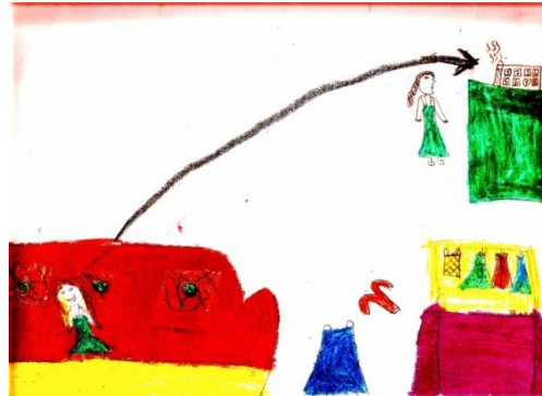
Resim 6: Banu'nun resmi

Resim 5'te görüldüğü gibi Fulya, eteğinin ucu yanan bir kız resmi çizerek etekleri tutuşmak deyimini gerçek anlamıyla açıklamıştır. Fulya'nın resmine ilişkin açıklamaları, "Benim resmimde kız var. Mesela şey böyle etekleri tutuşmakta, etek yaptım. Şey yani yanından tutuşuyor gibi. Kız ağlıyor, bacağı yanar diye. Acıdığı için dilinden dumanlar çıkıyor" (St:6.9-6.11) biçimindedir. Resim 6'da ise Banu, evde dağınık bir şekilde giysiler, koltukta bir çocuk ve ev sahibini çizerken ev sahibinin misafir telaşını anlatmış ve deyim