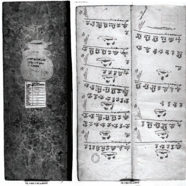
Ek-1 Evreçe Sayım Defterlerinin Kapak ve İlk Sayfaları.