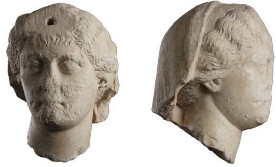
Fig. 6a-b. Aphrodisias Portresi (Smith 2006, lev. 61 / no. 80)

Portreler içinde irdelenecek en son eser, Aphrodisias'takidir 7 (fig. 6a-b). R.R.R. Smith 8 ve E. Bartman 9 tarafından Marbury Hall tipi içinde değerlendirilen portrede birkaç noktanın öne çıkarılmasında fayda vardır. Khiton ve himation giyimli, ayakta betimlenmiş bir heykele ait olan portrenin başı himation 'u ile yarıya kadar örtülmüştür. Başın üst kısmındaki delikten sonradan yapıлып takılmış olduğu anlaşılan nodus da şu anda kayıptır. Bu özelliği portrenin noduslu iki tipinden ya Marbury Hall ya da Fayum tipinden birisini temsil ettiğini düşünmemize olanak sağlar. Ancak bu iki tipi detayda birbirinden ayırmamıza olanak sağlayan nodusun kayıp oluşu, ayrıca başın örtülü olmasından dolayı arkasındaki saç düzenlemesinin bilinmemesi, sözü edilen tiplerden hangisini temsil ettiğini bildirmeyi olanaksızlaştırır.