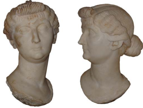
Fig. 3a-b. Ephesos/Yamaçevler Portresi

Ephesos Yamaçevler'de ele geçen Livia'nın büst şeklinde yapılmış portresi 3 (fig. 3a-b) aşağıya doğru daralan yüz şekli, hafif dışarı çıkıntılı çenesi, yüzün yumuşak dokusunda belli belirsiz hissedilen elmacık kemikleri, ince üst dudağa sahip ağız yapısı ve uzun burnu ile Marbury Hall tipi içinde değerlendirilmesine olanak sağlar. Diğer taraftan büyük gözleri ve kavisli kaşları, portreyi Fayum tipine yakınlştırır. Gıdığı ise her iki tipe göre de daha dolgun olarak gösterilmiştir. Ancak (profilden bakıldığında) yüzün şeklinin belirlenmesinde asıl önemli özelliklerin Marbury Hall tipinden almış olması, bu tipe daha yakın durmasına olanak sağlar.