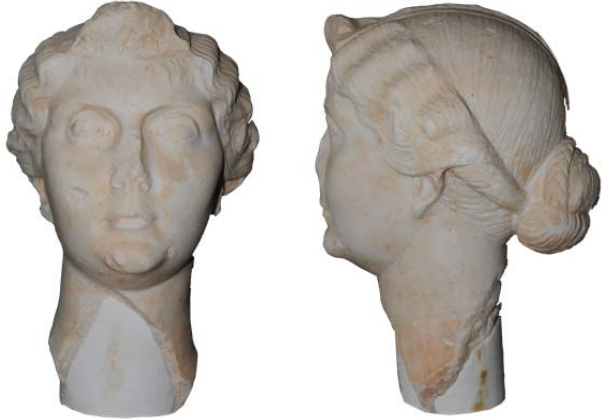
Fig. 5a-b. Bodrum Sualtı Arkeoloji Müzesi

Ephesos'taki diğer örnek ise Yukarı Agora'da bulunmuş khiton ve himation giyimli Livia heykeline aittir 4 (fig. 4a-b). Livia'nın yüzünün ovaliği, çenesinin kısıklığı, kavisli kaşları, büyük gözleri, belirgin elmacık kemikleri ve küçük ağzı, Fayum tipi ile benzerlikler içinde olduğunu kanıtlar. Ancak yüz ile ilgili bir noktanın üzerinde durulması gerekir. Portre küçük ağzı ile her ne kadar Fayum tipine benzerlik gösterse de, dudaklarının kalınlığı ve aralarının açıklığı Fayum tipinde rastlanılmayan unsurlardır 5 . Portrenin