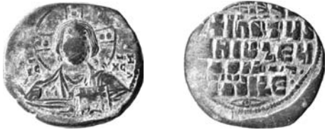
Resim 5. Kat.no.: 40, A2 Sınıfı, Var.24