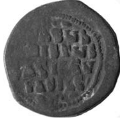
Resim 13. Kat.no.: 116, A2 Sınıfı, Var.48