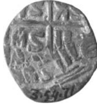
Resim 17. Kat.no.: 252, B Sınıfı