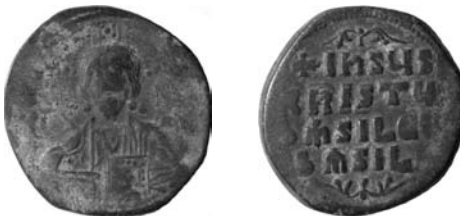
Resim 7. Kat.no.: 57, A2 Sınıfı, Var.39