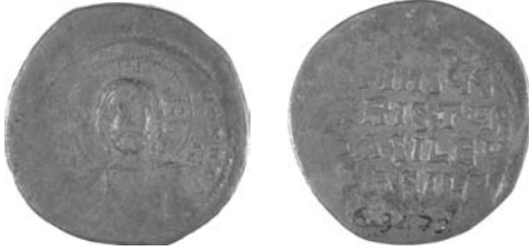
Resim 1. Kat.no.: 1, A1 Sınıfı