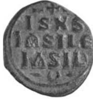
Resim 21. Kat.no.: 425, D Sınıfı