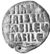
Resim 11. Kat.no.: 92, A2 Sınıfı, Var.45