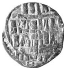
Resim 15. Kat.no.: 236, B Sınıfı