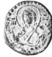
Resim 22. Kat.no.: 448, G Sınıfı