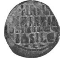
Resim 10. Kat.no.: 91, A2 Sınıfı, Var.43