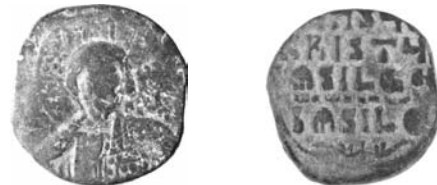
Resim 8. Kat.no.: 68, A2 Sınıfı, Var. 40a