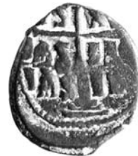
Resim 16. Kat.no.: 251, B Sınıfı