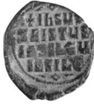
Resim 9. Kat.no.: 76, A2 Sınıfı, Var.41