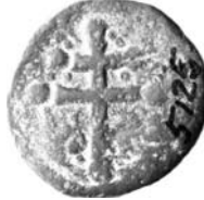
Resim 23. Kat.no.: 455, H Sınıfı