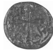
Resim 24. Kat.no.: 462, I Sınıfı