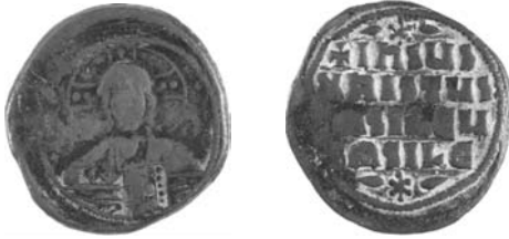
Resim 3. Kat.no.: 32, A2 Sınıfı, Var.21