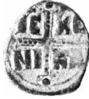
Resim 19. Kat.no.: 359, C Sınıfı