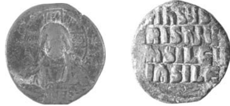
Resim 4. Kat.no.: 36, A2 Sınıfı, Var.24