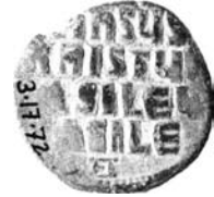
Resim 12. Kat.no.: 115, A2 Sınıfı, Var.47