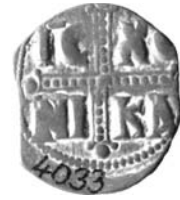
Resim 20. Kat.no.: 380, C Sınıfı