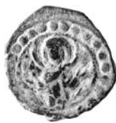
Resim 25. Kat.no.: 464, K Sınıfı