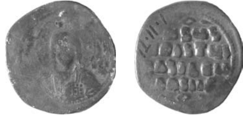
Resim 2. Kat.no.: 24, A2 Sınıfı, Var.14