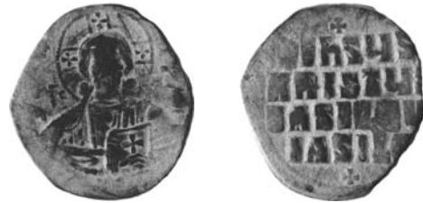
Resim 6. Kat.no.: 55, A2 Sınıfı, Var.32