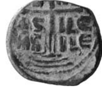
Resim 18. Kat.no.: 286, B Sınıfı