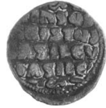
Resim 14. Kat.no.: 121, A2 Sınıfı Var.50