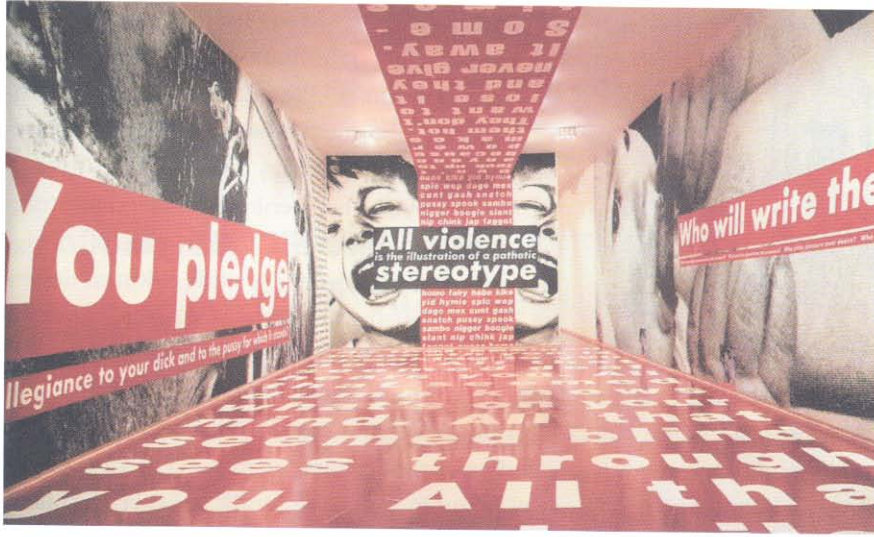
Barbara Kruger Enstalasyon Art at The Turn of The Milenyum, sayfa 291.

sili yapılardan oluşursa yapaylık ve basit bir aktarmadan öte geçemez. "Modern sanat, sanatın başlangıç noktasındaki bilgi gerçekliği ile kurduğu sorunlu bir ilişkinin içinden türemiştir. Bu ilişkinin en önemli olguları arasında yansılama (mimesis) sorunu gelir. Doğanın doğrudan tuvalde yansıtılması olarak beliren ve ona yönelimle ortaya çıkan sanat yapıtı modernitenin bir üst bilinç konumuna yükselmesiyle birlikte doğadan uzaklaşmaya ve kendi içinden türemeye koyulmuştur. Artık bir doğal gerçekliğe yönelmeksiz ve onun eğretilmesi üstünden geçilerek kurulmayan sanat yapıtı kendi kendisinin hem nesnesi hem de öznesi olurken bir aşkınsal boyut kazanmıştır" (Kahraman, 2005, s.208). Modern zamanlardaki bu aşkınsal boyut, modern zamanların sanatçısının dünyasında karmaşık zihinsel bir coğrafya yaratmıştır.