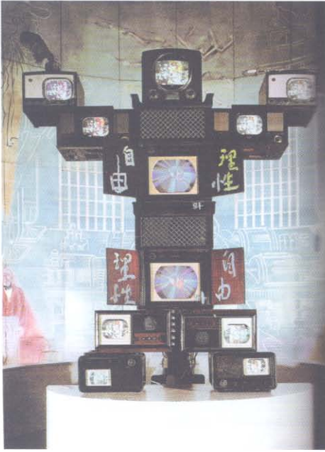
Nam June Paik Voltaire, Video Heykel, 300x200x55 cm. Art of the 20th century, sayfa 576.

biçimleriyle sanatçının sınırsız anlatım dilinin ortak bir noktada buluşmasından kaynaklanmaktadır.