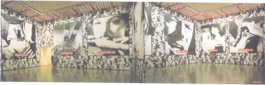
Barbara Kruger Enstalasyon Untitled, Fotografik Baskı Art of The 20 th century, sayfa 612.

sili yapılardan oluşursa yapaylık ve basit bir aktarmadan öte geçemez. "Modern sanat, sanatın başlangıç noktasındaki bilgi gerçekliği ile kurduğu sorunlu bir ilişkinin içinden türemiştir. Bu ilişkinin en önemli olguları arasında yansılama (mimesis) sorunu gelir. Doğanın doğrudan tuvalde yansıtılması olarak beliren ve ona yönelimle ortaya çıkan sanat yapıtı modernitenin bir üst bilinç konumuna yükselmesiyle birlikte doğadan uzaklaşmaya ve kendi içinden türemeye koyulmuştur. Artık bir doğal gerçekliğe yönelmeksiz ve onun eğretilmesi üstünden geçilerek kurulmayan sanat yapıtı kendi kendisinin hem nesnesi hem de öznesi olurken bir aşkınsal boyut kazanmıştır" (Kahraman, 2005, s.208). Modern zamanlardaki bu aşkınsal boyut, modern zamanların sanatçısının dünyasında karmaşık zihinsel bir coğrafya yaratmıştır.