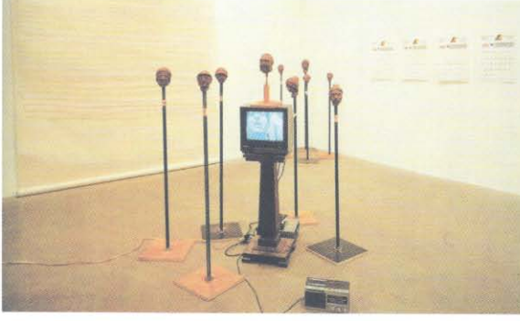
Sean Landers Enstallasyon Art at The Turn of The Milenyum, sayfa 299.