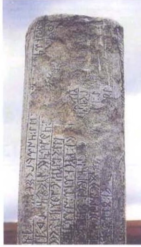
Tonyukuk Abidesi www.dilimiz.com