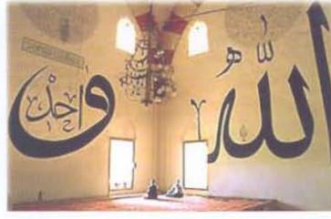
Edirne Eski Camii