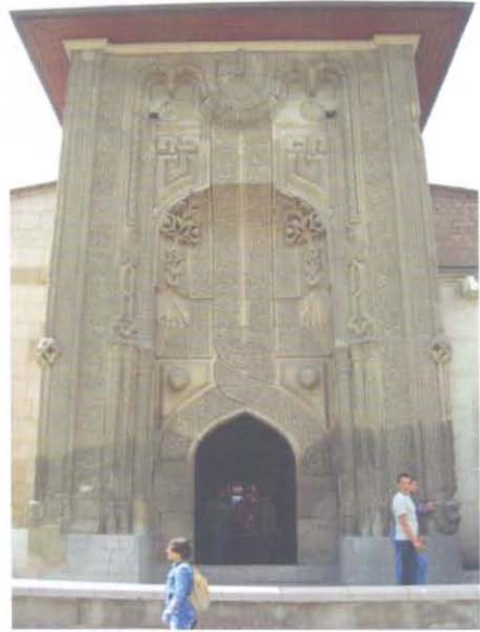
Konya İnce Minareli Medrese www.ikiteker.org