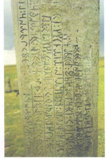
Tonyukuk Abidesi www.dilimiz.com

lar. Bu yüzden yazının basit, kolay ve çabuk yazılabilir olması önem kazanır. Hiyeroglif yazı, bu özelliklere sahip olmadığı için terkedilir. Sümer ve Akad'ların buldukları çivi yazısı, yuvarlak uçlu çelik kalemlerle yumuşak bir malzeme olan kil tabletler üzerine yazılır. Bu sayede köşeli formlar meydana getirilerek taş üzerine daha kolay uygulanır formlar ortaya çıkar. Fenikelilerin, konuşma diline tamamen uyan yeni bir yazı biçimini bulmasıyla, yazı Asur-Mısır-Roma'da olduğu gibi büyük ve gösterişli anıtlarda değil, mezar taşları üzerinde simgeler şeklinde kullanılır hale gelir. İslam mimarisi ve yazısı ise, Hindistan, Orta Asya, İran, Mezopotamya, Filistin, Kafkasya, Anadolu, Balkanlar, İspanya, Tunus, Cezayir ve Fas'ı içine alan çok geniş bir alanda kendini gösterir. Büyük hamamlar, hanlar, pazarlar, köprüler, camiler, minareler, kümbetler, saraylar inşa edilerek yazılarla süslenir.