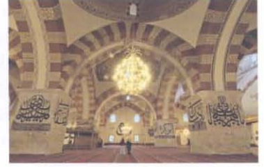
Edirne Eski Camii

tirilip bitştirilmemesiyle, bazı işaretlerin kullanılıp kullanılmamasıyla ayrılır. Kufi yazı türü geometrik süslemeye çok uygun olduğundan, özellikle mimari eserlerin süslemesinde Mimar Sinan dönemine kadar kullanılır. Kur'an'ın daha seri yazılması gerektiği durumlarda nesih tercih edilirken, çok uzaktan okunacak büyüklükte yazılması gereken cami kubbelerinde, duvarlarında, mihrap ve kapı üstlerinde sülüs ve talik türünde yazılar uygulanır.