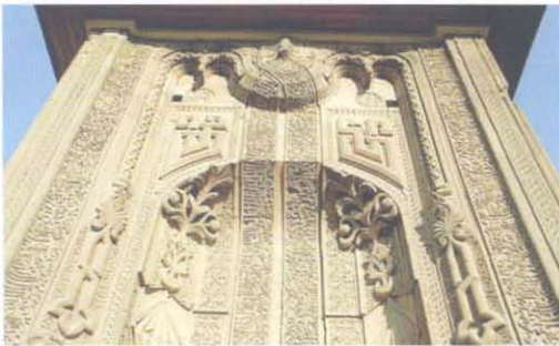
Konya İnce Minareli Medrese www.motorand.com/gezilerimiz

İslam inançlarına göre özünde yatan anlam bakımından, kutsal bir niteliği olan yazı, dinsel geleneklerden ötürü resim kullanımının sınırlı olması nedeni ile, süslemelerde ve dekoratif öğelerde uzun süre ve ağırlıklı olarak kullanılmıştır. Yazıya verilen bu değer, bütün İslam kültürlerinde hat'ın "Kutsal Sanat" sayılmasına aracılık eder. Ahşap oymalarda, binaların cephelerinde ve kapılarında, camilerde Kur'an'dan alınmış hadis ve ayetlerde süslemenin ana ögesidir. Hat sanatında her yazının kendine özgü kuralları, incelikleri ve özellikleri vardır. Çeşitli yazı türleri birbirinden, büyüklük - küçüklükleri ile, biçimleri ile, aralıklarıyla, birbirine bitiş-