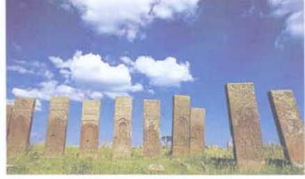
Ahlat (Bitlis) Mezar Taşları www.e-tarih.org