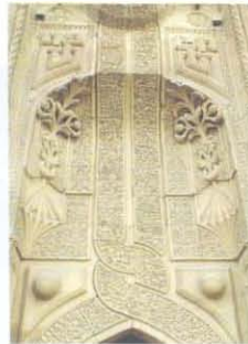
Konya İnce Minareli Medrese www.cromwell-intl.com/travel