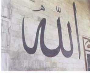
Edirne Eski Camii