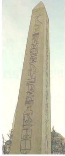
Dikilitaş, İstanbul