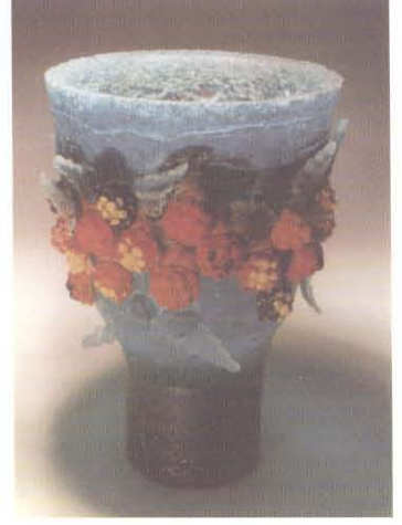
Resim 7. Pate de Verre Dekoratif Kalıp, 1996, Yük. 20 cm.