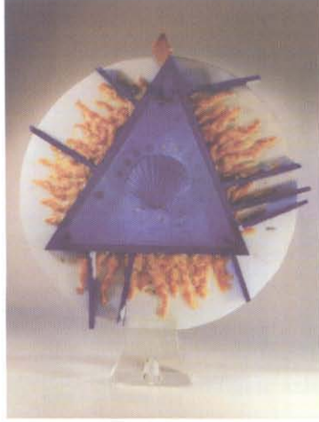
Resim 6. Tanrının Gözü, 1994, Yük. 47 cm.