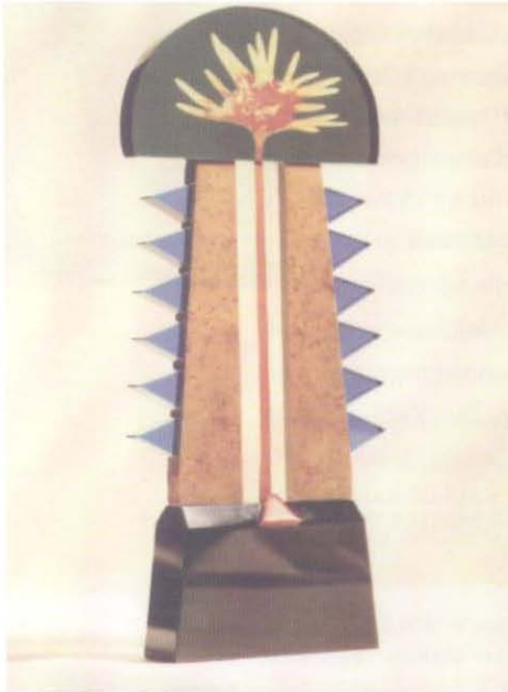
Resim 2. Amerika I. 1989. Yük. 42 cm.

1989 yılına gelindiğinde sanatçımız monoton ve evrensel şekilde uygulanan optik cam renk şemasından sıkılmış olacak ki 'Amerika' (Resim 2) adını verdiği çok bileşenli bir seri iş ortaya koymuş. Amerika'nın