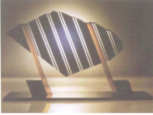
Resim 3. Bulut, 1991, Yk. 18 cm.