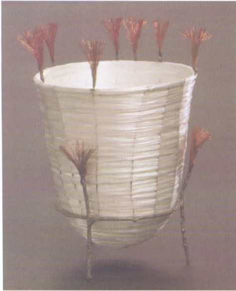
Resim 8. Dekoratif Form 2007. Yük. 18 cm.

1993-1999 yılları arasında sanatçı 'Pate de Verre' tekniği ve deneyim kazandığı kalıplarda eritilmiş cam tekniğini sentezleyerek çeşitli eserler ortaya koymuştur. 'Pate de Verre Decorative Mold' serisi (Resim 7) bu tür çalışmalardan oluşur. Sanatçının bu çalışmaları gerçekleştirirken karşılaştığı temel problem, dekorasyonunun çanağı saran kabartmalarla nasıl yapılacağı olmuştur. Kalıp nasıl çıkartılmalı, hangi sıcaklıkta eritilmeli, kabartmalar kalıptan zarar görmeden nasıl alınmalıdır? Arzu edilen sonuca çeşitli denemelerden sonra ulaşılmıştır.