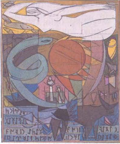
Tanrıça, Yağlıboya, 1991.