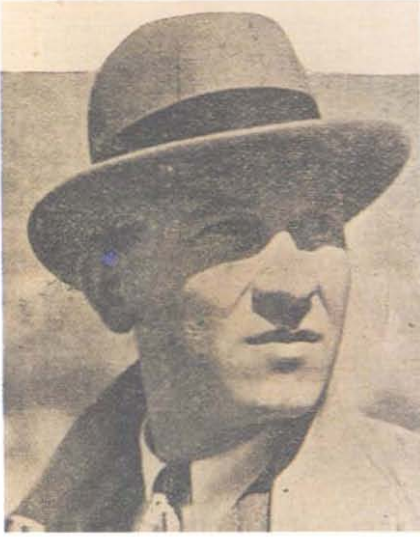
1. İhap Hulusi Görey (1935).