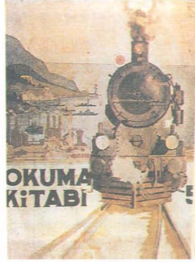
6. Okuma Kitabı Kapağı (1930).