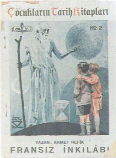
7. Kitap Kapağı.