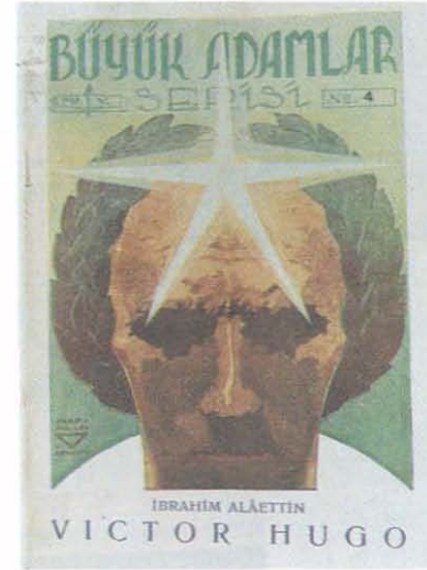
8. Kitap Kapağı (1935).