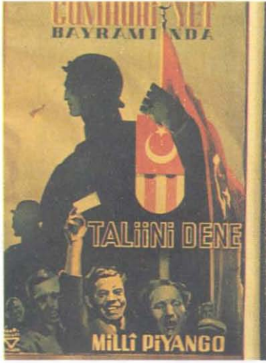
Milli Piyango Afişi.