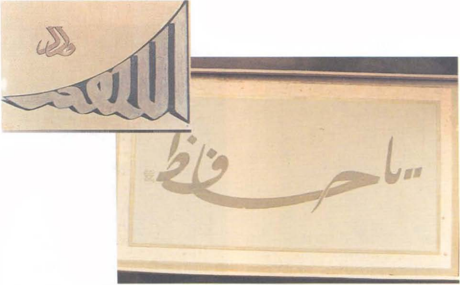
3-4 Hat Çalışmalarından, (Yavuz Görey Koleksiyonundan).