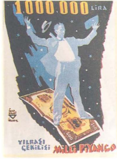
10. Milli Piyango Afişi .