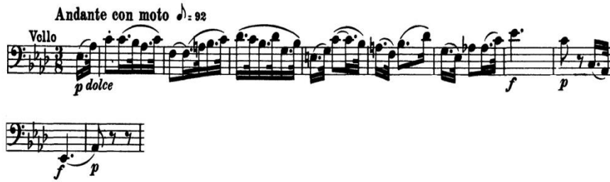
Şekil 5. L. v. Beethoven Senfoni No. 5, Op. 67, Do Minör, 2. Bölüm, Andante con moto , 1. ve 11. Ölçüler Arası

piano , boşluktan sonra telin üzerinde kalarak kol ağırlığının azaltılması ile yapılır. Subito forte ise, kol ağırlığının bir anda bırakılması ve yayın, telin içine girmesi ile sağlanır. 2