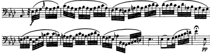
Şekil 8. L. v. Beethoven Senfoni No. 5, Op. 67, Do Minör, 2. Bölüm, Andante con moto , 114. ve 124. Ölçüler Arası