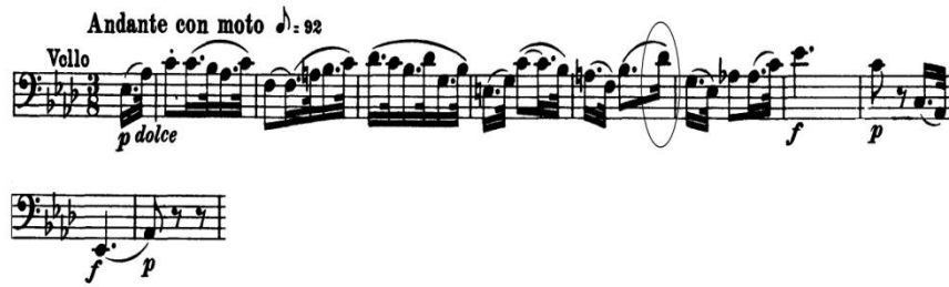
Şekil 1. L. v. Beethoven Senfoni No. 5, Op. 67, Do Minör, 2. Bölüm, Andante con moto, 1. ve 11. Ölçüler Arası

Temada karşılaşılan ritmik yapı (1 ve 11'inci ölçüler arası), çoğunlukla bağ içerisinde yer alan noktalı onaltılık ve otuzikilik notalardan oluşur. Ritmin doğruluğuna özellikle önem vermek gerekir. Temadaki tek ritmik fark, beşinci ölçünün son notasının onaltılık olmasıdır. Bu notanın, diğer gelen otuz ikilik notalardan farklılığının belirtilmesi ve öne çıkartılması gerekir. (Bkz. şek. 1)