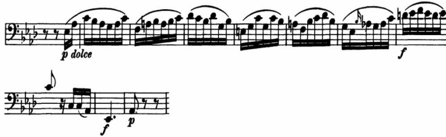
Şekil 6. L. v. Beethoven Senfoni No. 5, Op. 67, Do Minör, 2. Bölüm, Andante con moto , 49. ve 60. Ölçüler Arası

İkinci çeşitlemeye baktığımızda ise, piano dolce karakteri tel değişimi hareketleri ile canlılık kazanmaktadır. Ancak, piano nüansını 105. ölçüye kadar koruyup aniden pianissimo nüansıyla cümlenin sonlandırılması gerekmektedir. (Bkz. şek. 7) Bu arada üflemeli çalgılarda çalınan temayı dinlemek, bu çeşitlemenin çalımında kolaylık sağlar. Çeşitleme boyunca karşılaşılan tel geçişlerinde dikkat edilecek nokta, yayın geçilecek tellere ufak hareketlerle yaklaşılmasıdır. Bu yolla çeşitleme daha da kolay çalınabilir hale gelir.