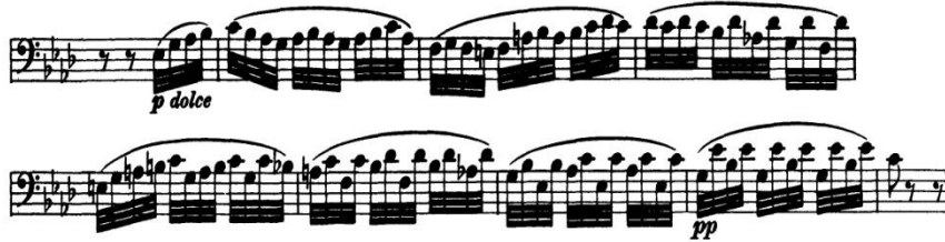
Şekil 3. L. v. Beethoven Senfoni No. 5, Op. 67, Do Minör, 2. Bölüm, Andante con moto , 98. ve 107. Ölçüler Arası

İkinci çeşitlemede, (98 ve 107'nci ölçüler arası) güçlü zaman ve zayıf zaman prensibi göz önünde bulundurularak diğer çeşitlemelerde olduğu gibi, birinci vuruşların yüksek çalınmasına dikkat edilmeli ve bu ölçü karakteri, cümlenin sonuna kadar korunmalıdır. Ayrıca sol el artikülasyonuna ve de legato karakterini korumak için, tel değişimlerinin yumuşaklığına dikkat edilmelidir. Tel değişimleri, ritim içerisinde bir sonraki gelecek tele yaklaşarak, küçük sağ kol hareketleriyle yapılmalıdır. (Bkz. şek. 3)