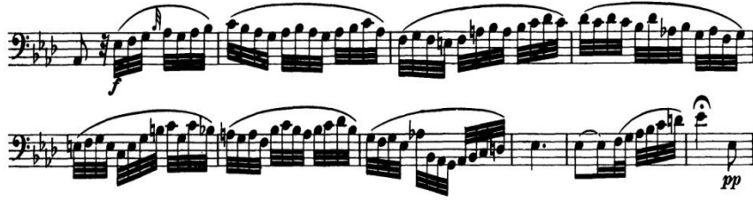
Şekil 4. L. v. Beethoven Senfoni No. 5, Op. 67, Do Minör, 2. Bölüm, Andante con moto , 114. ve 124. Ölçüler Arası