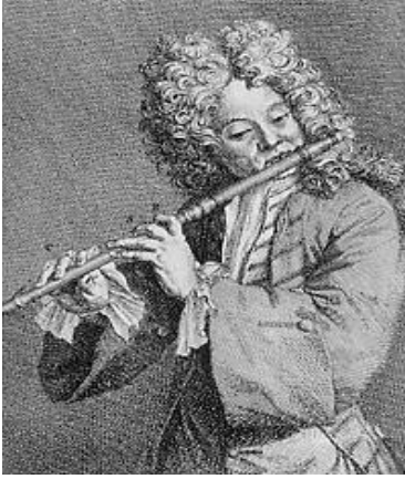
Resim-2: Flüt Tutuş Pozisyonu

Birinci bölümde vücut duruşu ve ellerin pozisyonu hakkındaki fikirlerini yazan Hotteterre, usta bir yorumcu olabilmek için duruşun önemini vurgulamış ve olması gerekenleri şöyle açıklamıştır;