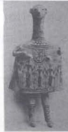
Fotođraf 5: Çan gövdeli figür. M.Ö. 8.yy Boeotia. [Higgins 1967 : 9]

Çan gövdeli, tornada řekillendirilerek yapılan, üzeri astarlanarak dekorlanmış figürler (bebek figürleri), adak figürinleri içinde en ilginçlerinden sayılır. Bu figürinler, dini bir tören sırasında ağaçlara asılmaları düşünülerek yapılmaktadır. Ağaçlara asılan bu bebeklerin arındırıcı olacađı düşüncesi vardır. "Bahar řenliđinin son gününde Dionysus'un onuruna Atina'da 'Anthesteria' adı verilen bir tören yapılırdı. Bu törende yapılan adak figürleri, (bebekler) ağaçlara asılırdı. Bebeklerin sallanmaları (aiora) bir arındırıcıydı. Bebekleri asanların günahlarının temizleneceđine inanılırdı." (Webster 1950 : 14) (Fotođraf 5)