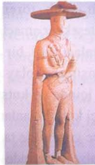
Fotoğraf 2: Capestiano savaşçısı. M.Ö. 6.yy'la ait olan bu terrakotta bir mezar dikiti olarak yapılmıştır. [Carratelli 1996 : 596]

Form olarak terrakotta figürinler bazen tanrı ve tanrıça olarak, bazen hastalıklı organların maketi olarak, bazen de yaşarken sevilen şeylerin canlandırıldığı figürinlerin varyasyonları olarak karşımıza çıkmaktadır. Mezarlara kişilerin yaşarken yapmayı sevdiği şeylerin terrakotta tasvirleri konularak, öldükten sonra da bunlardan zevk almayı sürdürmesi düşünülmüştür. Eğer bir askerse, süvari; marangoz ise bir marangoz figürini; yada en sevdiği hayvan gibi pek çok farklı şey mezarda kişiyle birlikte gömülmektedir. (Fotoğraf 2)