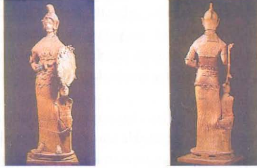
Fotoğraf 1: Lavinio'dan büyük boy Athena heykeli. [Carratelli 1996 : 610]

Tapınaklara adanan terrakota figürinlerin konuları ne olursa olsun, bunlar tanrı ve tanrıçalara adanmaktadır. Örneğin "bu heykelcikler genellikle Demeter, Persophone, ve Dionysos gibi, ölümden sonraki yaşantıyı sağlayacak olan tanrı ve tanrıçalara adanmıştır." (Richter 1979 : 192)