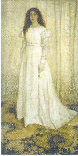
James Whistler, Beyaz Senfoni, 1862 http://artchive.com/artchive/ W/whistler/whistler_ white_girl.jpg.html

konuda fazla tartışma zemininin de olduğu söylenemez. Sanatın kavramsal düzeyde netleşmesi ve buradan hareketle spesifik alanlarda irdeelenmesi gerekir.