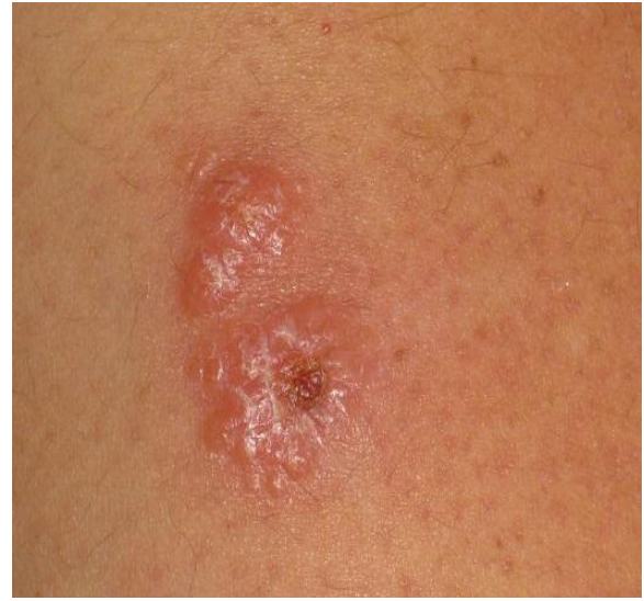
Resim 2. Sol koldaki lezyon Figure 1. Lesion of left arm