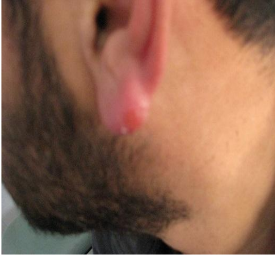
Resim 3. Sol kulak memesindeki lezyon Figure 3. Lesion of left ear lobe