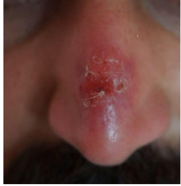
Resim 1. Burundaki lezyon Figure 1. Lesion of nose

Mersin Devlet hastanesi Dermatoloji Kliniğine Şubat 2013 tarihinde, 30 yaşındaki bir erkek hasta, burun sırtı, sol kol ve sol kulak memesi olmak üzere üç ayrı vücut bölgesinde bulunan yara şikayeti ile başvurdu (Resim 1,2,3). Hastanın gübre çuvalı taşıdığı, yaraların 3 aydır mevcut olduğu anamnezinde kaydedildi. Kutanöz leishmaniasis ön tanısı konan hastanın burun sırtındaki, sol kol ve kulak memesindeki eritemli, ödemli plak tarzındaki lezyonlu deriye ait biyopsi materyalinde keratinize çok katlı yassı epitel altında, yüzeysel dermisten subkutan yağ dokusuna kadar uzanan yoğun histiosit ve lenfosit infiltrasyonu izlendi. Biyopsi materyalinden yapılan Giemsa boyalı yaymaların mikroskopik incelemesinde, hem ekstrasellüler, hemde intrasellüler yerleşimli amastigot formlar tespit edildi (Resim 4). Laboratuvar incelemelerinde Hb: 11.22 g/dl, beyaz küre sayısı 5500/mm 3 , trombosit sayısı: 255000/mm 3 , eritrosit sedimentasyon hızı: 10 mm/saat, C-reaktif protein düzeyi: 4.47 mg/L bulundu. Hastanın tedavisi için glucantime (1.5 gr/5 ml) küçük lezyonların içine 0.40 ml, büyük lezyonların içine 1 ml olmak üzere 2 gün ara ile 2 kez enjekte edildi.