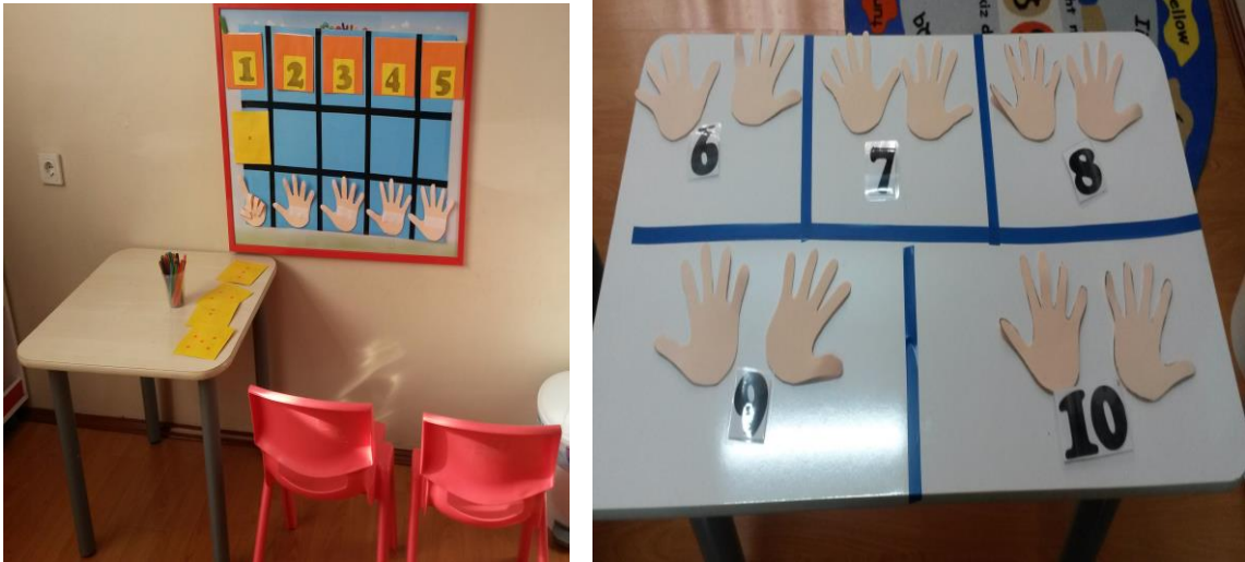
Resim 1. Sayı eğitim materyalleri: Soldaki resimde sayı sayma ile materyal, çocukların bu materyalde deneyim kazanmalarının ardından zorlaştırmak amacıyla sayılar büyütülerek yeni bir eğitim materyali olarak çocuklara sunulmuştur.

Bununla birlikte araştırmada TEMA-3 testinin boyutları dikkate alınarak eğitim materyallerinin geliştirilmesinde sayı ve işlemler üzerine odaklanılmıştır. Araştırma sürecinde sayı ve işlemler ile ilgili eğitim materyalleri deney grubu öğretmeni ve araştırmacılar tarafından hazırlanmıştır. Araştırmada, deney grubunun öğretmenine sayı ve işlemlere yönelik oluşturulacak materyallerle ilgili bir günlük eğitim verilmiştir. Bu eğitimde çocukların ihtiyaçları doğrultusunda örnek etkinlik ve materyaller gösterilmiştir. Araştırma sürecinde sayı ve işlemler ilgili eğitim materyalleri öğretmen ve araştırmacılar tarafından geliştirilmiştir. Geliştirilen bu materyaller uygulama süreci içerisinde çocukların becerilerindeki ilerlemeleri ve materyale karşı olan ilgileri dikkate alınarak basitten karmaşığa doğru tekrar gözden geçirilerek yeni bir eğitim materyali olarak çocuklara sunulmuştur. Bu duruma ilişkin eğitim materyalleri örnekleri Resim 1 ve Resim 2’de gösterilmiştir.