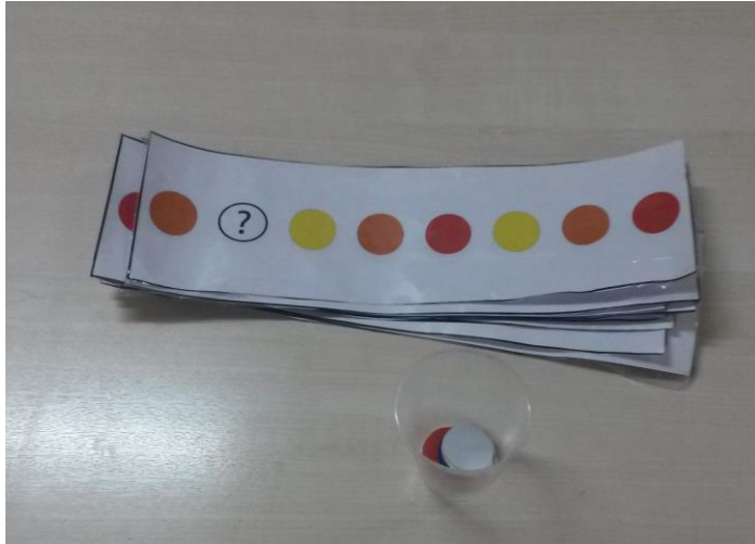
Resim 2. Örüntü eğitim materyalleri: Bu materyalde tamamlanacak örüntü materyali iki boyutlu hale getirilmiş ve örüntüde yer alan nesne sayısı artırılarak zorlaştırılmıştır.