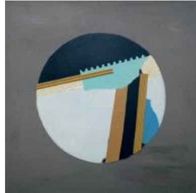
Resim 5. Öğrenci Çalışması

Eskişehir Kent Belleği Müzesi'ndeki fotoğraf ve belgesellerden yola çıkarak sanatsal çalışma (Resim 6) gerçekleştiren bir başka öğrenci ise bu uygulamada kültürel bir sorgulama