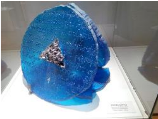
Resim 4. Fatma Çiftçi, 'Inconsolable'

“Sanatsal çalışmamda çıkış noktam, Fatma Çiftçi'nin 'Inconsolable' adlı eserinin (Resim 4), biçim, renk ve eserinde kullandığı imgeleridir. Eserde yuvarlak bir camın ortasında kurşun döküm bulunmaktadır. Bu kurşun imgesini sanatsal çalışmamda kullandım. Inconsolable eserindeki cam mavi olduğu için ben de çalışmamda mavi ve tonlarını içeren renkler kullandım. Ayrıca eserin üzerinde bulunan yazı imgelerinden yola çıkarak kolaj tekniğini kullandım ve çalışmamı yazı içeren malzemelerle destekledim. Böylece daha zengin bir görünüm kazanmış oldu”