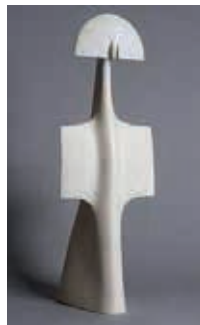
Resim3: Ruth DUCKWORTH