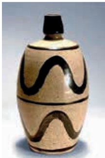
Resim2: Bernard LEACH