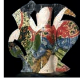
Resim10: Betty WOODMAN

Postmodern sürecin içerisinde önemli eğilimlerden biri olan kavramsal sanat, seramik sanatını etkilemesi açısından yukarıda bahsettiğimiz renk ve biçim anlayışının farklılık göstermesine sebep olmuştur. 1960'lı yıllardan itibaren Seramik sanatçılarınin seramiğe kattıkları kavramsal yorumlarla birlikte seramik sanat anlayışı geleneksel ya da işlevsel çömlek anlayışından farklı bir boyut kazanmış, sanat tarihsel süreç içerisinde kuralsal ve standart yorumları terk ederek günümüz sanat anlayışında özgün yorumlarla yerini almıştır.