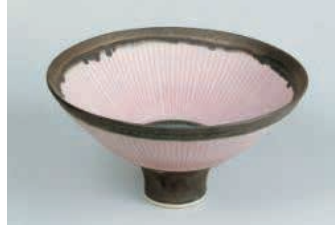
Resim6: Lucie RIE

Daha sonraları Miro, Picasso, Leger gibi modern resim sanatının ressamı tarafından da kullanılan seramik, artık herkes tarafından kabul gören bir ifade aracı olmuştur.