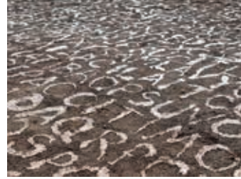
Resim24-25: Clay Words ,Pekka pekkari