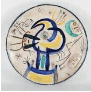
Resim7: Seramik Tabak, Miro, 1956

Daha sonraları Miro, Picasso, Leger gibi modern resim sanatının ressamı tarafından da kullanılan seramik, artık herkes tarafından kabul gören bir ifade aracı olmuştur.