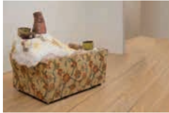
Resim31-32: Loveseat and Bowls, Jessica Jackson Hutchins, 156.2 x 105 x 133.4 cm, 2008