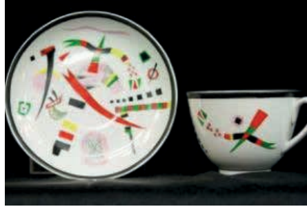
Resim8: Seramik Fincan ve Tabak, Kandinsky, 1923