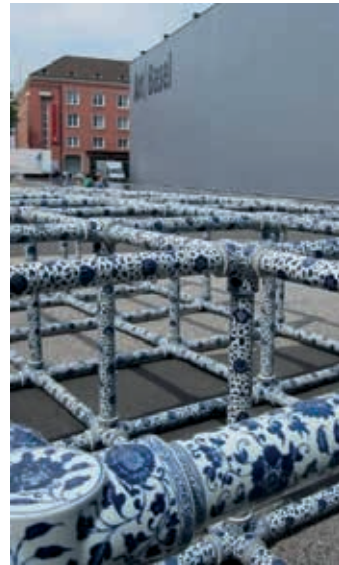
Resim26: Field, Ai Weiwei