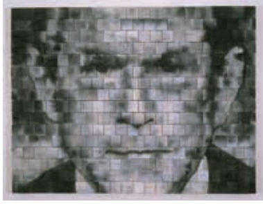
Resim28: All Nations Have Their Moment of Foolishness Richard Notkin, 2006