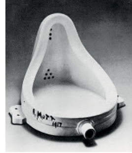
Resim1: Çeşme Marcel Duchamp, 1917

“Yapıtlarıyla kavramlar ve analizler öneren bu sanatçılar, seyirciyi bunları anlamaya, çözmeye, kendi düşüncesiyle tamamlamaya çağtırlar (Germaner, 1997: 48) ”.