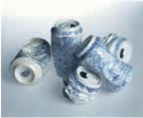
Resim30: "5", Xue Lei, 2007

Jessica Jackson Hutchins' in çalışmalarına baktığımızda ise seramik sanatındaki geleneksel estetik anlayışının sert bir eleştirisinin yapıldığını görmekteyiz. Sanatçının yapmış olduğu seramik formlar genel estetik anlayışından uzak simetrik olmayan ve düzgün sırlanmayan formlar olarak karşımıza çıkmaktadır. Yapmış olduğu formların galerilerde yani eleştirdiği kurumlarda sergilenmesi ise işlerindeki ironiyi açıkça ortaya koymaktadır.