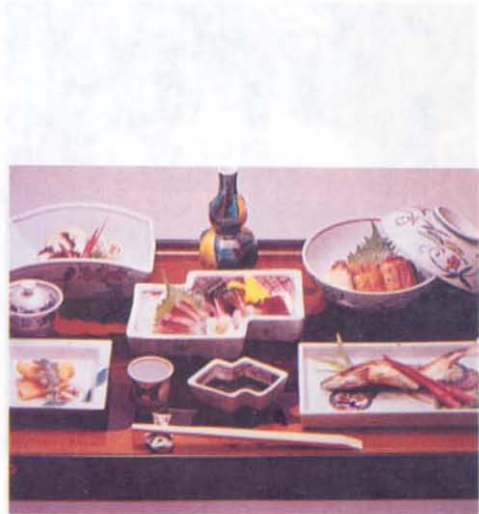
Resim 11— Damak zevkinden çok göz zevkine önem veren japonların Kutani seramikleri ile oluşturulmuş sofrı düzeni.