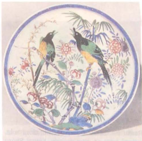
Resim 5— Kuş desenli, Ko-Kutani seramiği Edo devri, 17. yüzyıl. Tokyo Milli Müzesinde.