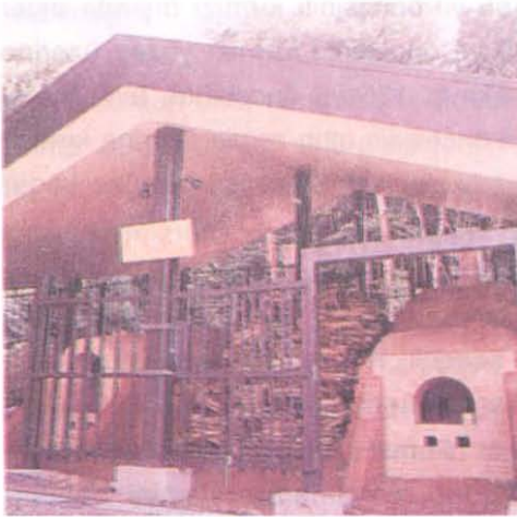
Resim 2— Kutani seramiklerinin pişirildiği Nabori fırını, Utatsuyama Crafts workshop'da.