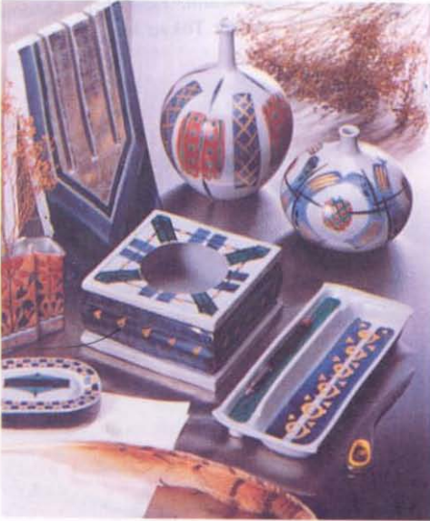
Resim 10— Büro elemanı olarak düşünülmüş farkı Kutani seramikleri.