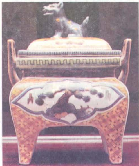
Resim 6— Bonsai desenli tütsü kutusu. Kutani seramiği