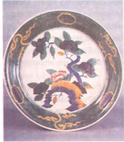
Resim 3— Eski Kutani diye bilinen Kamelya desenli geniş tabak. 17. yüzyıl Edo devrine ait, Tokyo Milli Müzesinde

yılında bu amaçla açılan Utatsuyama Craft Workshop ve Kutani teknik araştırma enstitüsü faaliyetlerini yoğun bir biçimde sürdürmektedir. Böyle bir destek ve teşvik ile Kutani seramikleri gelişmeye devam edecek Japon seramiği içindeki yerini ve ürünü koruyacaktır.