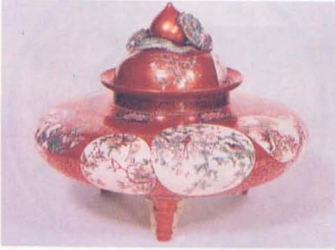
Resim 8— Çiçek ve kuş desenli, tüsü kabı, sırüstü boya ve altın dekorlu. Kutani Shōza tarafından yapılmıştır, 1878'de.