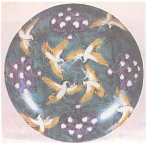
Resim 4— Turna kuşu desenli Ko-Kutani denilebilen eski Kutani tabak, 17. yüzyıl