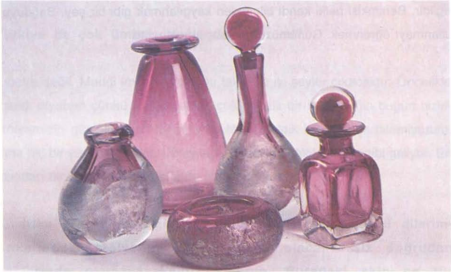
Fahri KAPLAN Atölyesinden üç örnek