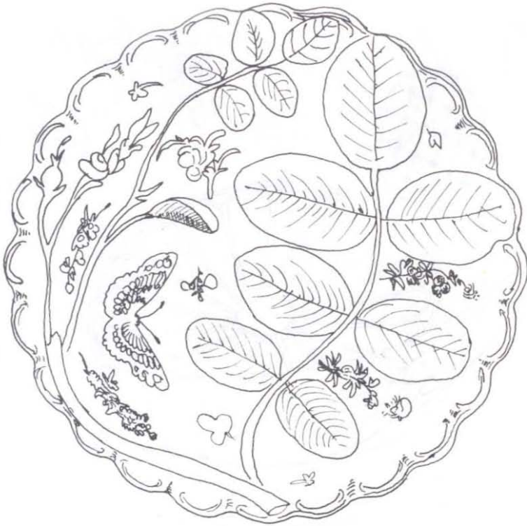
Şekil: 4 "Kör Earl" tarzı tabak.