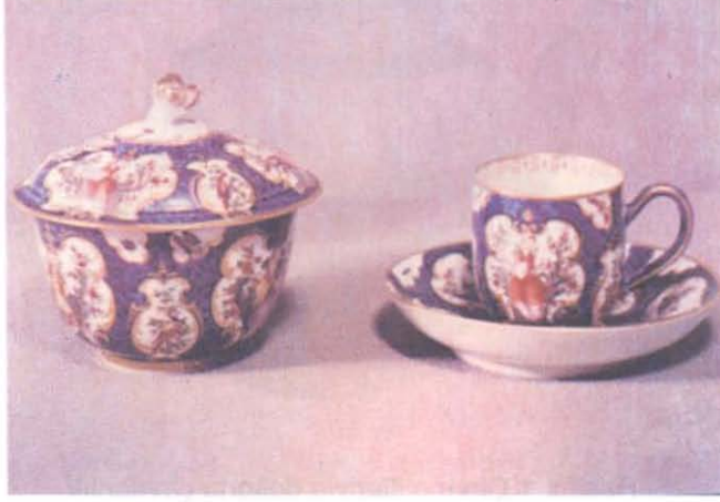
Resim: 3 A.Watteau resimlerine benzer figürlerle desenlenmiş çay fincanı ve şekerlik.