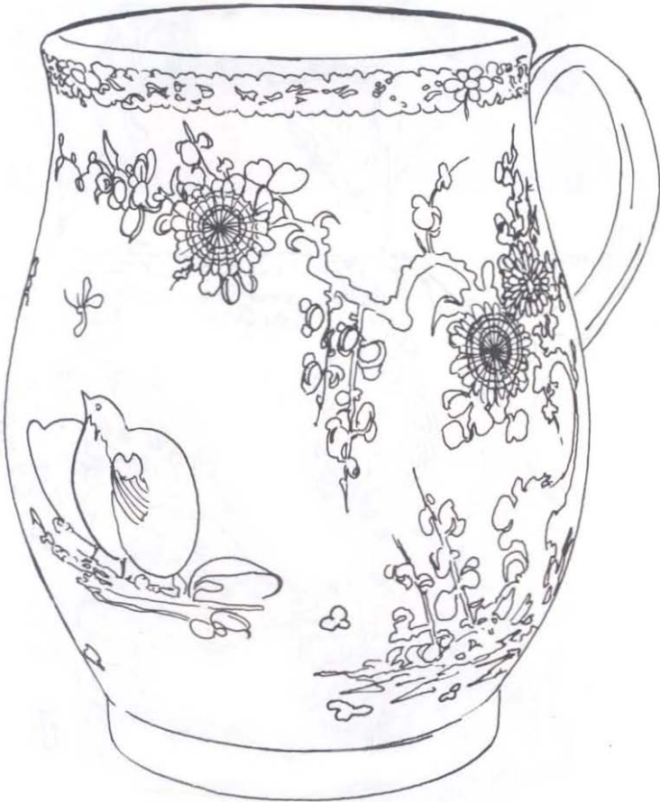
Şekil: 2 Bildircin desenli kakiemon stilinde yapılmış kupa.