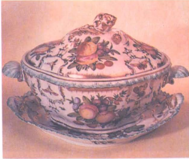
Resim: 4 Gloucester Dükü için hazırlanan servis takımında kapaklı kâse.