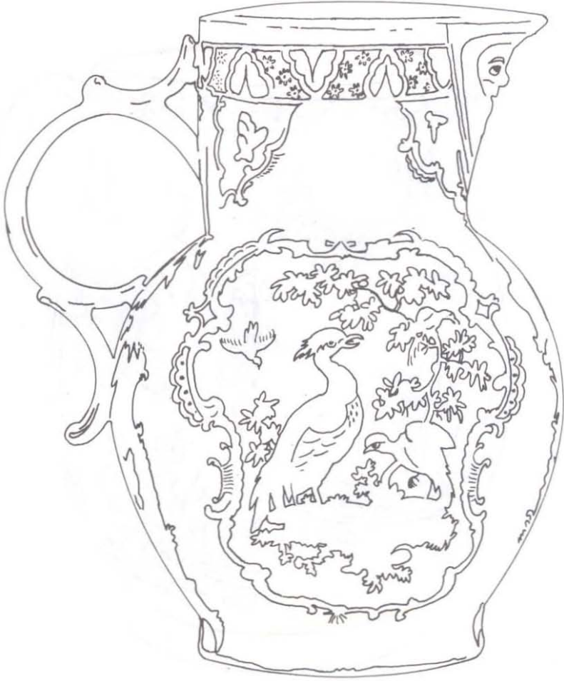
Şekil: 1 Uzakdoğu kuşlarıyla desenlenmiş sürahi.