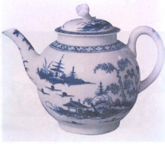
.Resim: 1 Çin motifleriyle dekorlu çaydanlık.