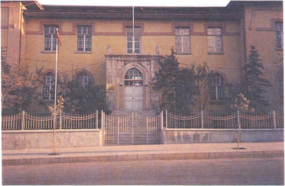
(Resim: 5) Yapının giriş cephesinden ayrıntı