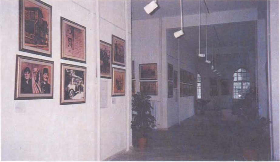
(Resim: 1) Müzenin iç mekanından görünüş(zemin kat)