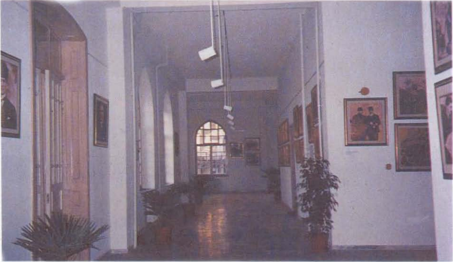
(Resim: 2) Müzenin iç mekanından görünüş(zemin kat)