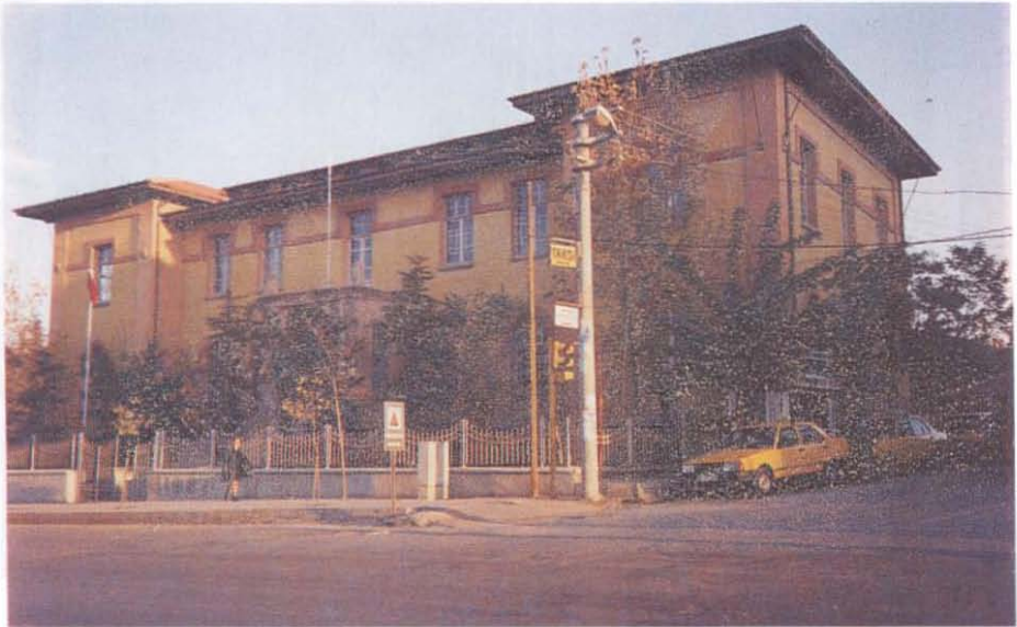
(Resim: 4) Yapının dış görünüşü